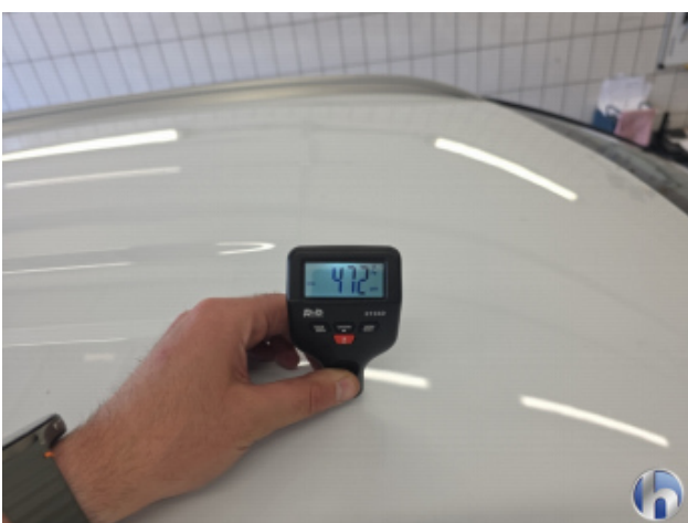
1. Dach Nachlackiert - Ohne Reparatur