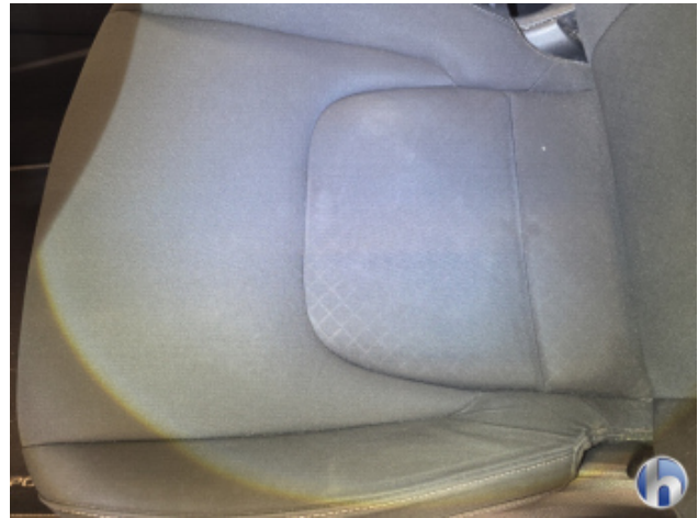
2. Sitz - Vorne - Links: Kissen Fleck - Reinigen