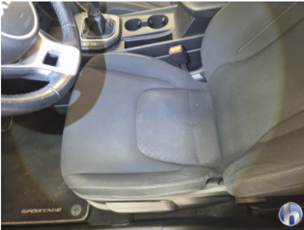
2. Sitz - Vorne - Links: Kissen Fleck - Reinigen