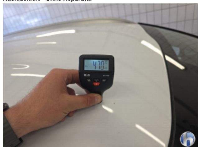
1. Dach Nachlackiert - Ohne Reparatur