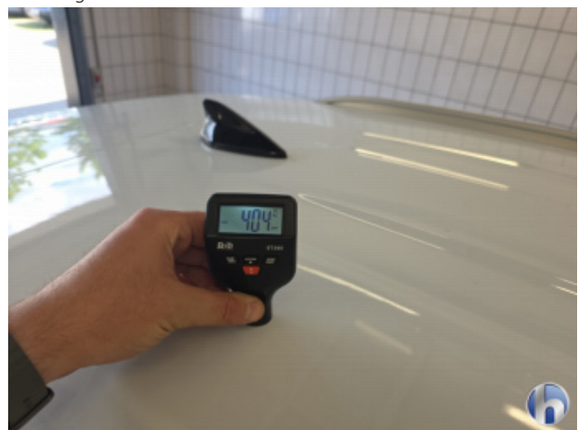
1. Dach Nachlackiert - Ohne Reparatur