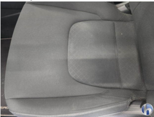
2. Sitz - Vorne - Links: Kissen Fleck - Reinigen