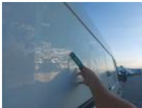
Puerta maletero Tras Dr Abolladuras Reparar + Pintar