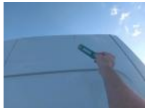
Puerta maletero Tras Iz Abolladuras Reparar + Pintar