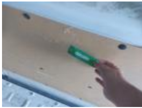
Intermitente Retrovisor Iz Roto Reemplazar