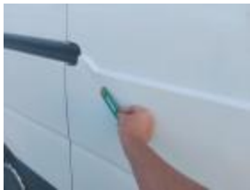
Panel Tras Dr Abolladuras Reparar + Pintar