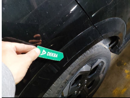
Moldura de aleta / Trasero Derecho / Rayado