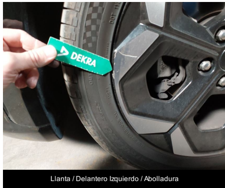
Llanta / Delantero Izquierdo / Abolladura