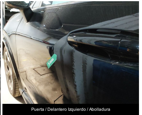
Puerta / Delantero Izquierdo / Abolladura