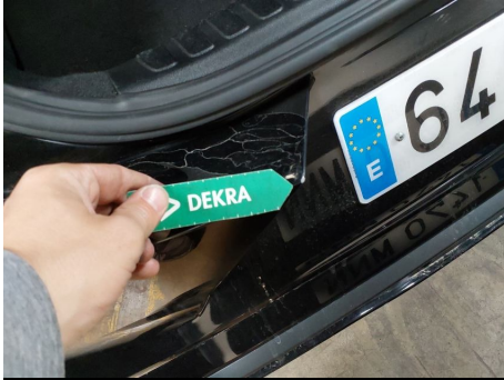
Paragolpes / Trasero / Rayado