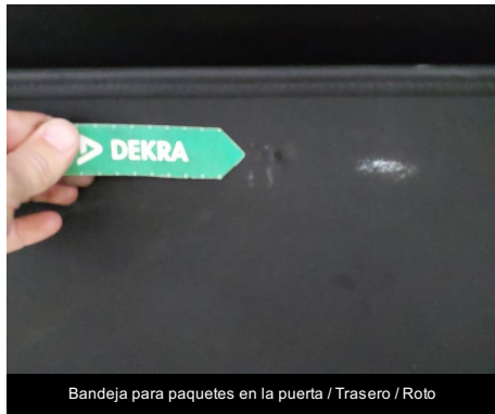
Bandeja para paquetes en la puerta / Trasero / Roto