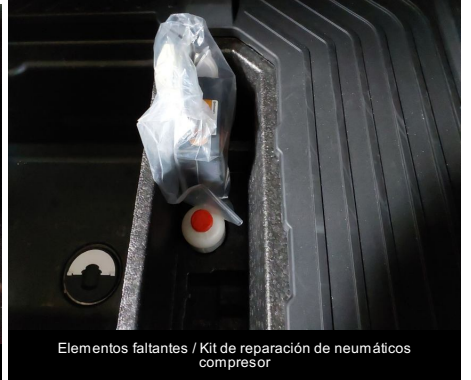
Elementos faltantes / Kit de reparación de neumáticos compresor