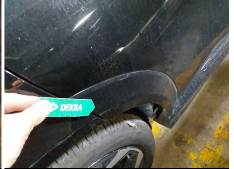
Moldura de puerta / Trasero Derecho / Rayado