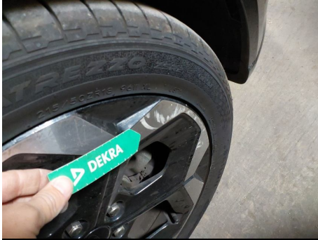
Llanta / Delantero Derecho / Abolladura