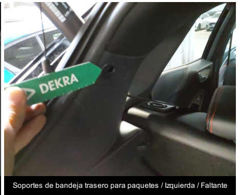
Soportes de bandeja trasero para paquetes / Izquierda / Faltante