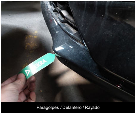
Paragolpes / Delantero / Rayado