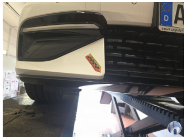
1. Frontspoiler Kratzer - Smart Repair