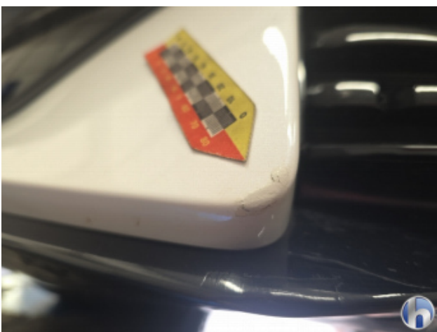
1. Frontspoiler Kratzer - Smart Repair