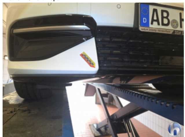
1. Frontspoiler Kratzer - Smart Repair