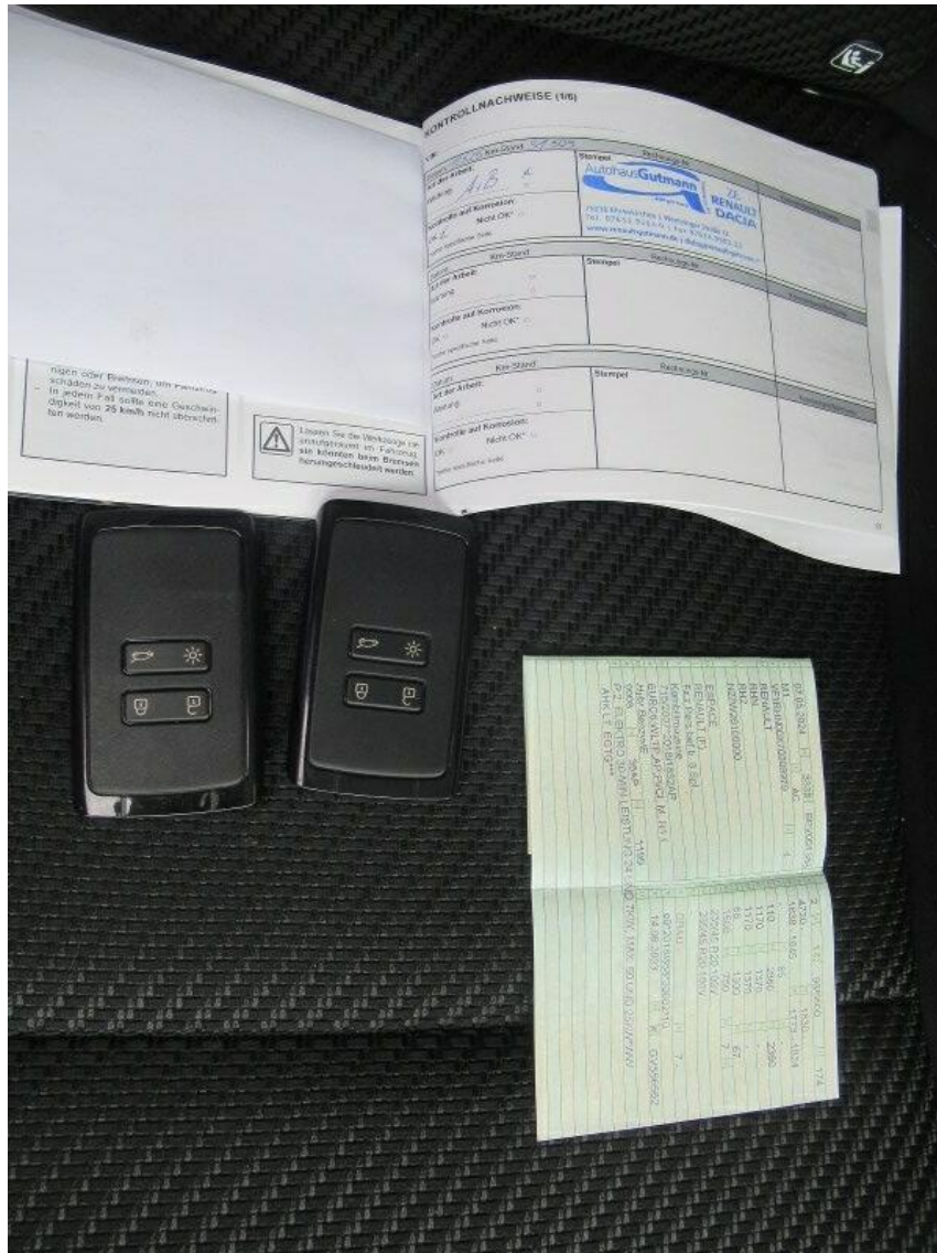
Bild 8 : Alle Fz-Schlüssel, ZLB 1, Letzter Eintrag im Serviceheft