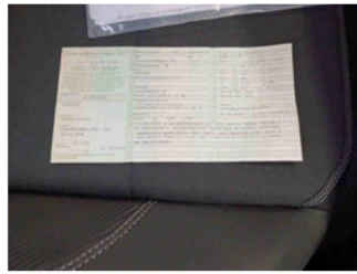
Fahrzeug - abgegebene ZB1