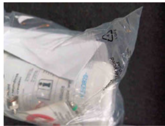
Räder - Haltbarkeitsdatum Tirefit