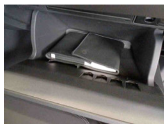
Equipment - Boardmappe/ Securitybag