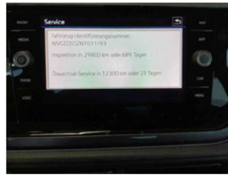
Fahrzeug - Serviceunterlagen / Wartungsnachweis