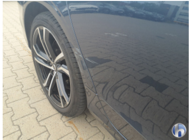
1. Schweller - Rechts Beschädigt - Instandsetzen und Lackieren