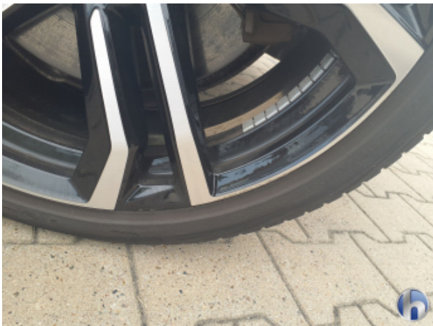
3. Felge Vorne - Rechts Kratzer - Smart Repair