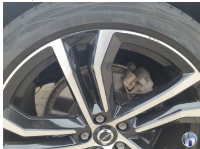
2. Felge Hinten - Rechts Kratzer - Smart Repair