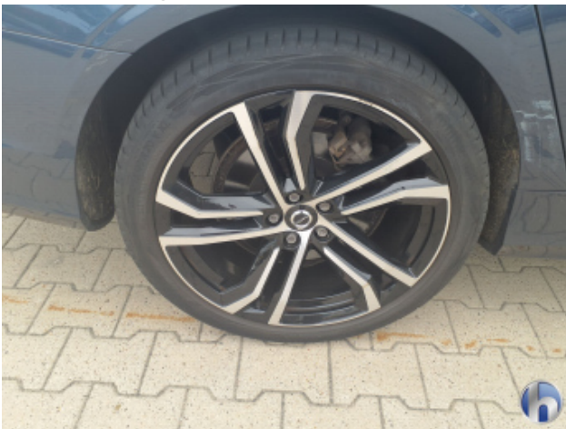
2. Felge Hinten - Rechts Kratzer - Smart Repair