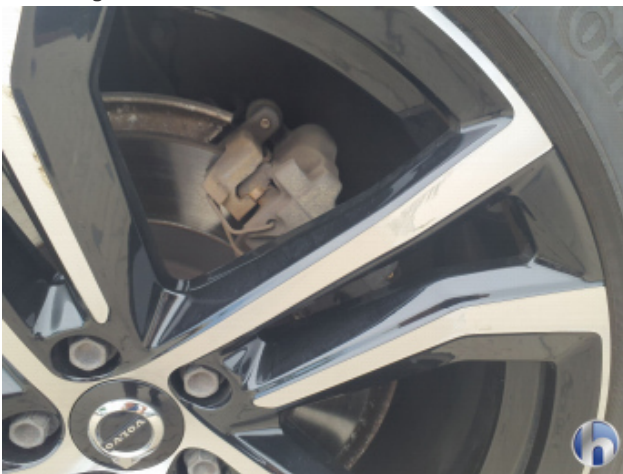
2. Felge Hinten - Rechts Kratzer - Smart Repair