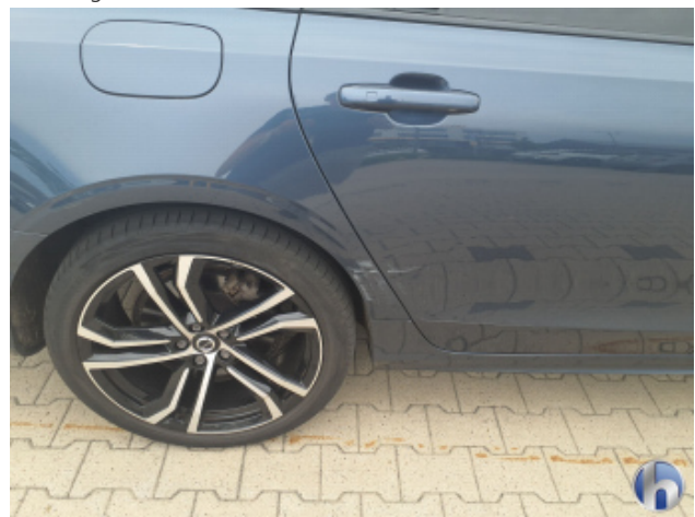
1. Schweller - Rechts Beschädigt - Instandsetzen und Lackieren