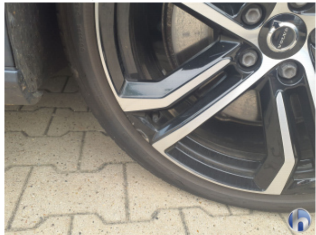
3. Felge Vorne - Rechts Kratzer - Smart Repair