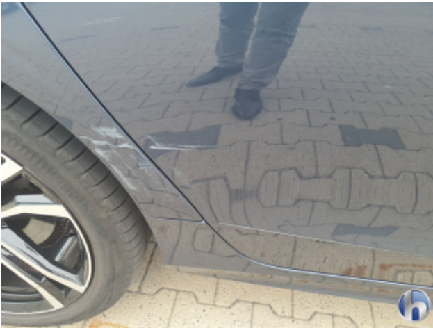
1. Schweller - Rechts Beschädigt - Instandsetzen und Lackieren