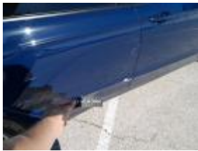
Puerta Delant Dr