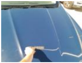
Aleta Tras Dr