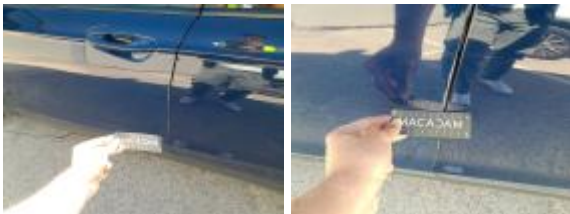
Aleta Tras Iz Rayado Reparar + Pintar