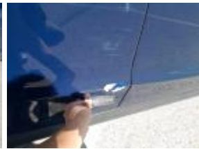
Reparar + Pintar