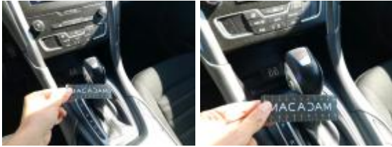
Tarjeta De Matriculación Falta Importe