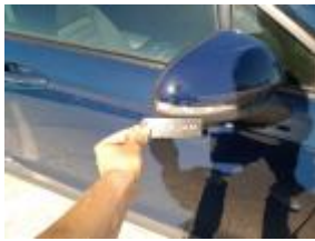
Aleta Del Dr