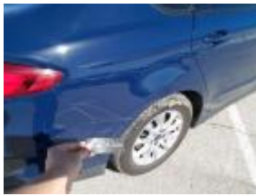
Puerta Tras Dr