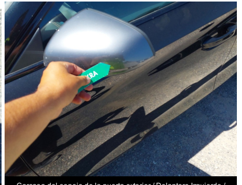
Carcasa del espejo de la puerta exterior / Delantero Izquierdo / Rayado