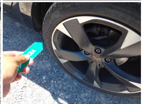
Llanta / Trasero izquierdo / Rayado