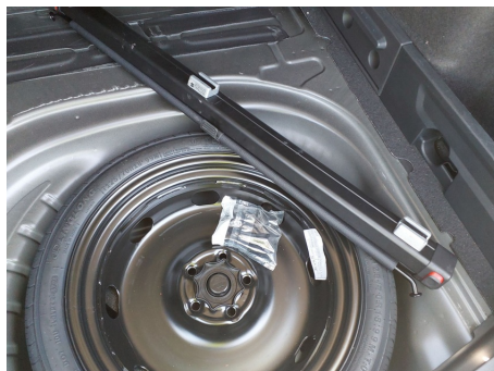
Elementos faltantes / Neumático de rueda de repuesto