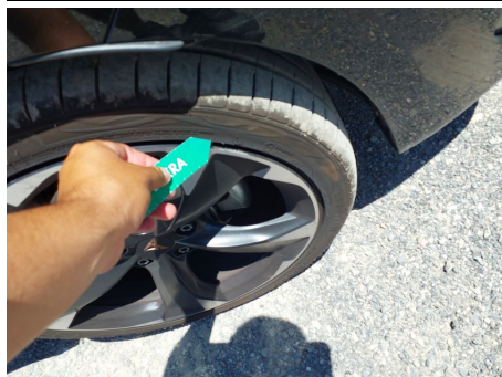
Neumático / Delantero Derecho / Desgarro