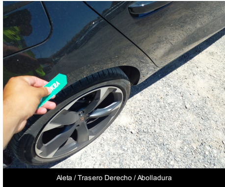
Aleta / Trasero Derecho / Abolladura