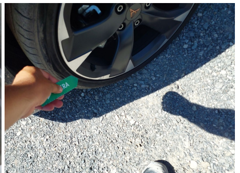
Llanta / Delantero izquierdo / Rayado