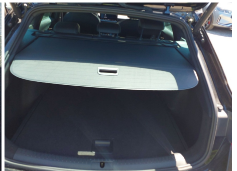
Elementos faltantes / Cubierta de carga