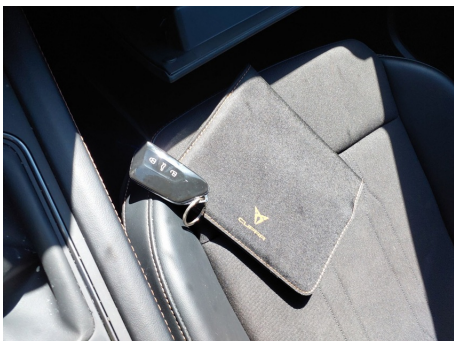
Elementos faltantes / Libro de mantenimiento