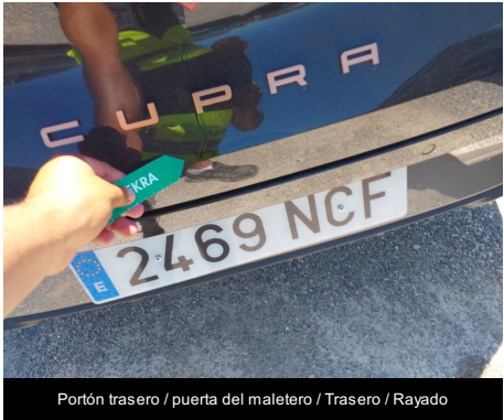
Portón trasero / puerta del maletero / Trasero / Rayado