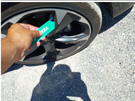
Llanta / Delantero Derecho / Rayado