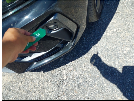
Embellecedor de luz antiniebla / Delantero Izquierdo / Rayado