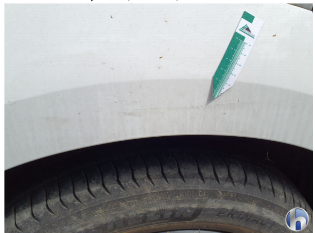
2. Seitenwand - Hinten - Rechts Oberflächenkratzer - Aufbereiten / Polieren 0,00 € / 0,00 €