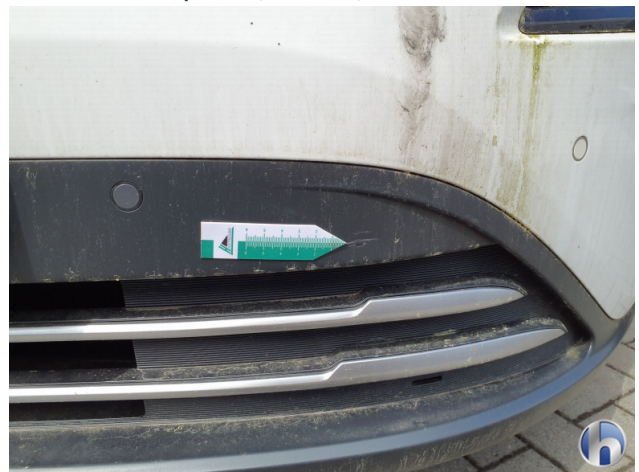
1. Stoßfänger Vorne Kratzer - Smart Repair 120,00 € / 120,00 €