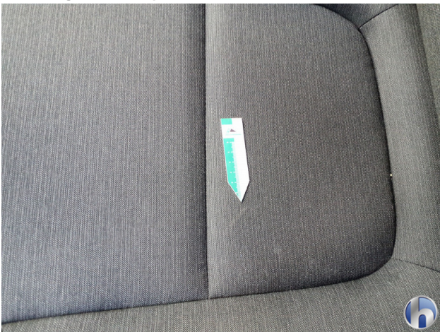
5. Sitz Innenraum links vorne Verschmutzt - Reinigen 120,00 € / 120,00 €