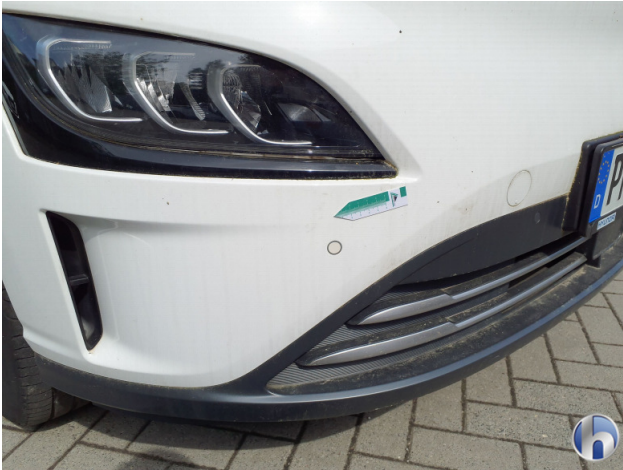
1. Stoßfänger Vorne Kratzer - Smart Repair 120,00 € / 120,00 €