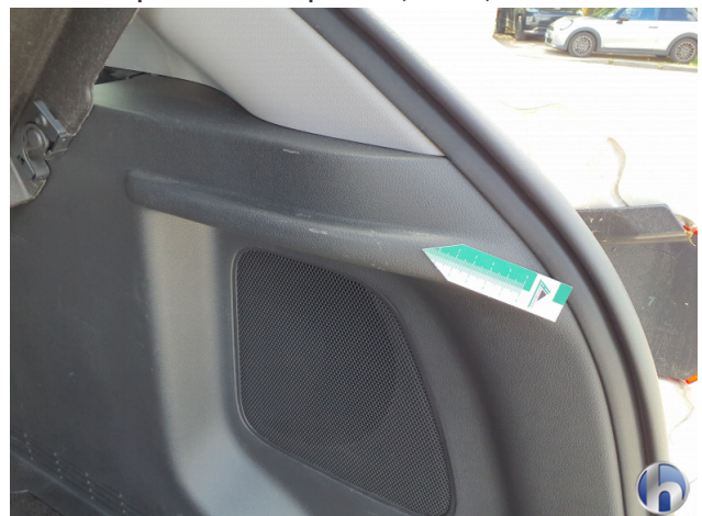
3. Innenraum Gebrauchsspuren - Ohne Reparatur 0,00 € / 0,00 €