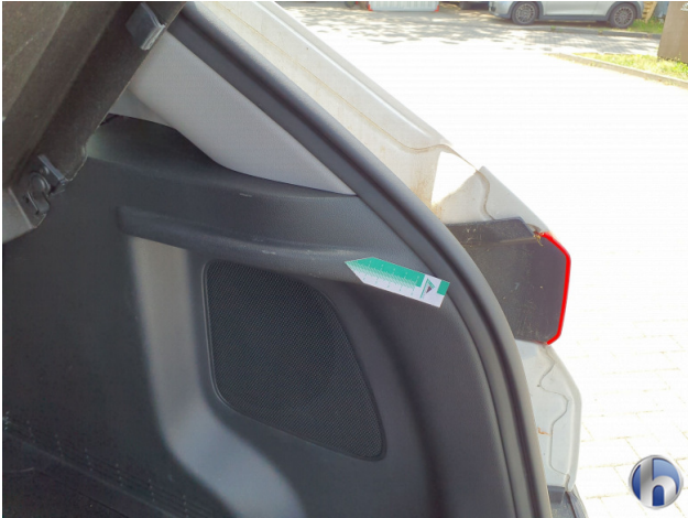
3. Innenraum Gebrauchsspuren - Ohne Reparatur 0,00 € / 0,00 €