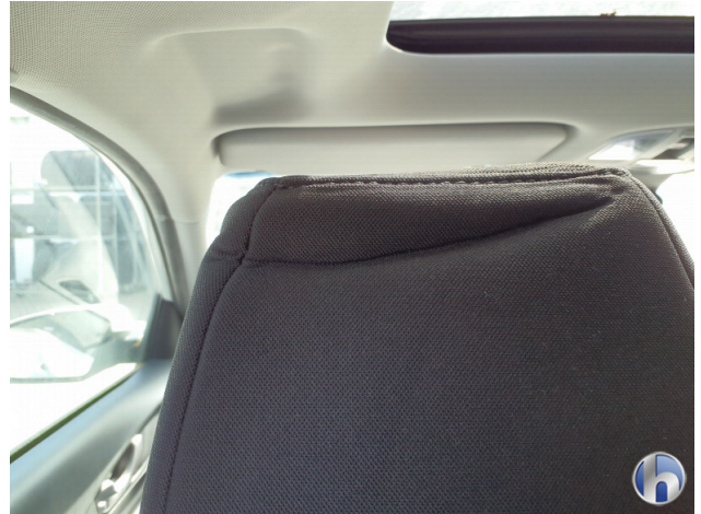
4. Sitz Innenraum links vorne Beschädigt - Smart Repair 100,00 € / 100,00 €