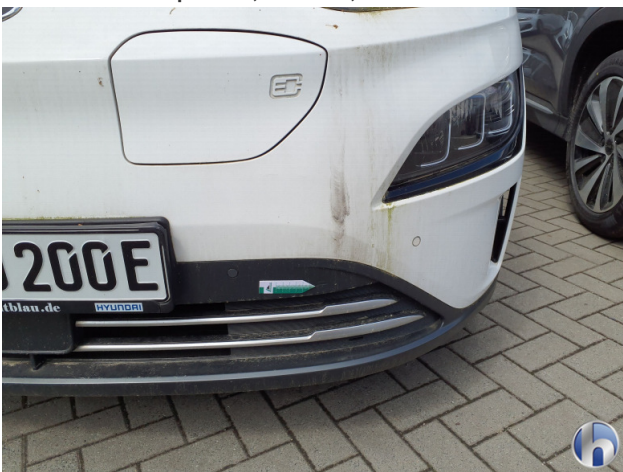
1. Stoßfänger Vorne Kratzer - Smart Repair 120,00 € / 120,00 €