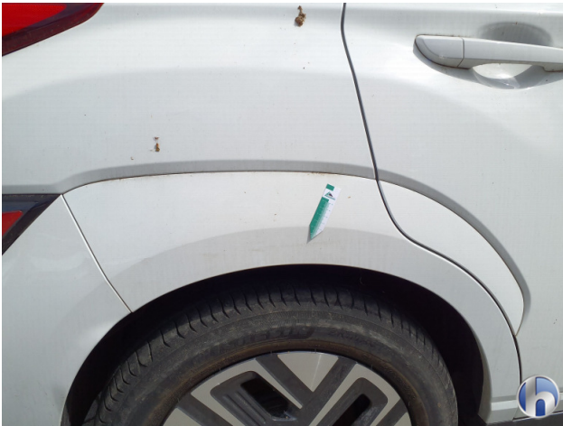
2. Seitenwand - Hinten - Rechts Oberflächenkratzer - Aufbereiten / Polieren 0,00 € / 0,00 €