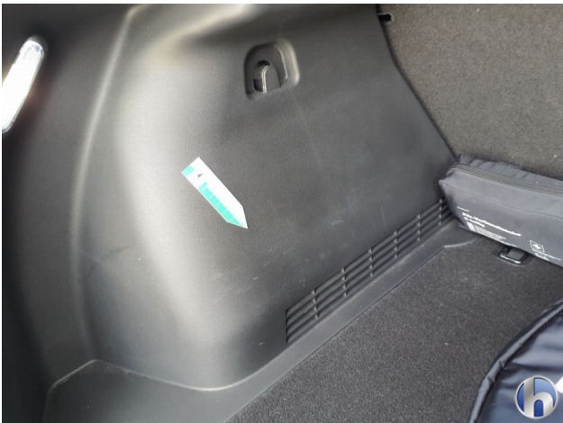
3. Innenraum Gebrauchsspuren - Ohne Reparatur 0,00 € / 0,00 €