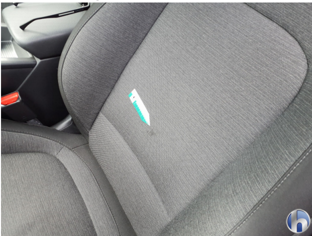
5. Sitz Innenraum links vorne Verschmutzt - Reinigen 120,00 € / 120,00 €