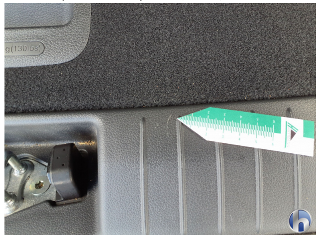
3. Innenraum Gebrauchsspuren - Ohne Reparatur 0,00 € / 0,00 €