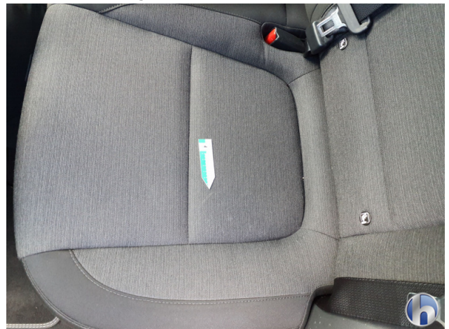
5. Sitz Innenraum links vorne Verschmutzt - Reinigen 120,00 € / 120,00 €