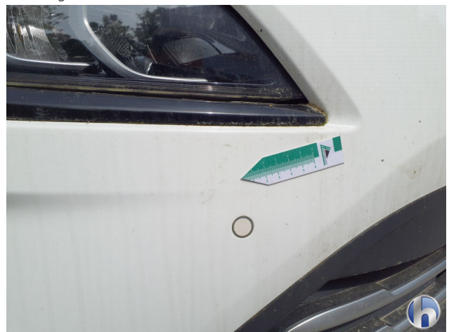
1. Stoßfänger Vorne Kratzer - Smart Repair 120,00 € / 120,00 €