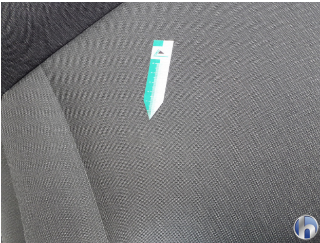
5. Sitz Innenraum links vorne Verschmutzt - Reinigen 120,00 € / 120,00 €