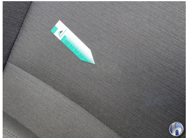
5. Sitz Innenraum links vorne Verschmutzt - Reinigen 120,00 € / 120,00 €