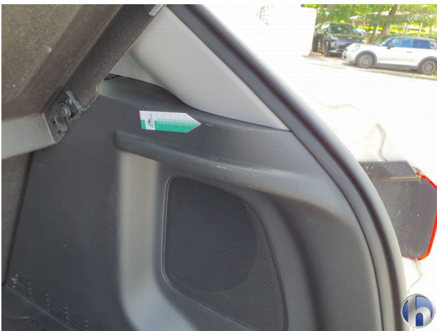
3. Innenraum Gebrauchsspuren - Ohne Reparatur 0,00 € / 0,00 €