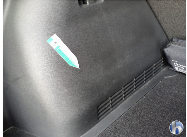
3. Innenraum Gebrauchsspuren - Ohne Reparatur 0,00 € / 0,00 €