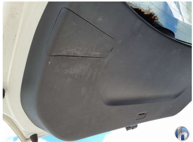
3. Innenraum Gebrauchsspuren - Ohne Reparatur 0,00 € / 0,00 €