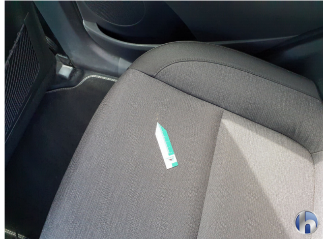
5. Sitz Innenraum links vorne Verschmutzt - Reinigen 120,00 € / 120,00 €