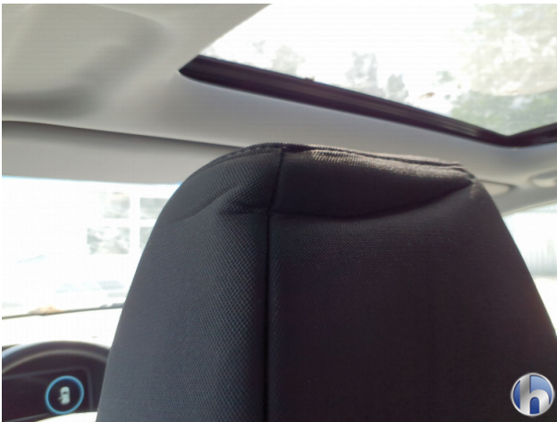
4. Sitz Innenraum links vorne Beschädigt - Smart Repair 100,00 € / 100,00 €