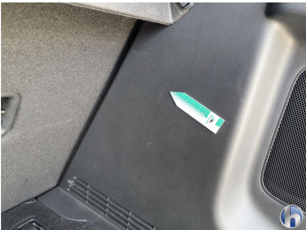
3. Innenraum Gebrauchsspuren - Ohne Reparatur 0,00 € / 0,00 €