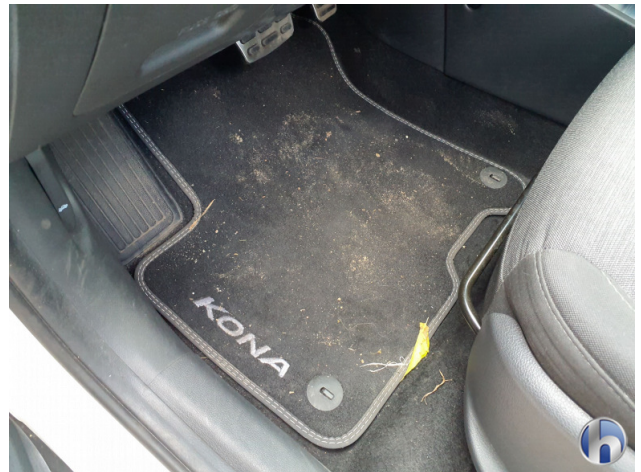
5. Sitz Innenraum links vorne Verschmutzt - Reinigen 120,00 € / 120,00 €