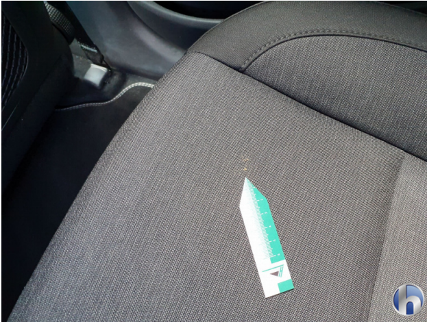
5. Sitz Innenraum links vorne Verschmutzt - Reinigen 120,00 € / 120,00 €