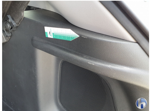
3. Innenraum Gebrauchsspuren - Ohne Reparatur 0,00 € / 0,00 €