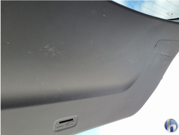
3. Innenraum Gebrauchsspuren - Ohne Reparatur 0,00 € / 0,00 €