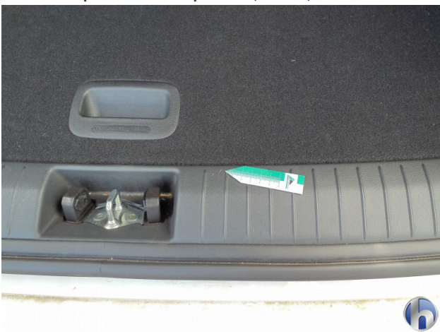
3. Innenraum Gebrauchsspuren - Ohne Reparatur 0,00 € / 0,00 €