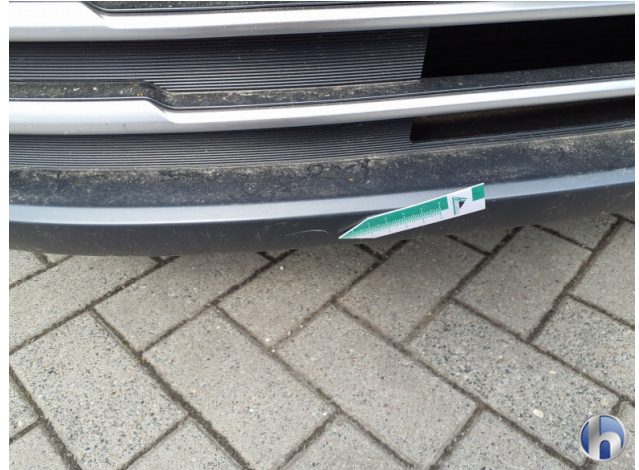
1. Stoßfänger Vorne Kratzer - Smart Repair 120,00 € / 120,00 €