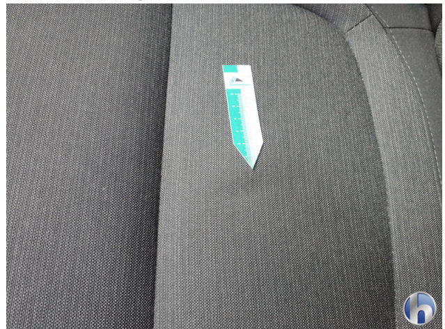
5. Sitz Innenraum links vorne Verschmutzt - Reinigen 120,00 € / 120,00 €