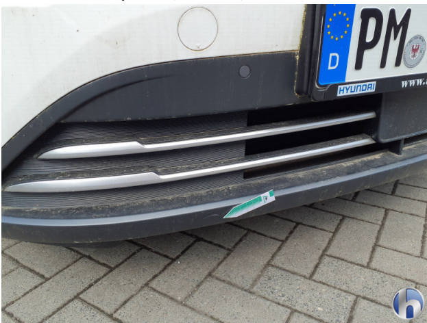
1. Stoßfänger Vorne Kratzer - Smart Repair 120,00 € / 120,00 €