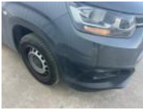
Aleta Del Dr