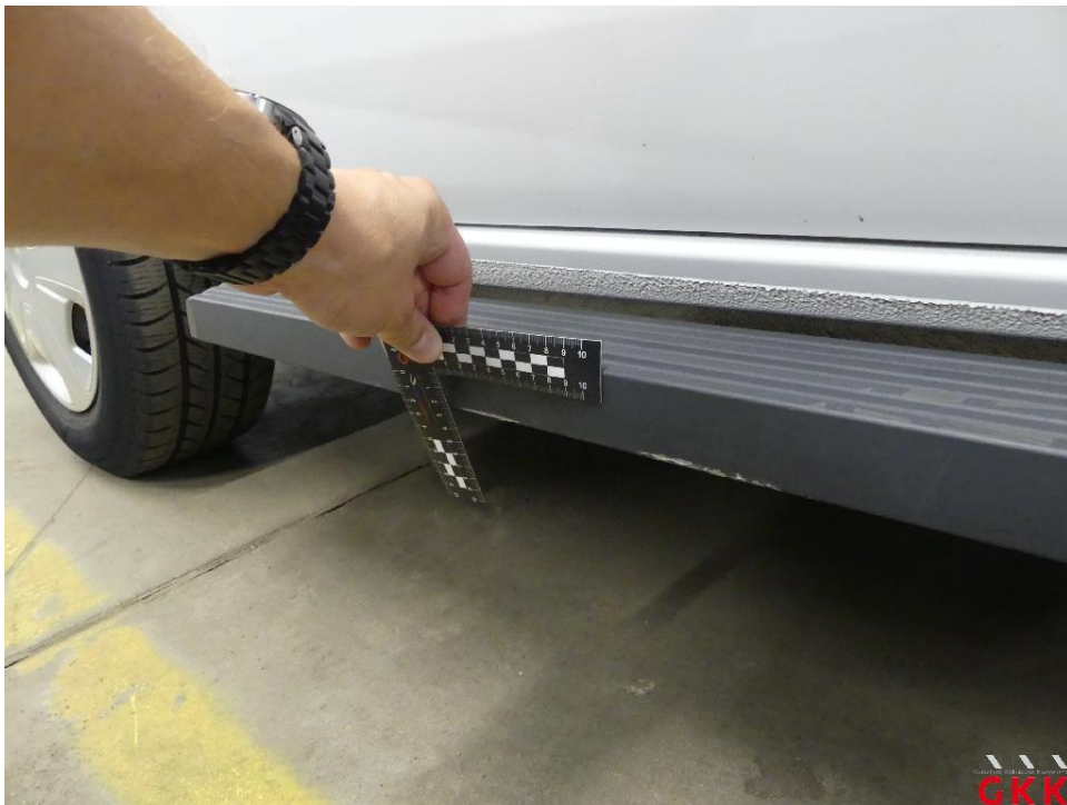
Bild 16 Trittbrett rechts, verkratzt, Smartrepair