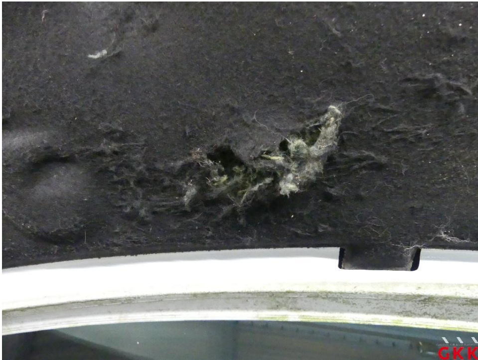
Bild 15 Motorhaube, Dämmmatte, beschädigt, ersetzen