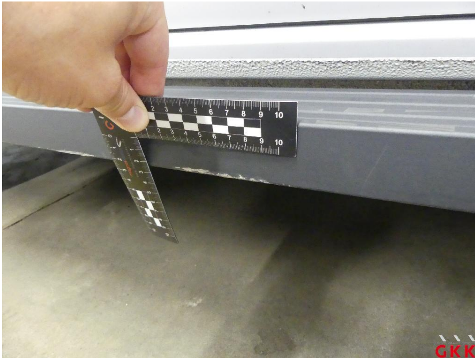
Bild 17 Trittbrett rechts, verkratzt, Smartrepair