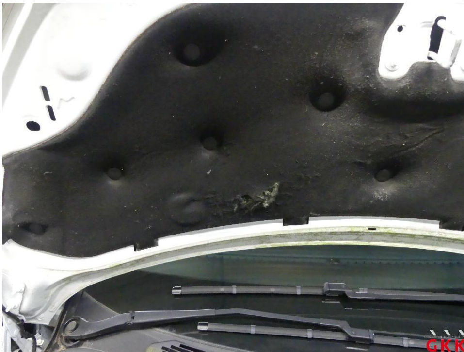
Bild 14 Motorhaube, Dämmmatte, beschädigt, ersetzen