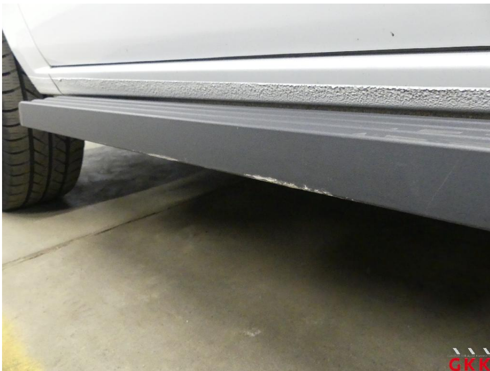
Bild 18 Trittbrett rechts, verkratzt, Smartrepair