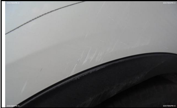
Foto daños externos 1