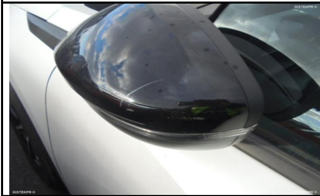
Foto daños externos 1