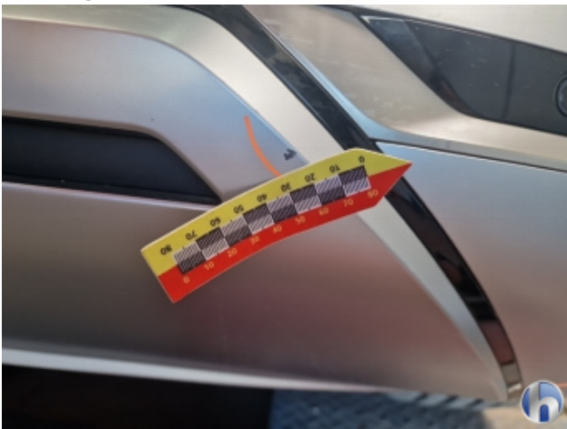
2. Stoßfänger Hinten Beschädigt - Instandsetzen und Lackieren