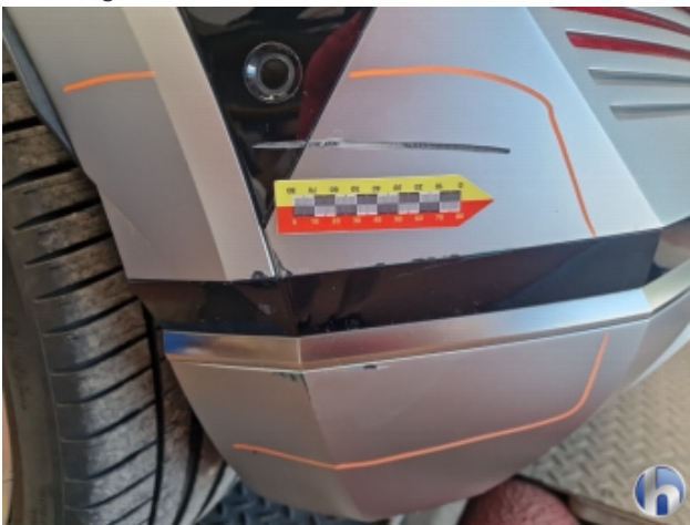
2. Stoßfänger Hinten Beschädigt - Instandsetzen und Lackieren