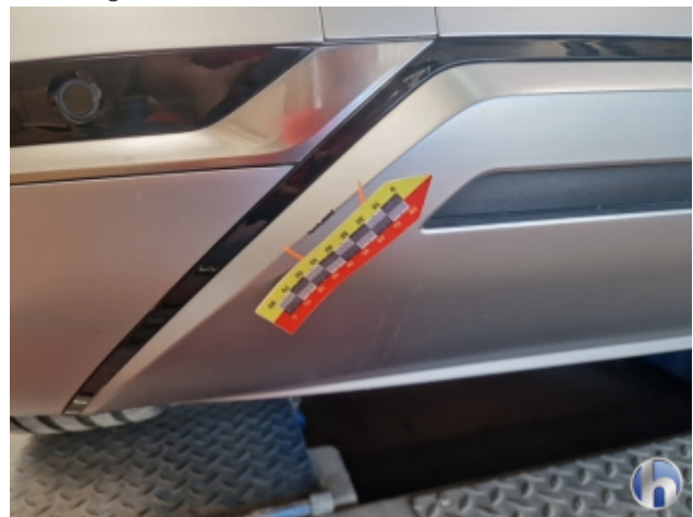
2. Stoßfänger Hinten Beschädigt - Instandsetzen und Lackieren