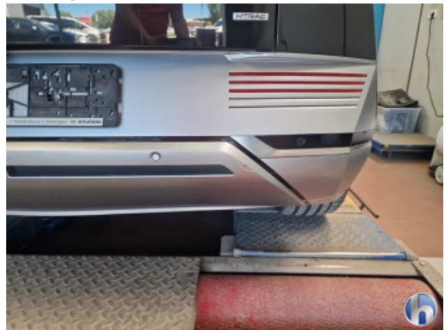
2. Stoßfänger Hinten Beschädigt - Instandsetzen und Lackieren