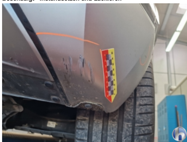
2. Stoßfänger Hinten Beschädigt - Instandsetzen und Lackieren