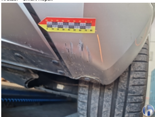
2. Stoßfänger Hinten Beschädigt - Instandsetzen und Lackieren