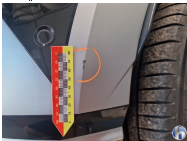
2. Stoßfänger Hinten Beschädigt - Instandsetzen und Lackieren