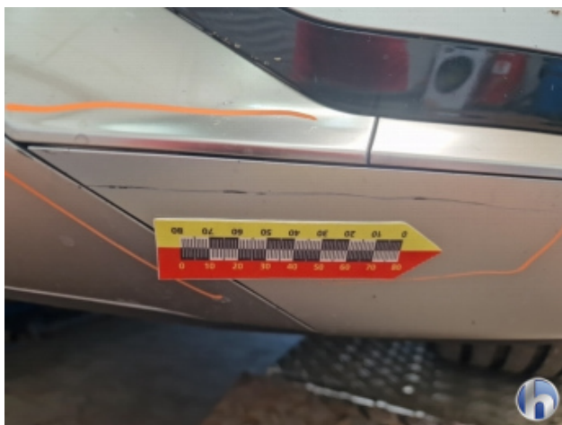
1. Stoßfänger Vorne Kratzer - Smart Repair