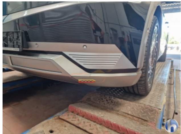
1. Stoßfänger Vorne Kratzer - Smart Repair