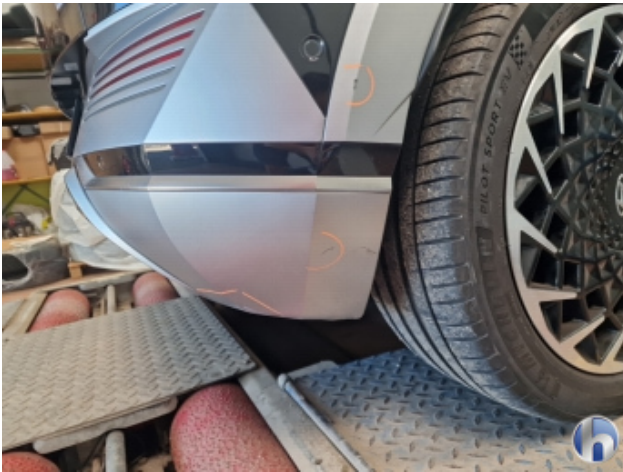
2. Stoßfänger Hinten Beschädigt - Instandsetzen und Lackieren