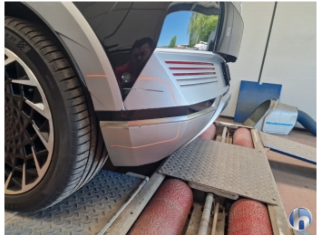
2. Stoßfänger Hinten Beschädigt - Instandsetzen und Lackieren