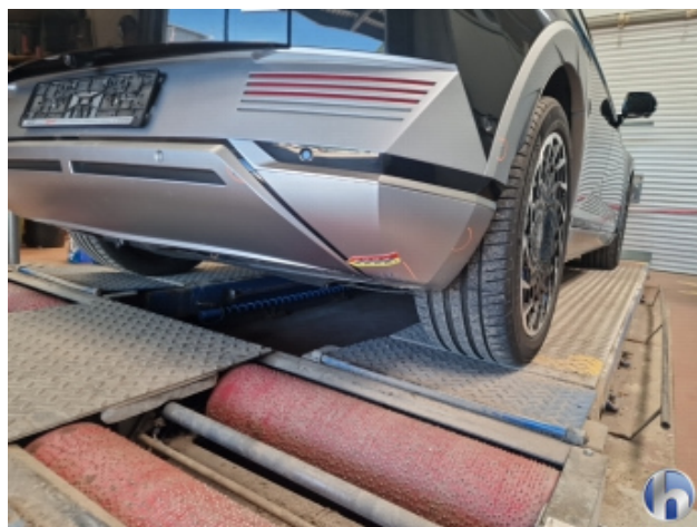
2. Stoßfänger Hinten Beschädigt - Instandsetzen und Lackieren