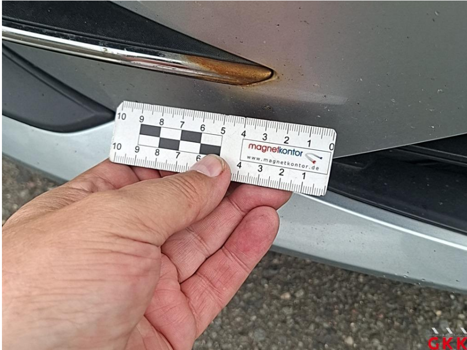
Bild 15. Stoßfänger vorne, Blende -lackiert-, beschädigt, ersetzen