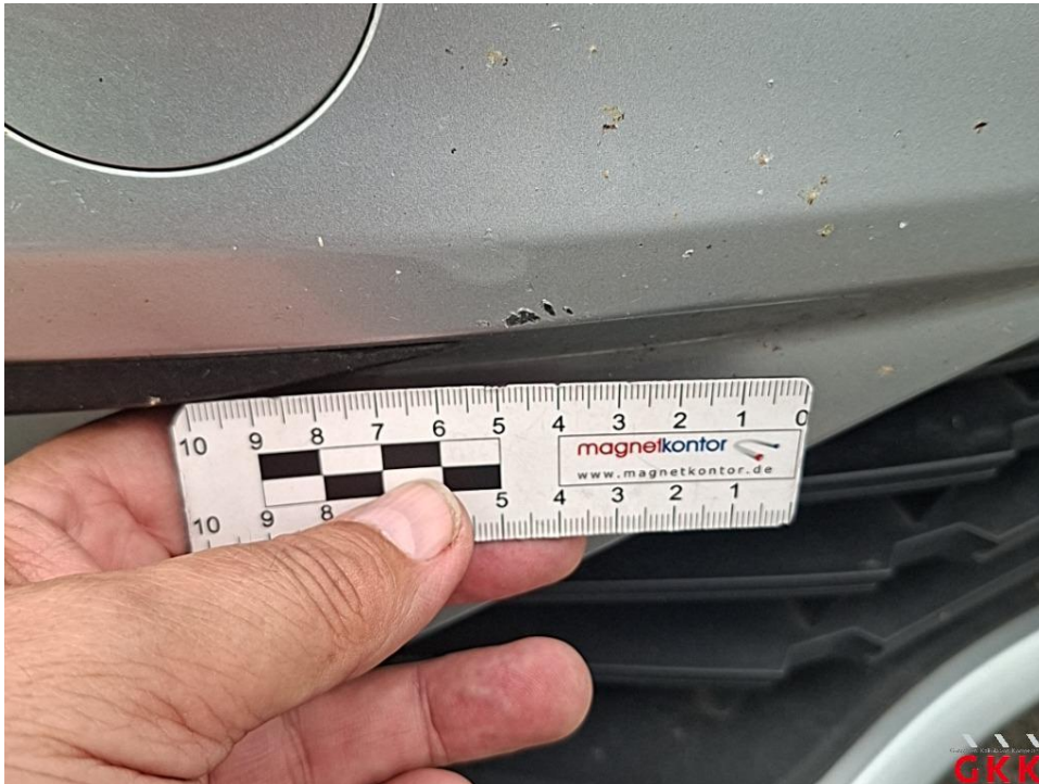
Bild 13. Stoßfänger vorne, Verkleidung -lackiert-, verkratzt, lackieren