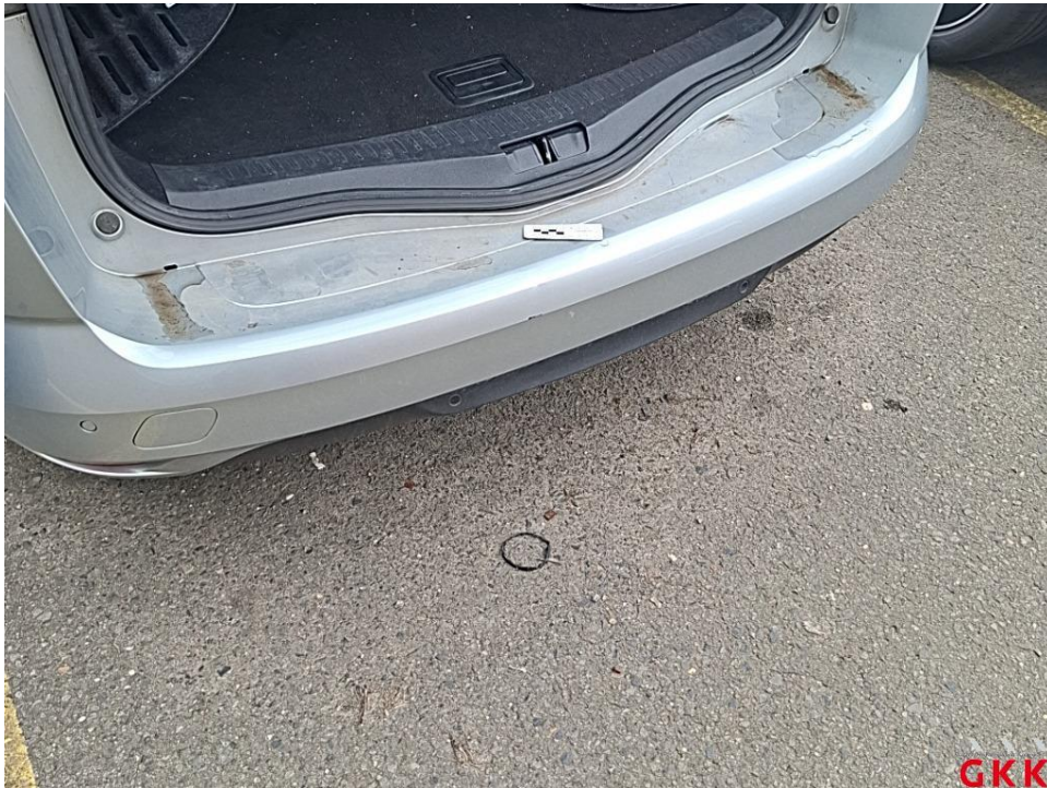
Bild 21. Stoßfänger hinten, Verkleidung -lackiert-, beschädigt, ersetzen