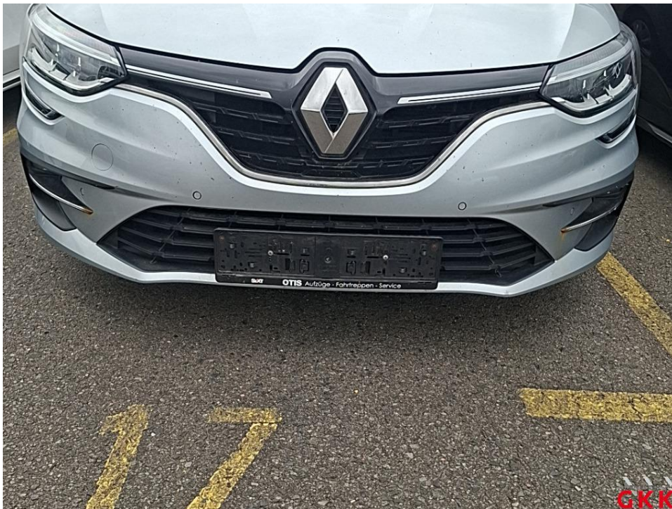
Bild 14. Stoßfänger vorne, Blende -lackiert-, beschädigt, ersetzen