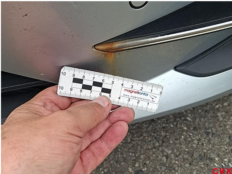
Bild 16. Stoßfänger vorne, Blende -lackiert-, beschädigt, ersetzen