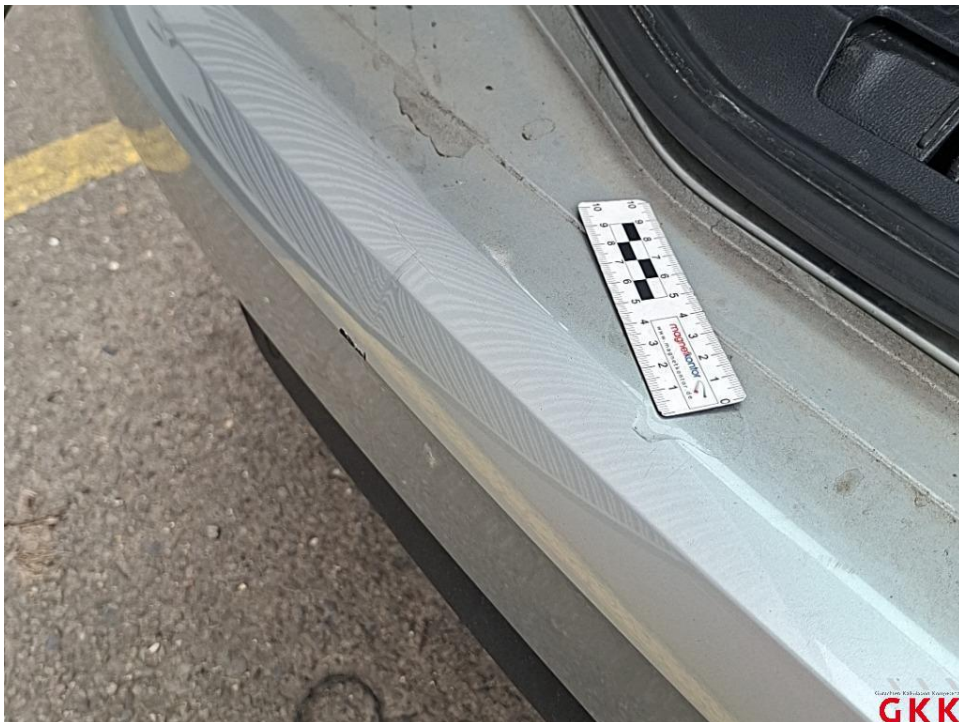
Bild 22. Stoßfänger hinten, Verkleidung -lackiert-, beschädigt, ersetzen