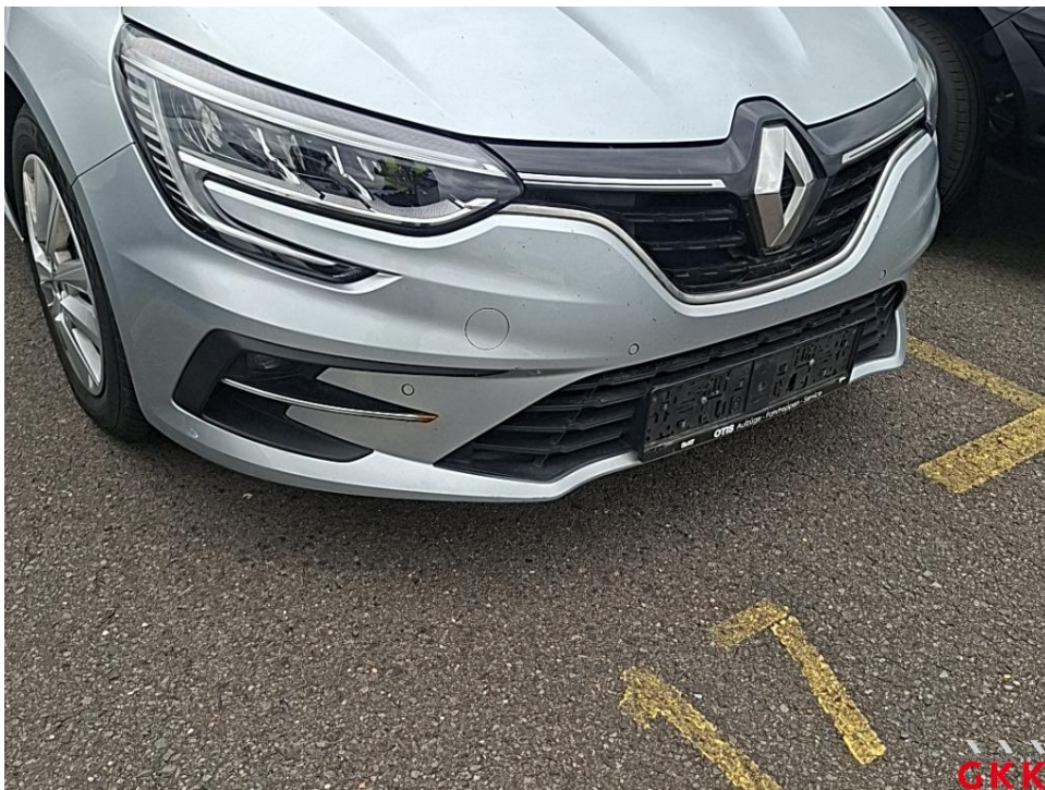
Bild 12. Stoßfänger vorne, Verkleidung -lackiert-, verkratzt, lackieren