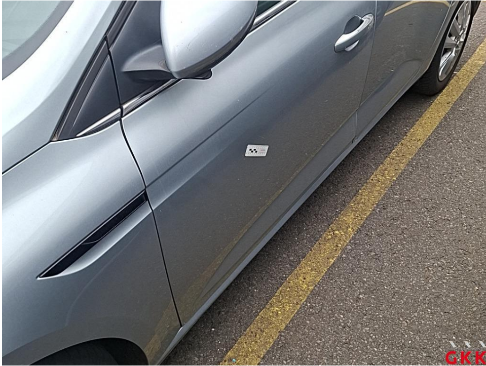
Bild 19. Tür vorne links, verkratzt, lackieren