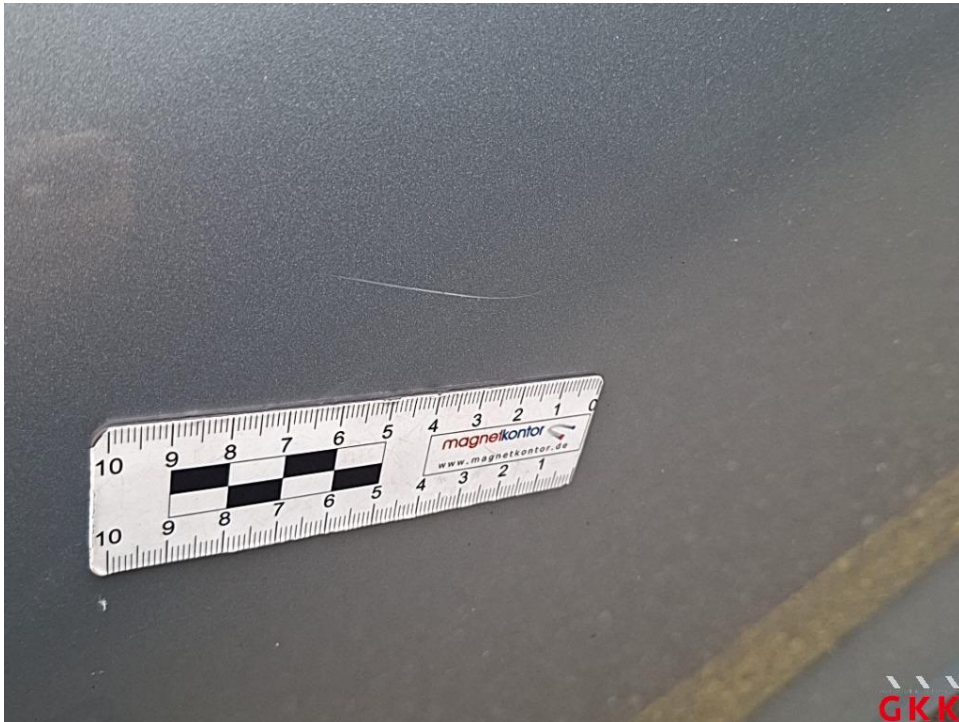
Bild 20. Tür vorne links, verkratzt, lackieren