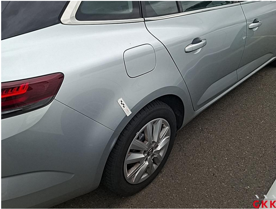
Bild 23. Seitenwand rechts, verkratzt, lackieren