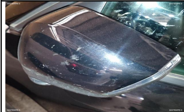
Carcasa ret. izq