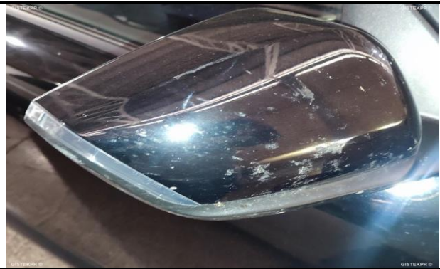
Carcasa ret. dch