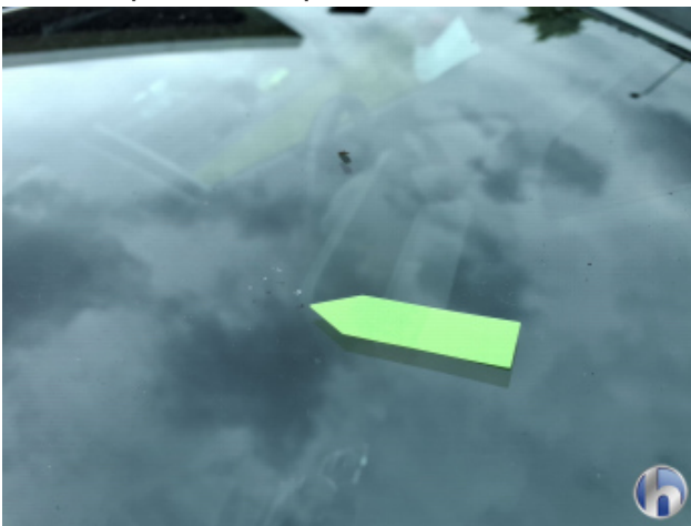
2. Windschutzscheibe Gebrauchsspuren - Ohne Reparatur