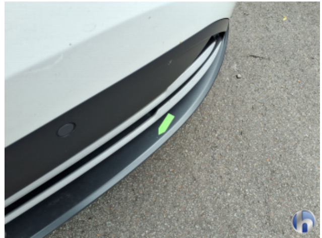
1. Stoßfänger Vorne Gebrauchsspuren - Ohne Reparatur