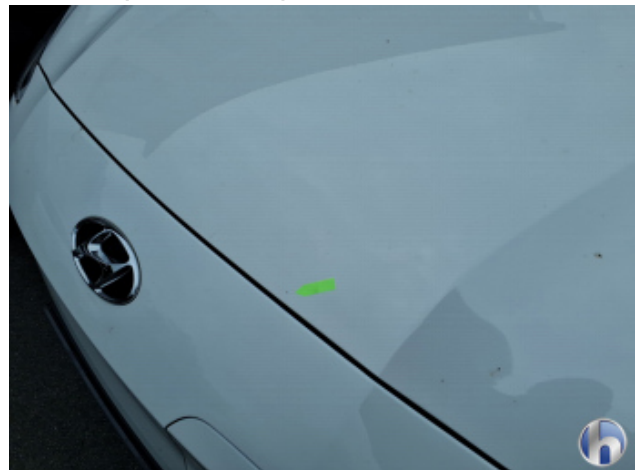
5. Motorhaube Gebrauchsspuren - Ohne Reparatur