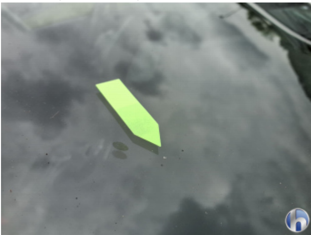
2. Windschutzscheibe Gebrauchsspuren - Ohne Reparatur