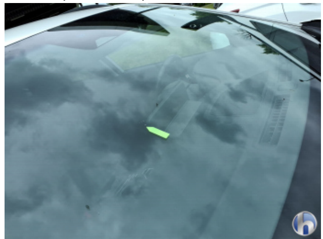
2. Windschutzscheibe Gebrauchsspuren - Ohne Reparatur