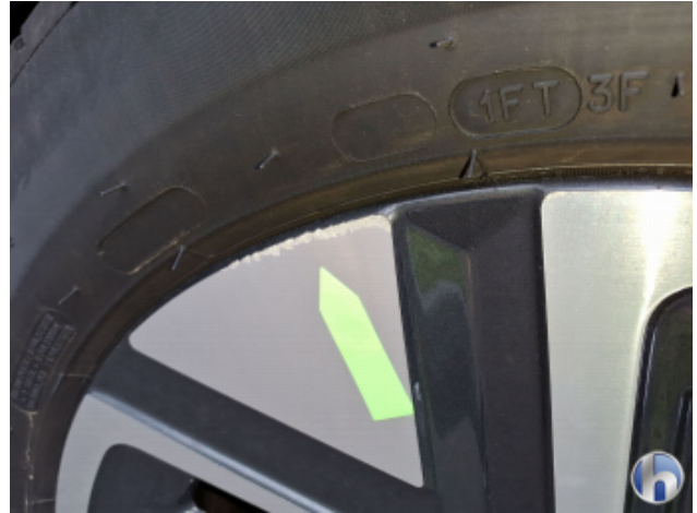
3. Felge Hinten - Links Kratzer - Smart Repair