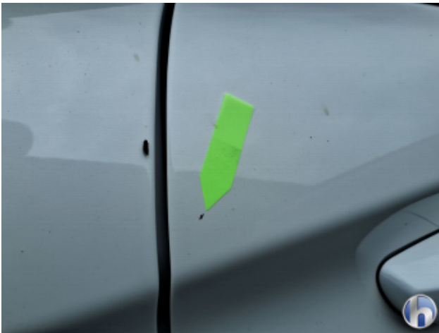
4. Tür Hinten - Rechts Gebrauchsspuren - Ohne Reparatur