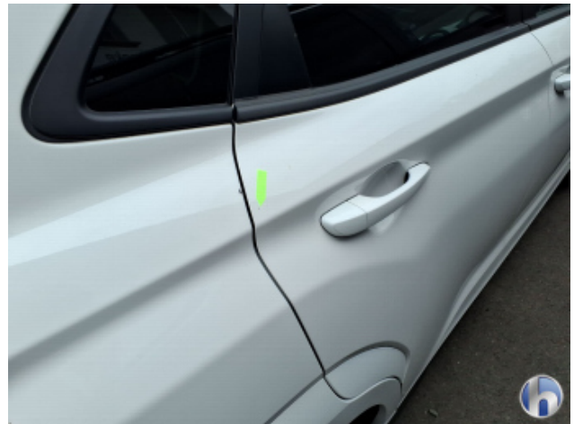
4. Tür Hinten - Rechts Gebrauchsspuren - Ohne Reparatur