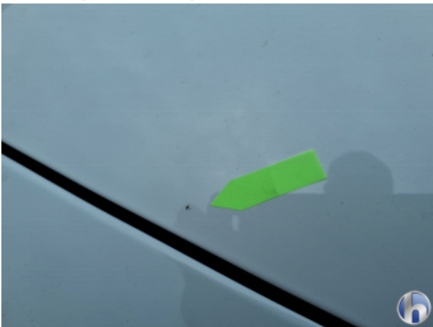
5. Motorhaube Gebrauchsspuren - Ohne Reparatur