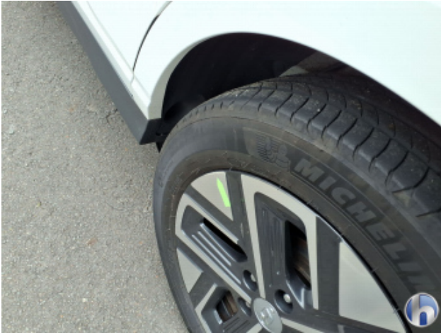
3. Felge Hinten - Links Kratzer - Smart Repair