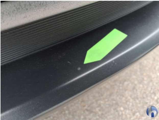
1. Stoßfänger Vorne Gebrauchsspuren - Ohne Reparatur