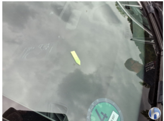
2. Windschutzscheibe Gebrauchsspuren - Ohne Reparatur