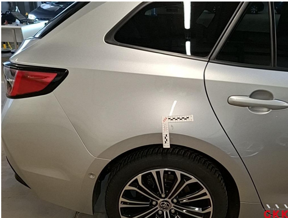
Bild 20 Seitenwand rechts, Harzhaftungen/-rückstände, aufbereiten