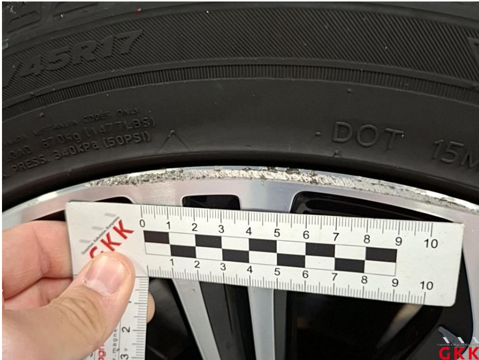
Bild 19 LM-Rad, vorne rechts, verkratzt, ersetzen