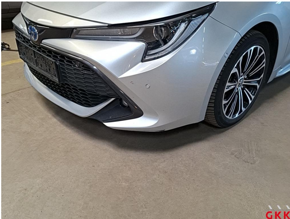
Bild 16 Stoßfänger vorne, Verkleidung -lackiert-, verkratzt, Smartrepair