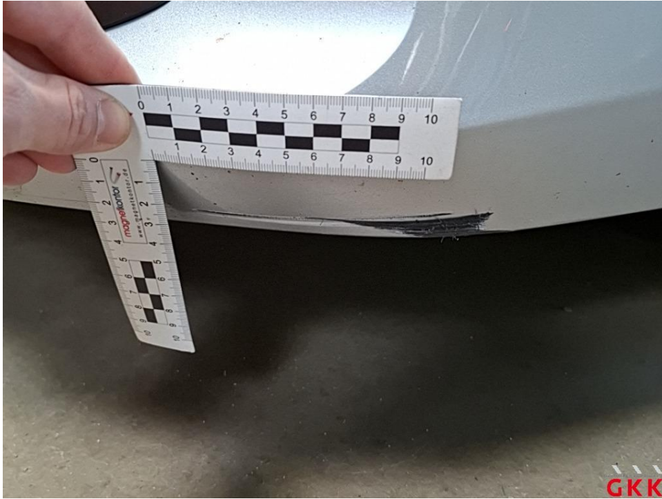
Bild 17 Stoßfänger vorne, Verkleidung -lackiert-, verkratzt, Smartrepair