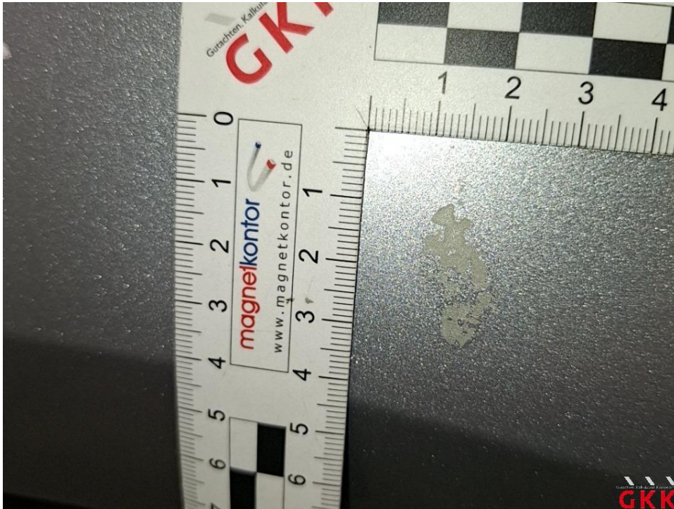
Bild 21 Seitenwand rechts, Harzanhaftungen/-rückstände, aufbereiten