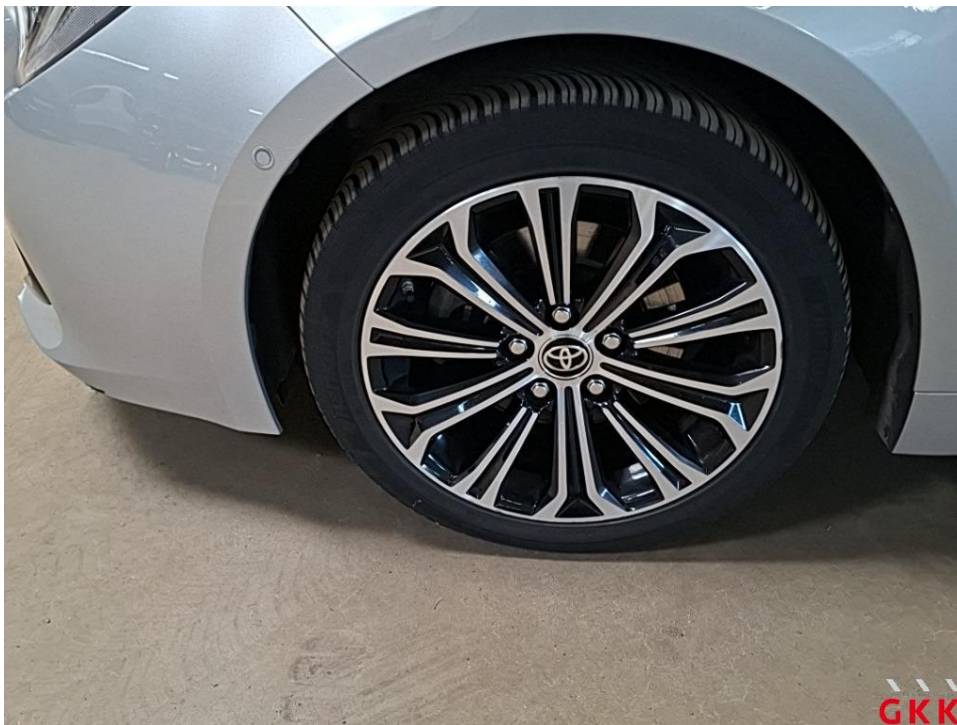
Bild 14 LM-Rad, vorne links, verkratzt, ersetzen