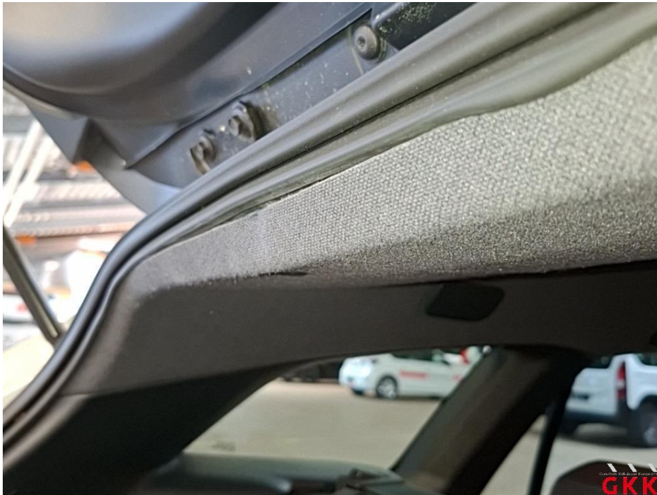
Bild 25 Himmel, hinten, Druckstellen, Smartrepair