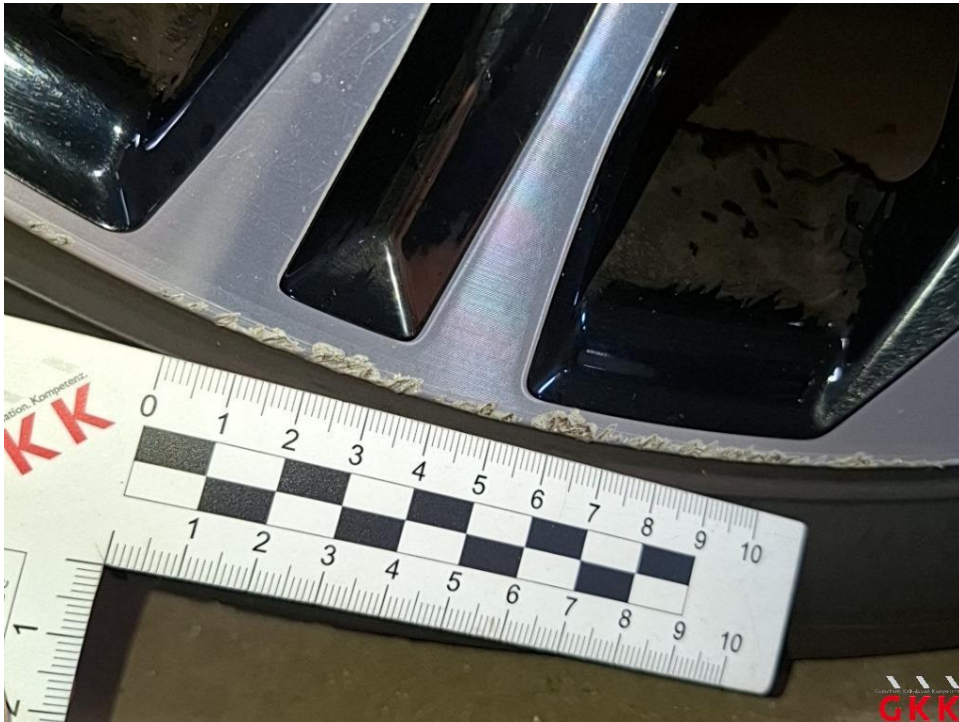
Bild 15 LM-Rad, vorne links, verkratzt, ersetzen