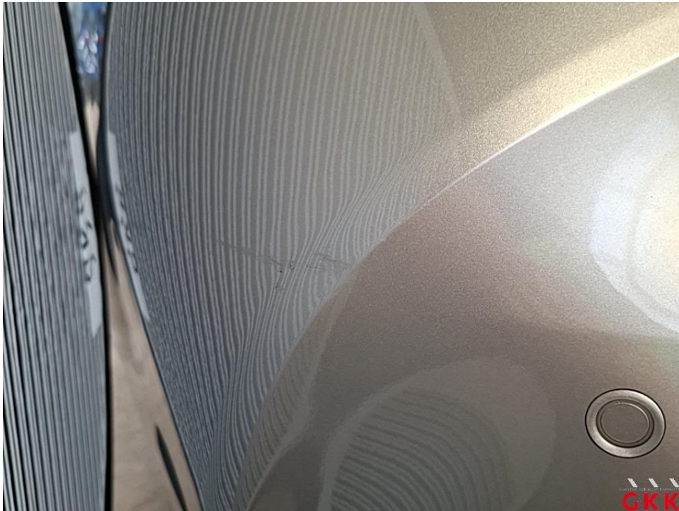
Bild 23 Stoßfänger hinten, Verkleidung -lackiert-, verkratzt, lackieren