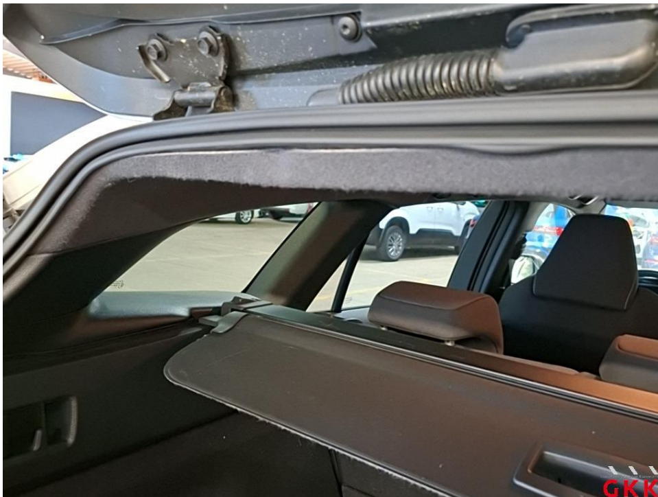
Bild 24 Himmel, hinten, Druckstellen, Smartrepair