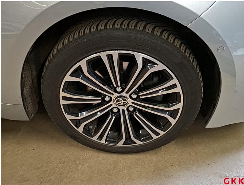
Bild 18 LM-Rad, vorne rechts, verkratzt, ersetzen