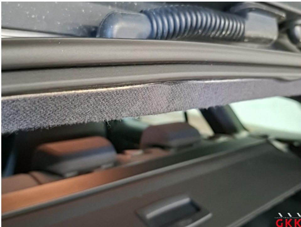
Bild 26 Himmel, hinten, Druckstellen, Smartrepair