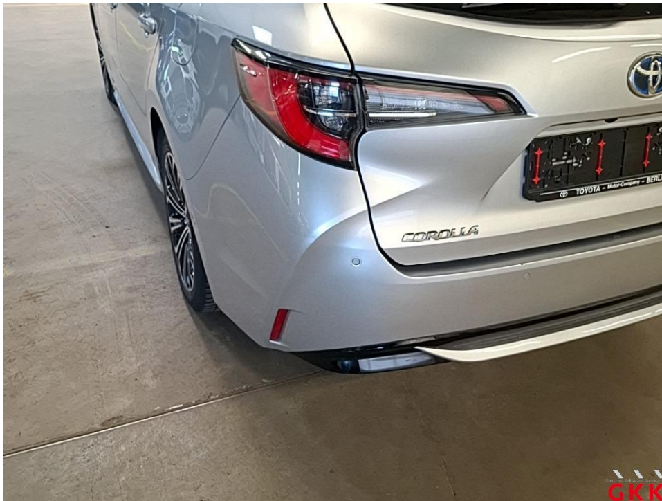
Bild 22 Stoßfänger hinten, Verkleidung -lackiert-, verkratzt, lackieren