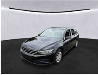
Fahrzeugansicht - diagonal vorne links