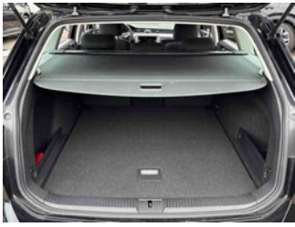
Innenraum - Kofferraum