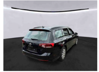
Fahrzeugansicht - diagonal hinten rechts