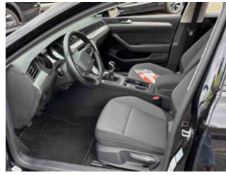
Innenraum - vorne