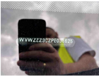
Fahrzeug - Typenschild/Fahrgestellnummer