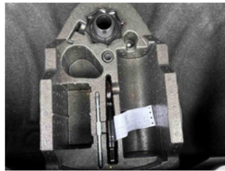
Equipment - Bordwerkzeug