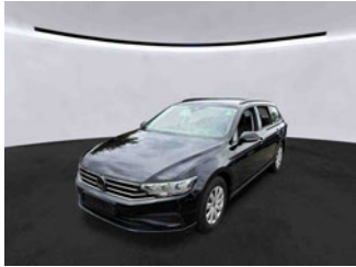
Fahrzeugansicht - diagonal vorne links

Auftrags-Nr: 1002414682 Besichtigt am: 06.05.2026 12:50 Berichts-Nr: 10557486 FIN: WVVZZZ3CZPE038625