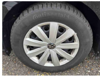
Räder - Rad montiert vorne links