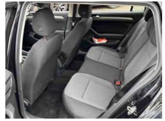
Innenraum - hinten