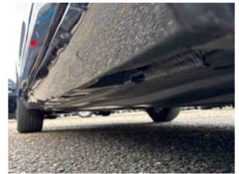
Seitenansicht - Schweller rechts