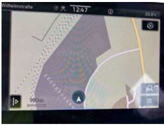
Innenraum - Navigationsgerät/Radio