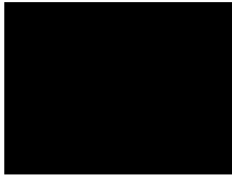
Fahrzeug - Serviceunterlagen / Wartungsnachweis