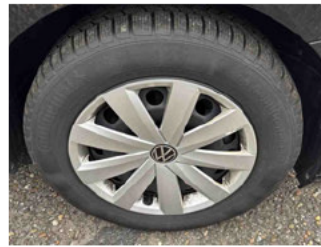
Räder - Rad montiert vorne rechts