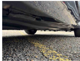
Seitenansicht - Schweller links