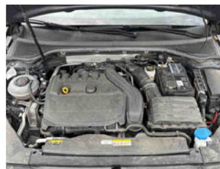
Fahrzeug - Motorraum offen