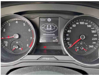
Innenraum - Cockpit mit Laufleistung