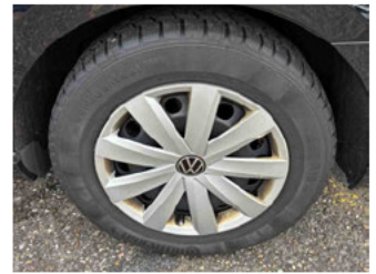
Räder - Rad montiert hinten links