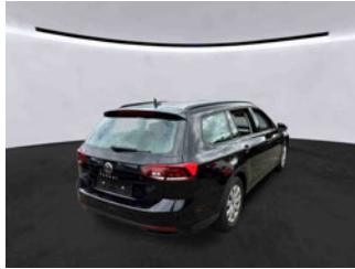
Fahrzeugansicht - diagonal hinten rechts