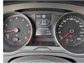
Innenraum - Cockpit mit Laufleistung