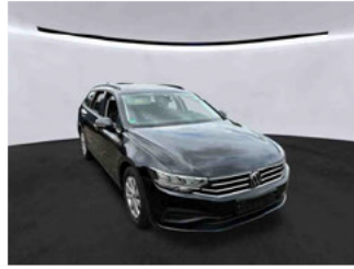
Fahrzeugansicht - diagonal vorne rechts