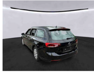
Fahrzeugansicht - diagonal hinten links