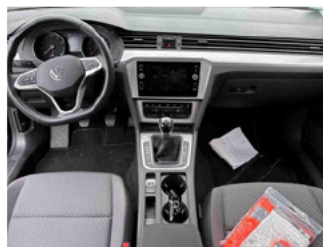
Innenraum - Mittelkonsole