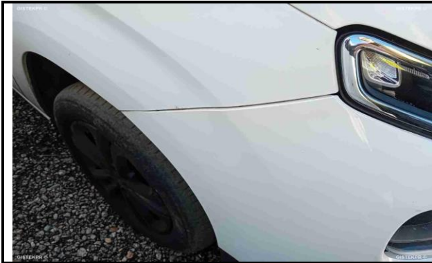
Foto daños externos 1

INFORME-STELL-RE-BUY- 1487- 2025__(VR7ECYHT2MJ674226- 5935LNZ).DOC