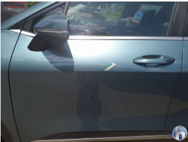
2. Tür Vorne - Links Gebrauchsspuren - Ohne Reparatur