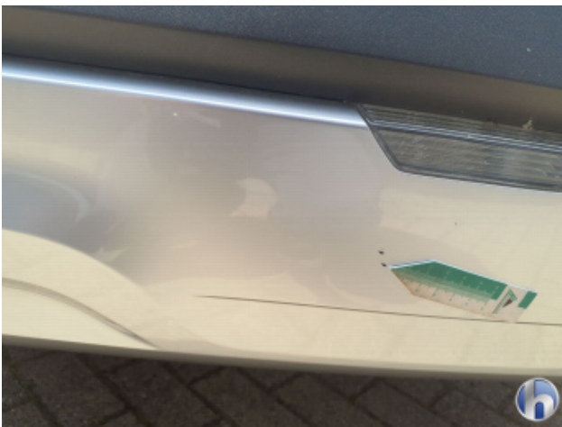
1. Stoßfänger Hinten Gebrauchsspuren - Ohne Reparatur