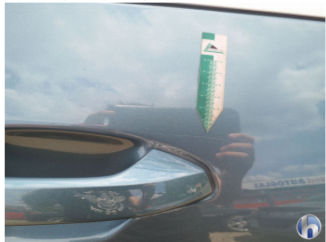
3. Tür Vorne - Rechts Oberflächenkratzer - Auslegen / Polieren