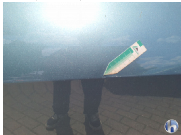
2. Tür Vorne - Links Gebrauchsspuren - Ohne Reparatur