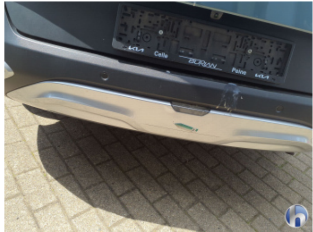
1. Stoßfänger Hinten Gebrauchsspuren - Ohne Reparatur