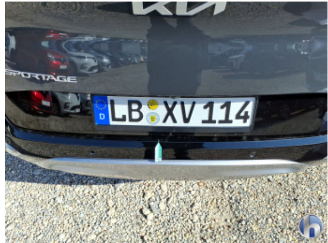
2. Stoßfänger Hinten Kratzer - Smart Repair