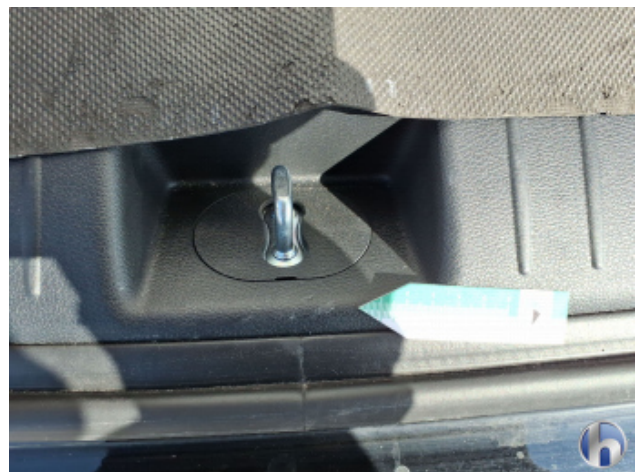
6. Verkleidung Kratzer - Erneuern