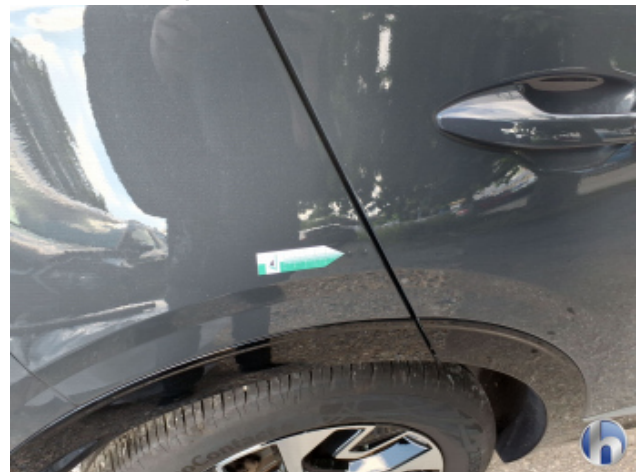
4. Seitenwand - Hinten - Rechts Verdellt - Smart Repair