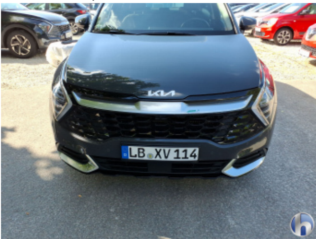
5. Stoßfänger Vorne Kratzer - Smart Repair