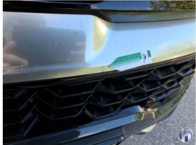
5. Stoßfänger Vorne Kratzer - Smart Repair