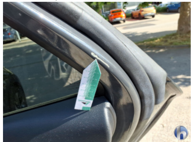
3. Tür Hinten - Rechts Kratzer - Smart Repair