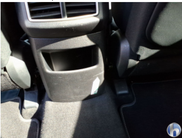
6. Verkleidung Kratzer - Erneuern