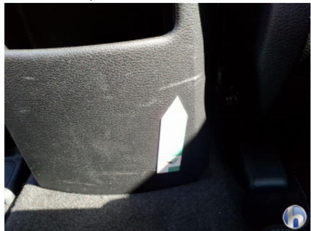
6. Verkleidung Kratzer - Erneuern