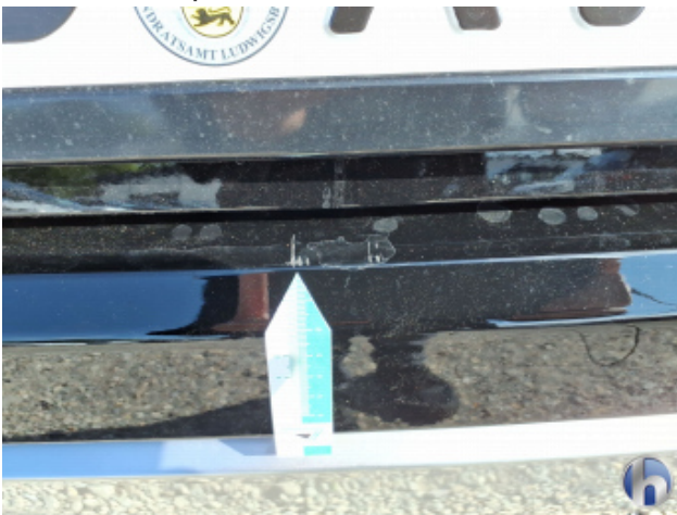
2. Stoßfänger Hinten Kratzer - Smart Repair