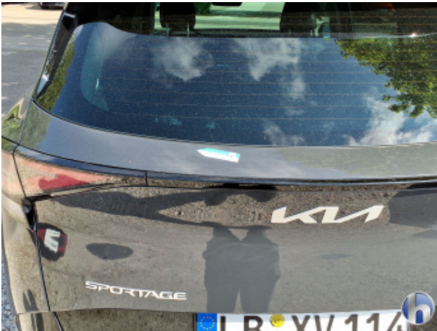
1. Heckdeckel Kratzer - Smart Repair