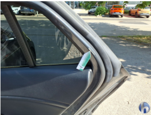
3. Tür Hinten - Rechts Kratzer - Smart Repair