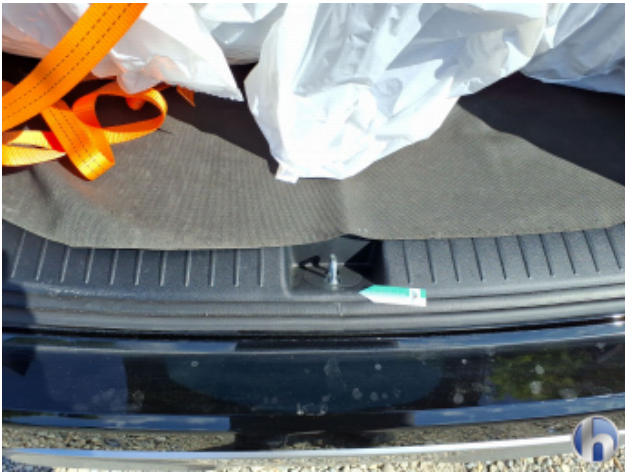
6. Verkleidung Kratzer - Erneuern