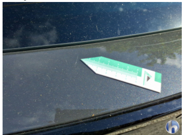
1. Heckdeckel Kratzer - Smart Repair