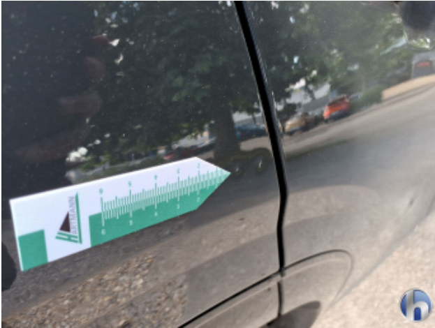
4. Seitenwand - Hinten - Rechts Verdellt - Smart Repair