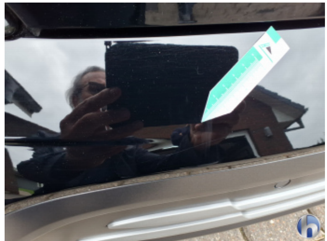
1. Stoßfänger Hinten Kratzer - Smart Repair