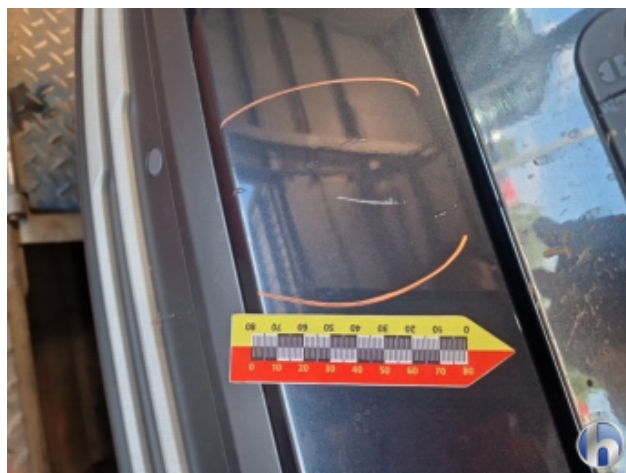
2. Stoßfänger Hinten Kratzer - Smart Repair