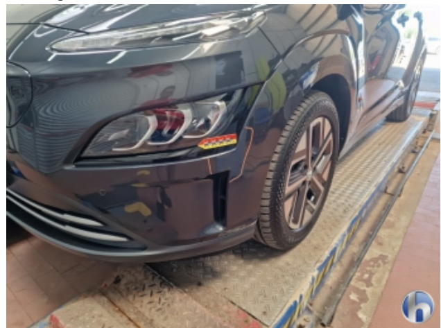
1. Stoßfänger Vorne Kratzer - Smart Repair