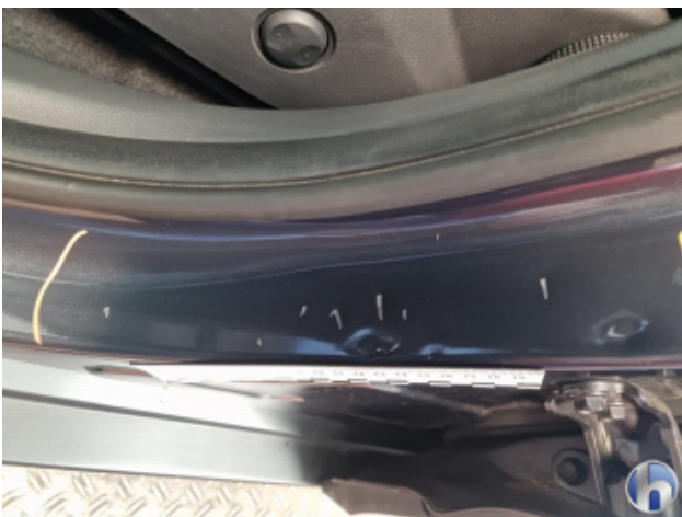
5. Türeinstieg Hinten - Links Kratzer - Instandsetzen und Lackieren