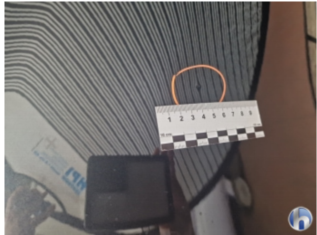
4. Tür Hinten - Rechts Delle - Sanft Instandsetzen