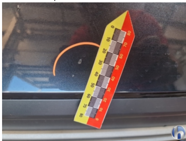
2. Stoßfänger Hinten Kratzer - Smart Repair