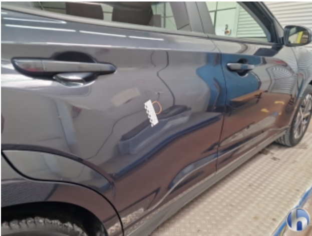
4. Tür Hinten - Rechts Delle - Sanft Instandsetzen