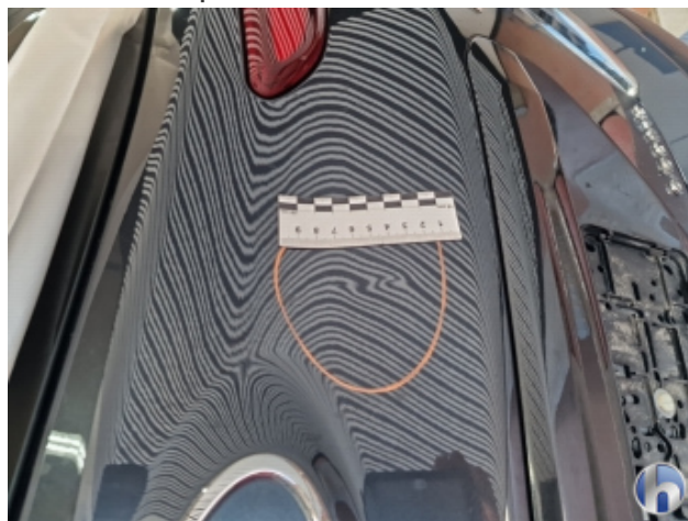
3. Heckklappe Delle - Sanft Instandsetzen