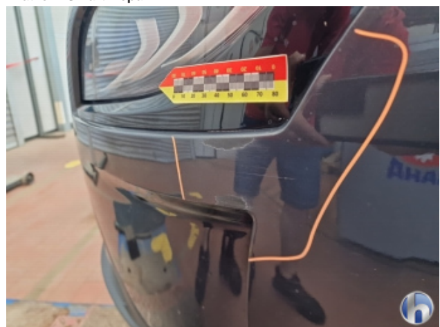
1. Stoßfänger Vorne Kratzer - Smart Repair