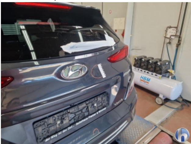
3. Heckklappe Delle - Sanft Instandsetzen