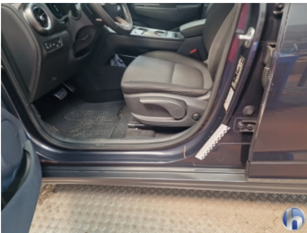
5. Türeinstieg Hinten - Links Kratzer - Instandsetzen und Lackieren