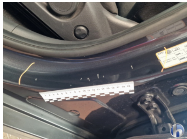
5. Türeinstieg Hinten - Links Kratzer - Instandsetzen und Lackieren