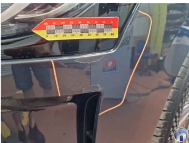
1. Stoßfänger Vorne Kratzer - Smart Repair