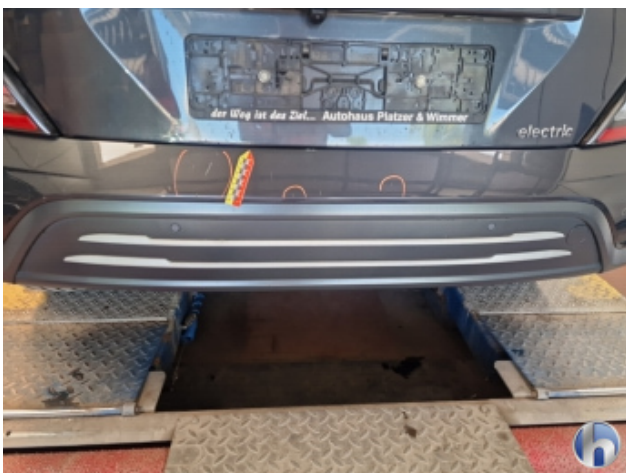
2. Stoßfänger Hinten Kratzer - Smart Repair