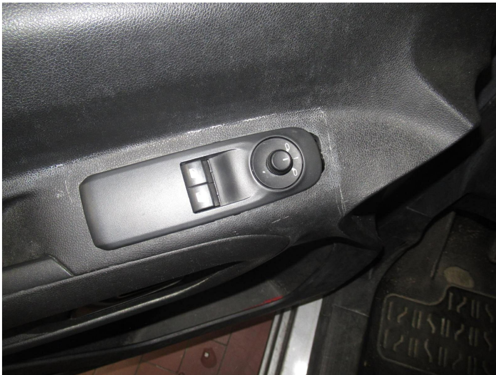
Bild 8 : Innenraum Tüverkleidung vorne links / Schaltereinheit lose