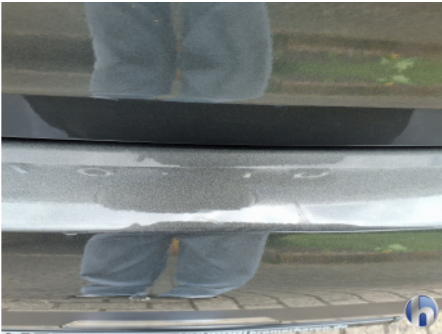
1. Stoßfänger Hinten Kratzer - Smart Repair