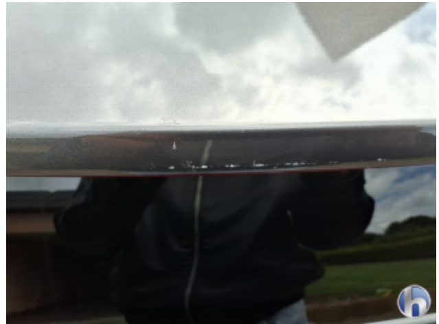
2. Dachrahmen - Rechts Kratzer - Smart Repair