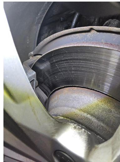
Bild 10: Technik, Bremse hinten - Bremsscheiben und Bremsbeläge , nahe Verschleißgrenze , erneuern