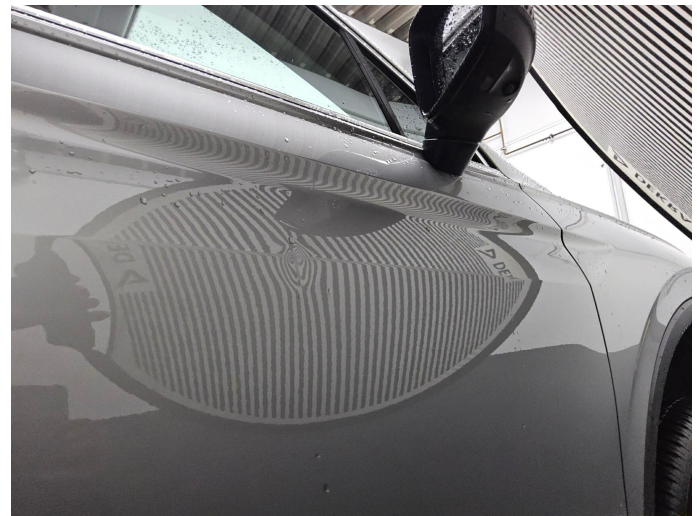
Bild 14: Außen, Tür vorne rechts, deformiert, instandsetzen und lackieren mit Lackaufbau