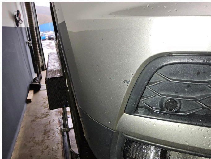
Bild 15: Außen, Stoßfänger vorne - Lackierung, zerkratzt, smartrepair

Für den Fachbereich Ramazan Ertugrul Öztürk