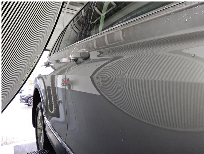
Bild 13: Außen, Tür vorne rechts, deformiert, instandsetzen und lackieren mit Lackaufbau