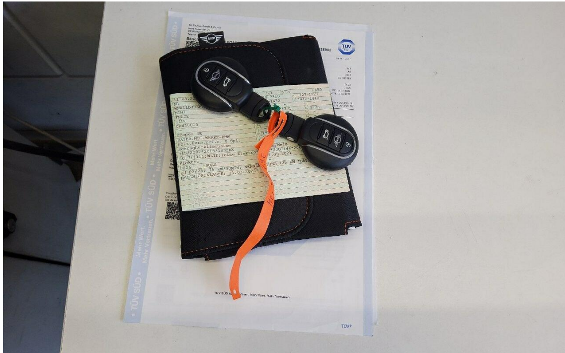
Bild 11 : Serviceheft letzter Eintrag, alle Fahrzeugschlüssel, Bordmappe