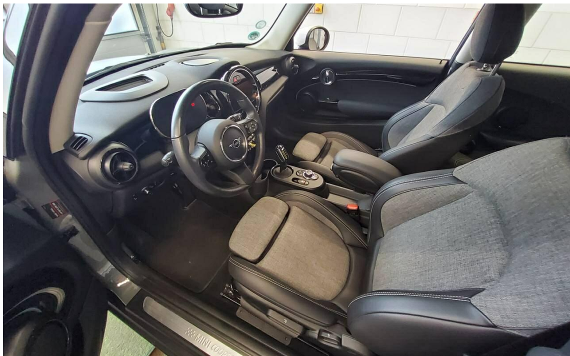
Bild 8 : Durch geöffnete Fahrtüre: Fahrersitz, Armaturenbrett und Schalthebel