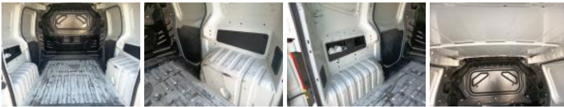
Interior Sucio Limpiar

Ubicación Interior Type Dañado Tipo de reparación Control