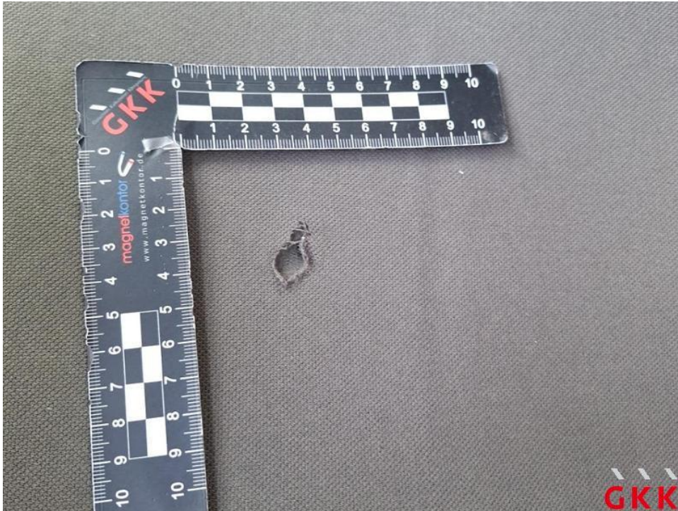
Bild 41. Sitz vorne links, Schonbezug, gerissen, ersetzen