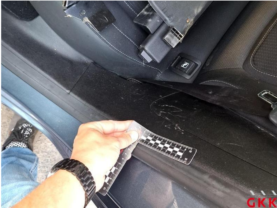
Bild 37. C- Säule links, Innenverkleidung -unterhalb-, verkratzt, ersetzen