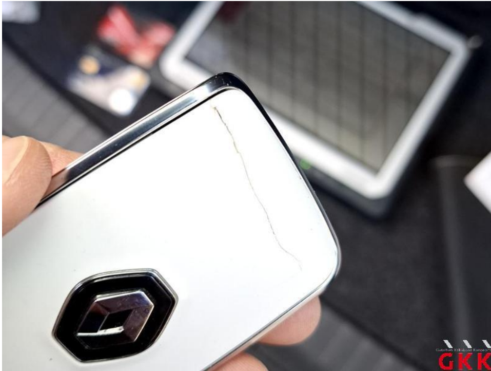
Bild 13. Hauptschlüssel, mit Fernbedienung, beschädigt, ersetzen