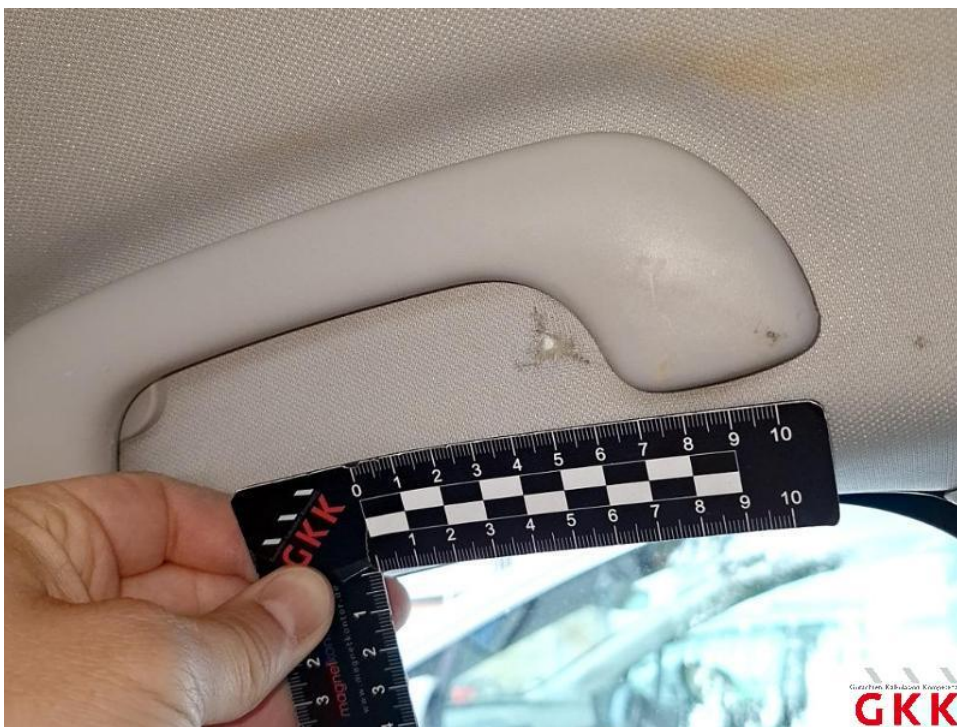
Bild 22. Himmel, beschädigt, ersetzen