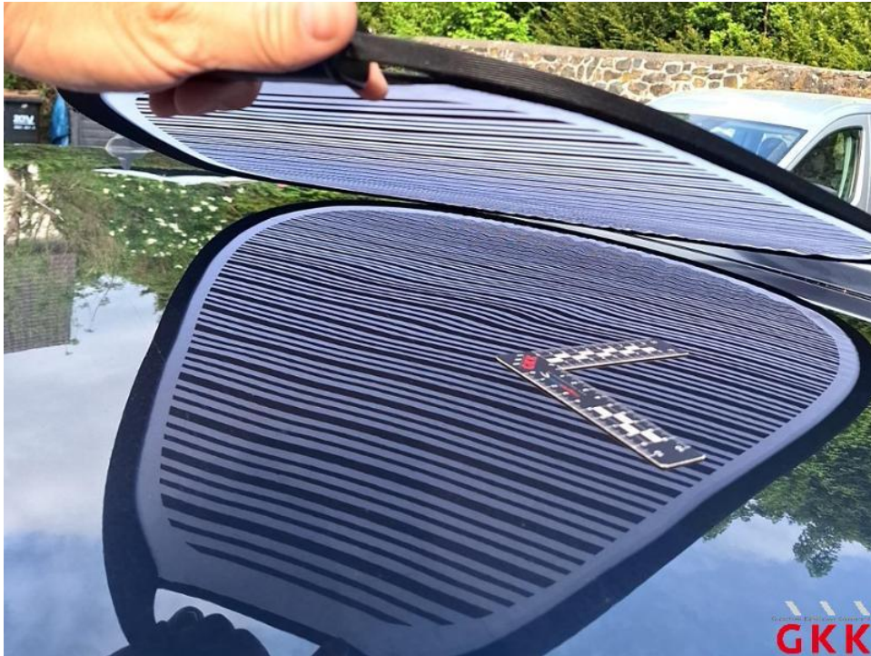
Bild 47. Dach, beschädigt, instand setzen - lackieren