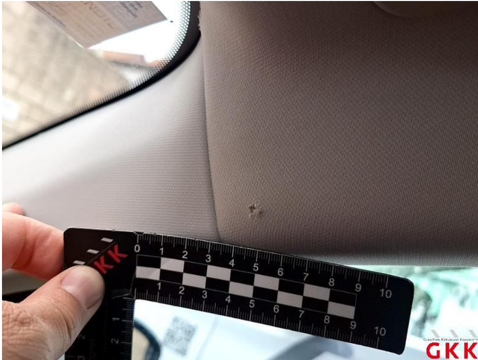
Bild 23. Himmel, beschädigt, ersetzen