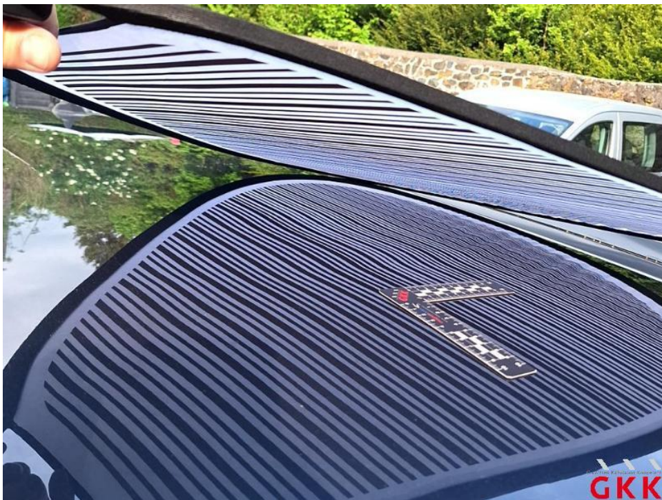
Bild 46. Dach, beschädigt, instand setzen - lackieren