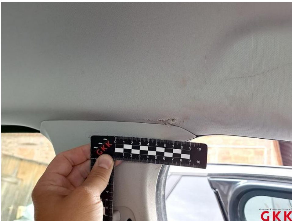
Bild 21. Himmel, beschädigt, ersetzen