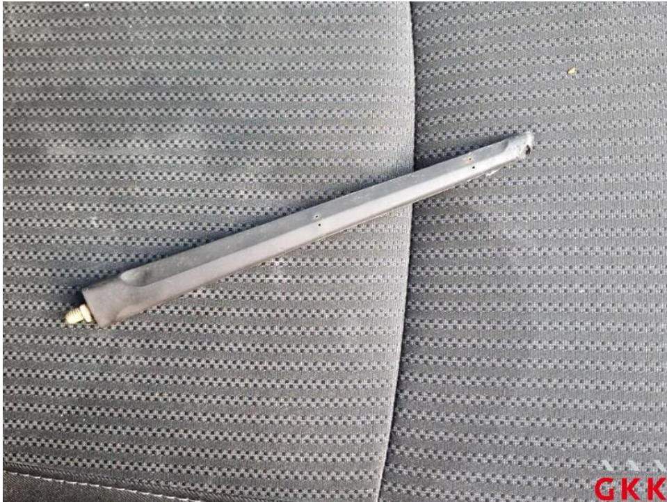
Bild 19. Antenne, Stab, beschädigt, ersetzen