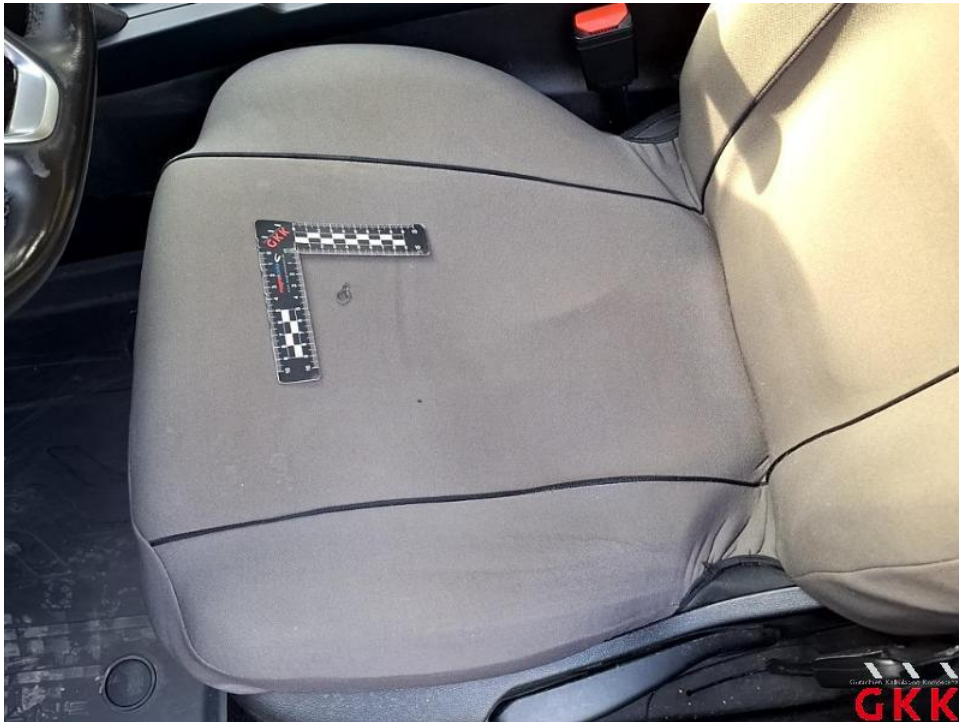
Bild 40. Sitz vorne links, Schonbezug, gerissen, ersetzen