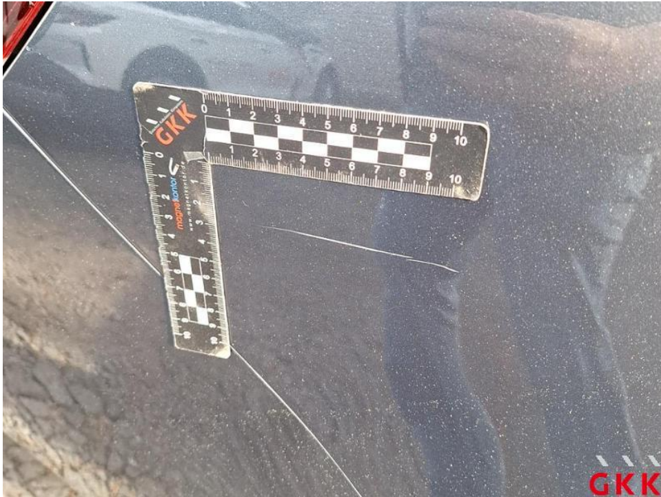
Bild 25. Seitenwand rechts, verkratzt, lackieren