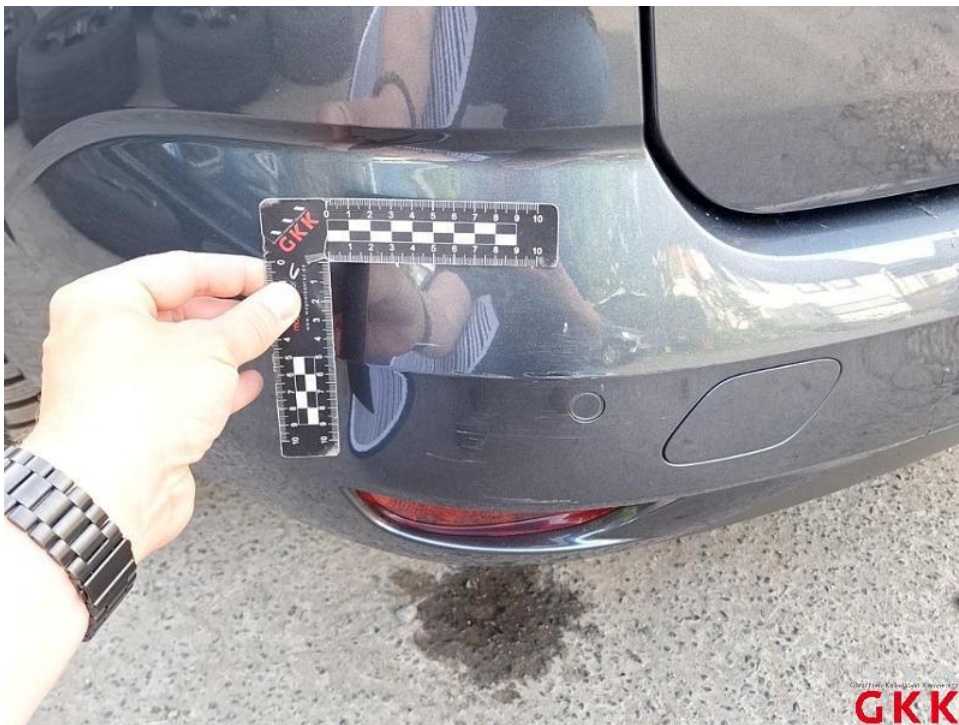
Bild 26. Stoßfänger hinten, Verkleidung -lackiert-, verkratzt, lackieren