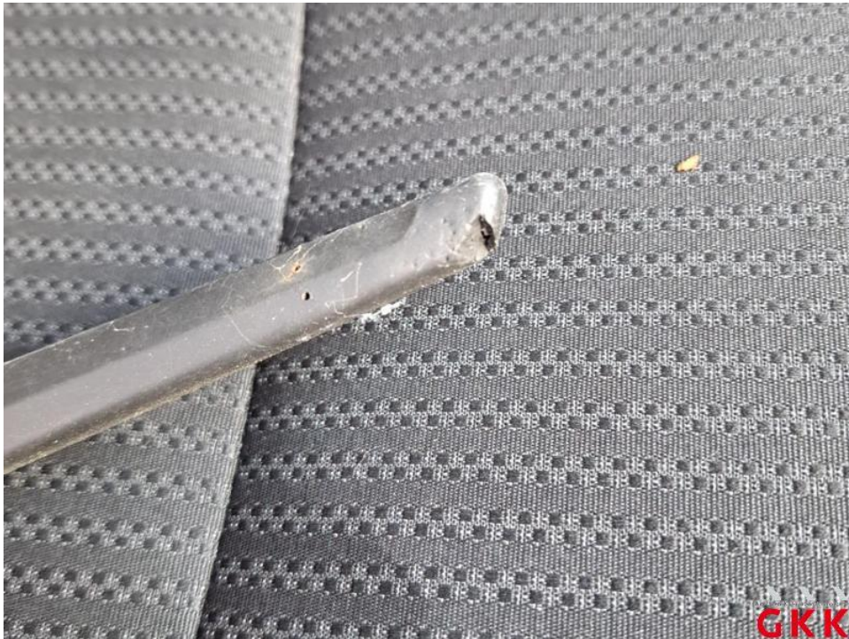
Bild 20. Antenne, Stab, beschädigt, ersetzen