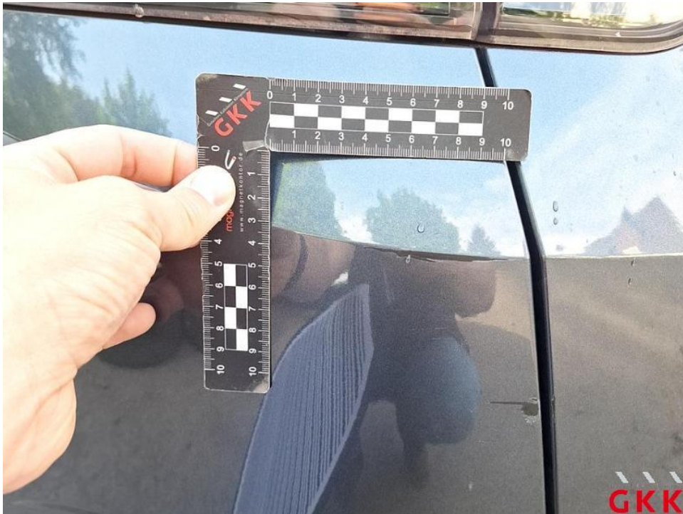
Bild 28. Stoßfänger hinten, Verkleidung -lackiert-, verkratzt, lackieren