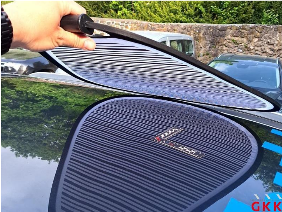
Bild 45. Dach, beschädigt, instand setzen - lackieren