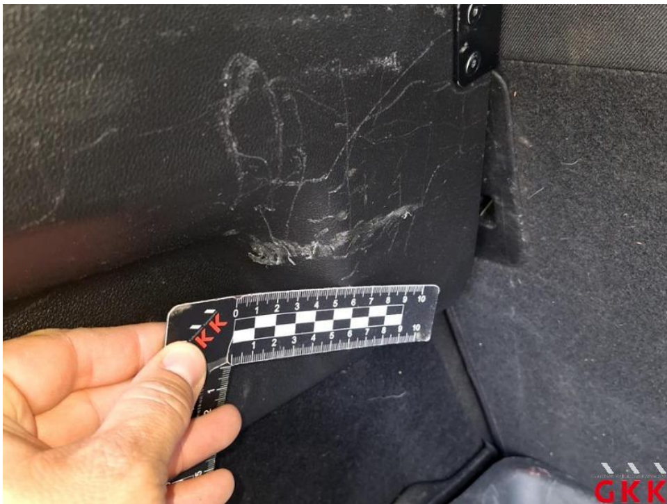
Bild 30. Laderaum Innenverkleidungen rechts/links oberhalb, verkratzt, ersetzen