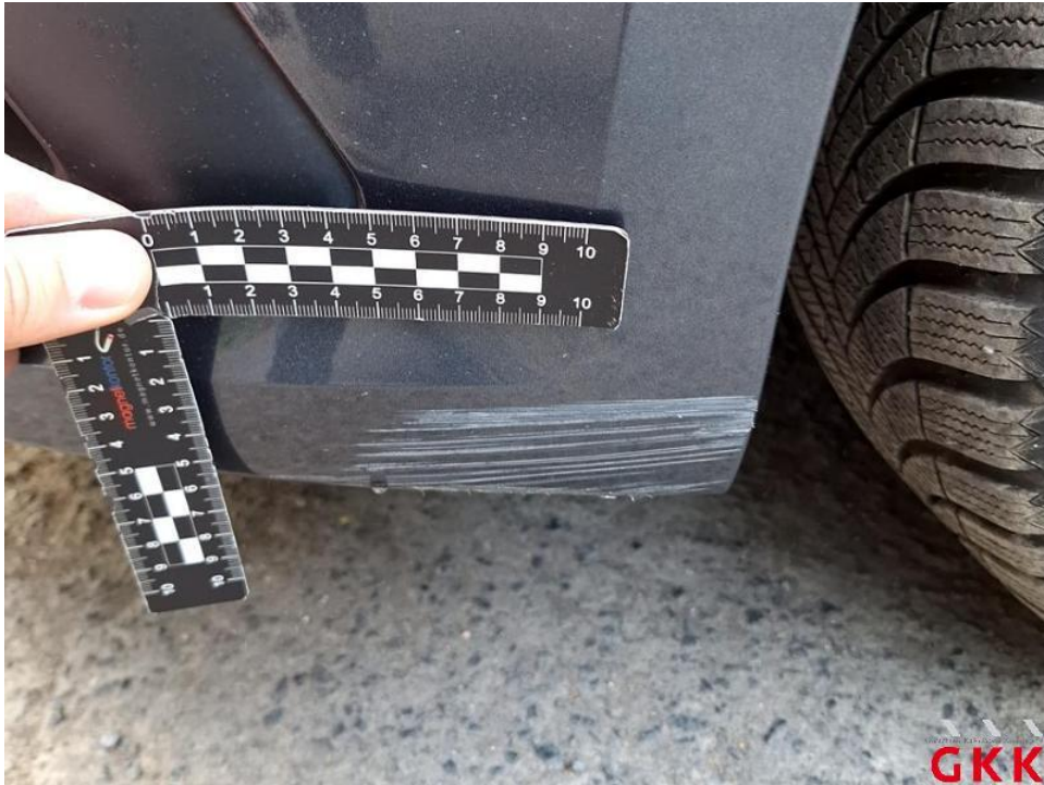
Bild 15. Stoßfänger vorne, Verkleidung -lackiert-, verkratzt, lackieren