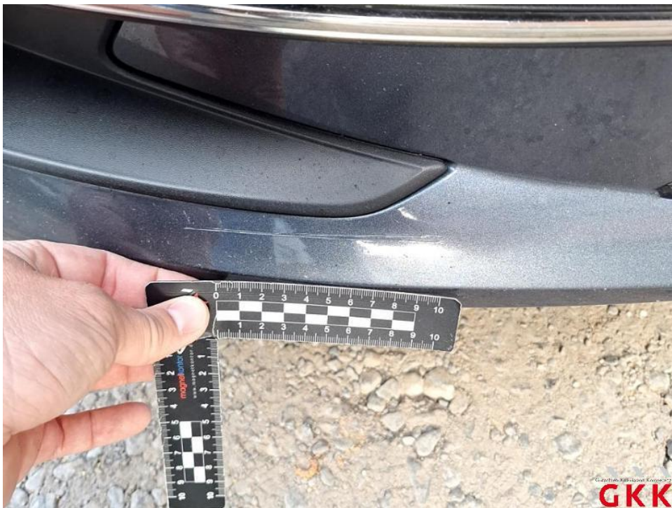
Bild 16. Stoßfänger vorne, Verkleidung -lackiert-, verkratzt, lackieren