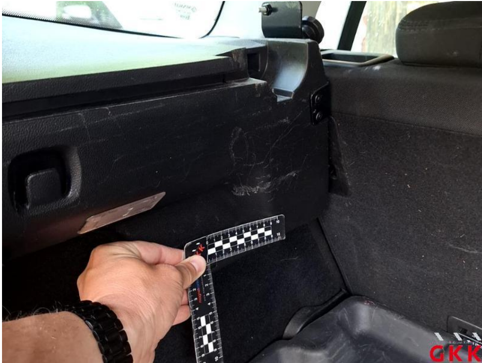
Bild 29. Laderaum Innenverkleidungen rechts/links oberhalb, verkratzt, ersetzen