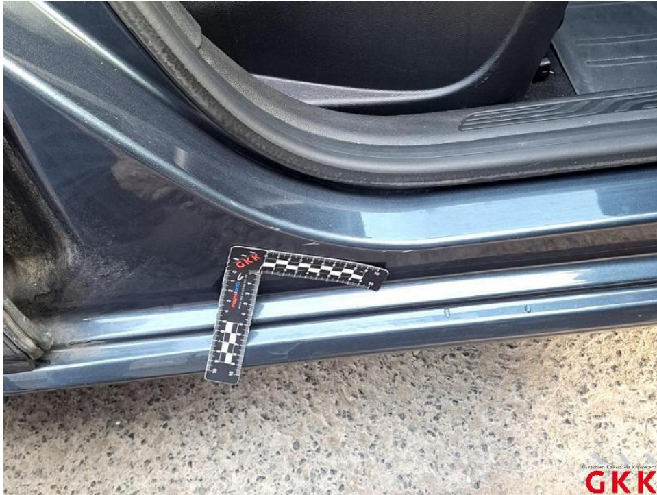
Bild 17. Tür vorne rechts, Einstieg, verkratzt, Smartrepair