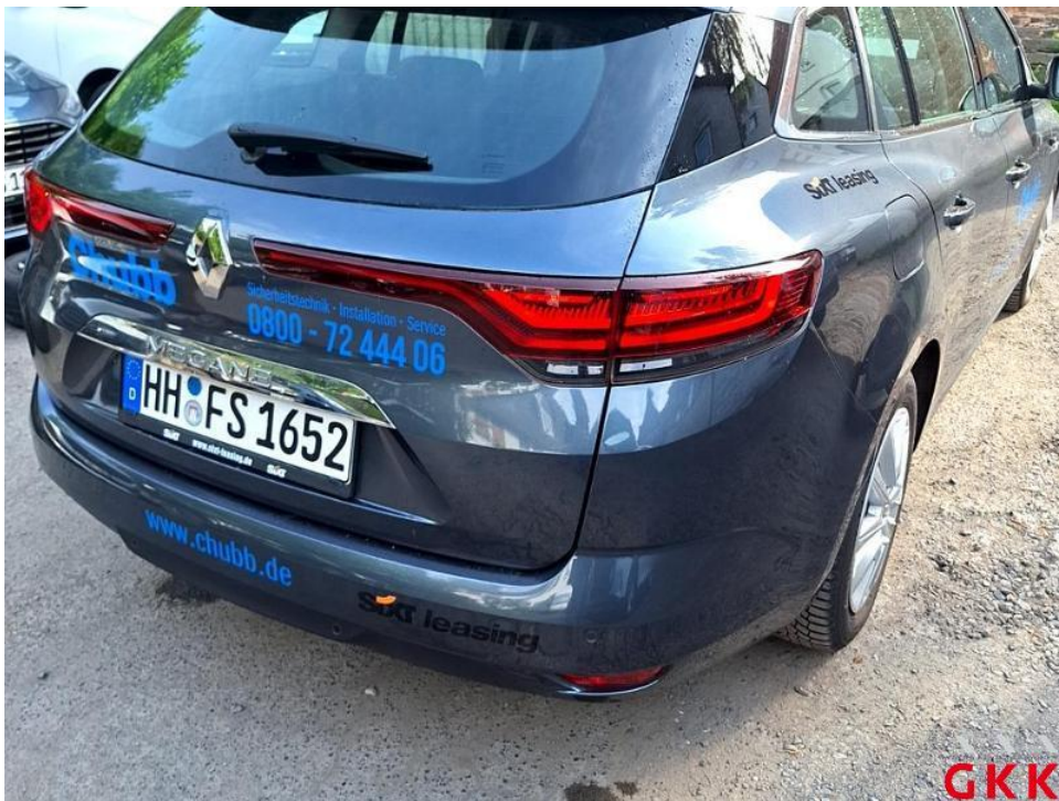
Bild 44. Beschriftungs- / Werbefolie, beklebt, entkleben