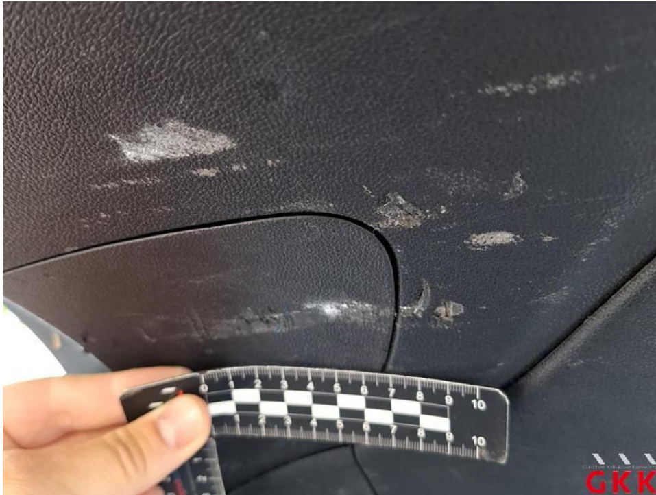
Bild 35. Heckklappe, Innenverkleidung, verkratzt, ersetzen