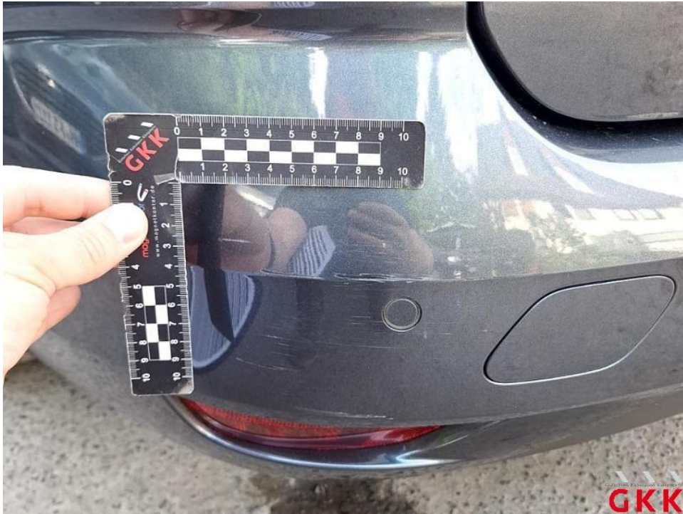
Bild 27. Stoßfänger hinten, Verkleidung -lackiert-, verkratzt, lackieren