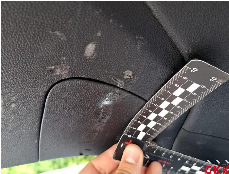
Bild 36. Heckklappe, Innenverkleidung, verkratzt, ersetzen