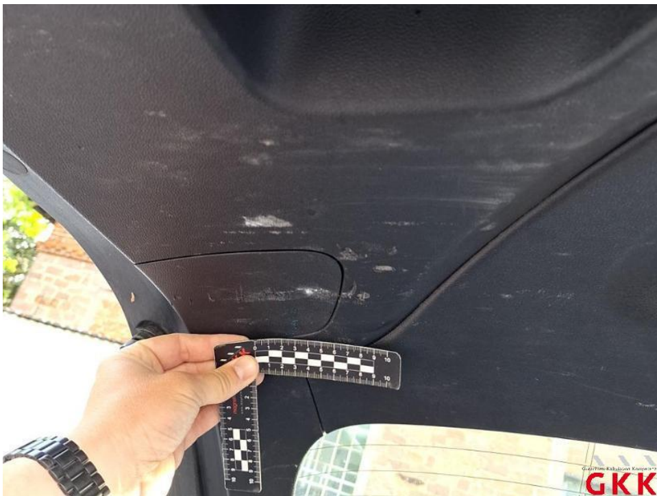
Bild 34. Heckklappe, Innenverkleidung, verkratzt, ersetzen