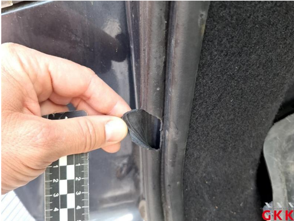
Bild 33. Laderaum, Dichtung, gerissen, ersetzen