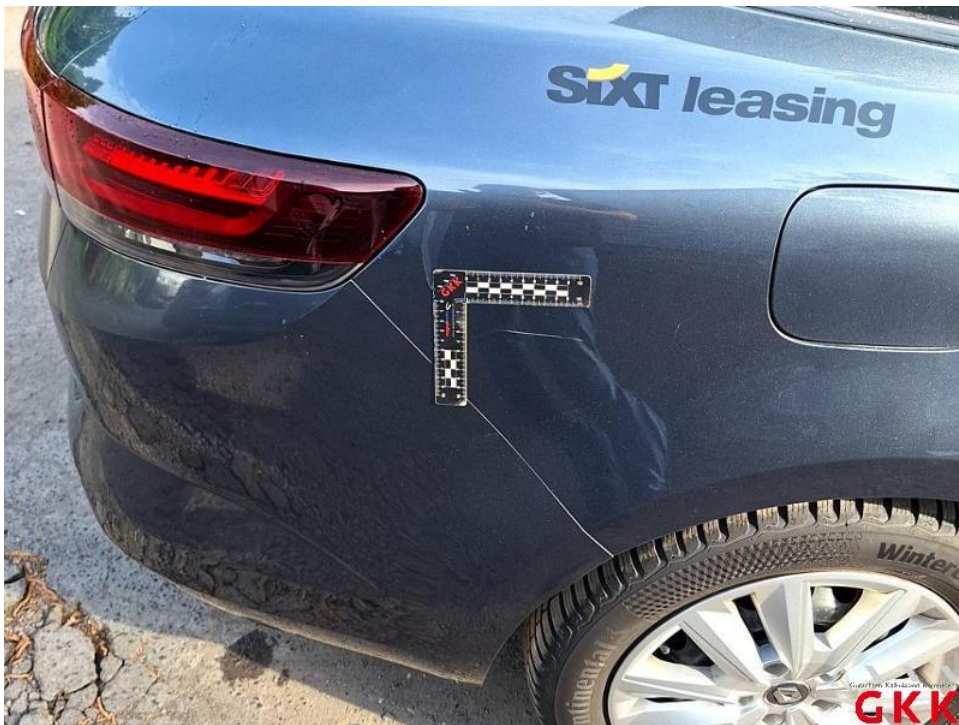
Bild 24. Seitenwand rechts, verkratzt, lackieren