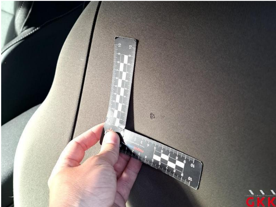
Bild 42. Sitz vorne links, Schonbezug, gerissen, ersetzen