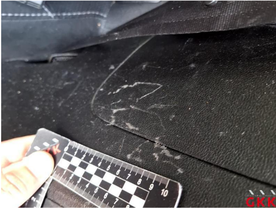
Bild 39. C- Säule links, Innenverkleidung -unterhalb-, verkratzt, ersetzen