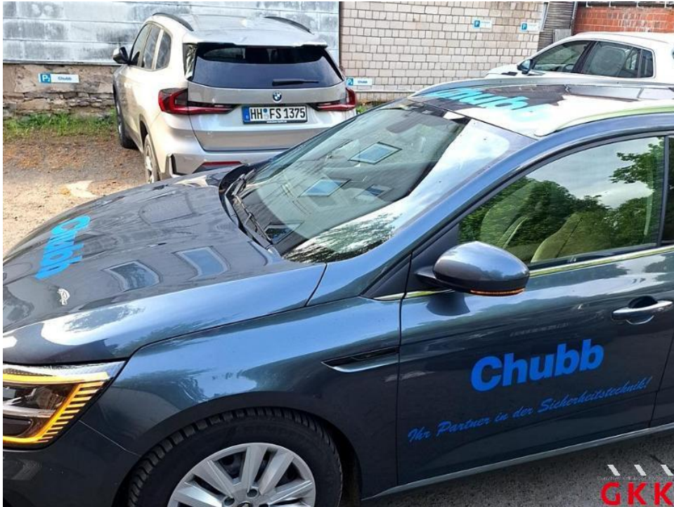
Bild 43. Beschriftungs- / Werbefolie, beklebt, entkleben