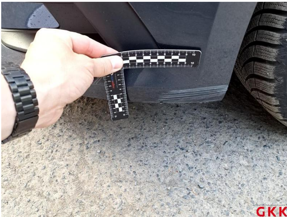
Bild 14. Stoßfänger vorne, Verkleidung -lackiert-, verkratzt, lackieren