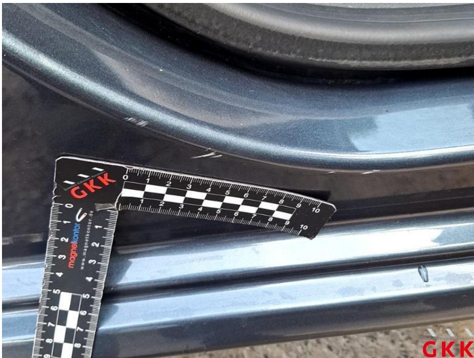
Bild 18. Tür vorne rechts, Einstieg, verkratzt, Smartrepair