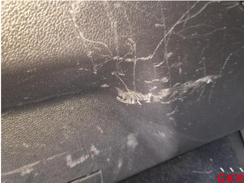
Bild 31. Laderaum Innenverkleidungen rechts/links oberhalb, verkratzt, ersetzen