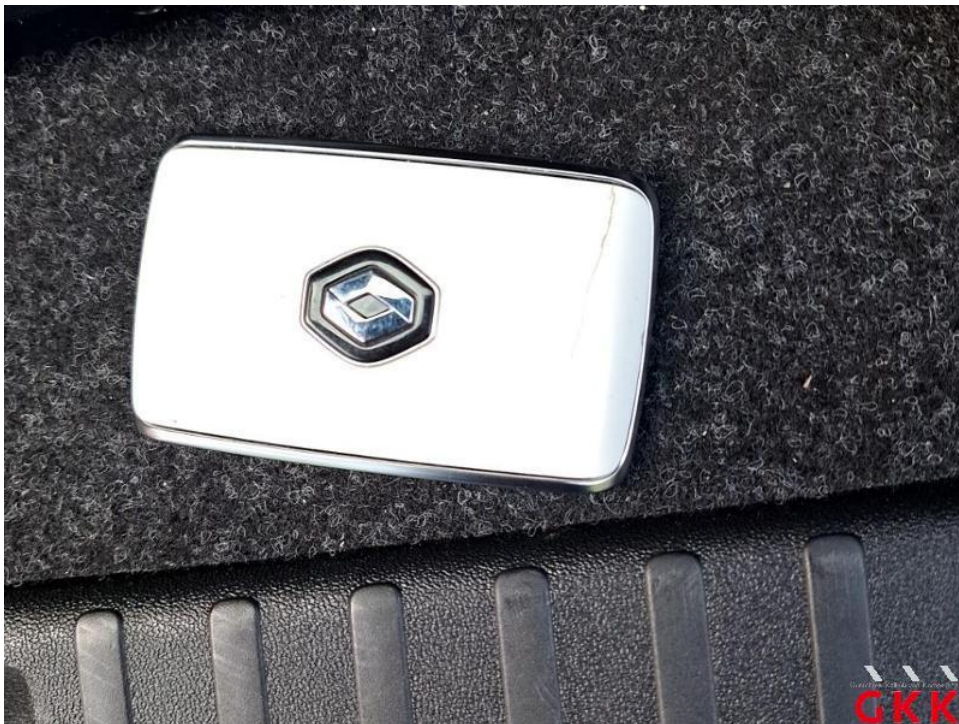
Bild 12. Hauptschlüssel, mit Fernbedienung, beschädigt, ersetzen