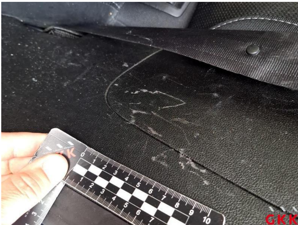
Bild 38. C- Säule links, Innenverkleidung -unterhalb-, verkratzt, ersetzen