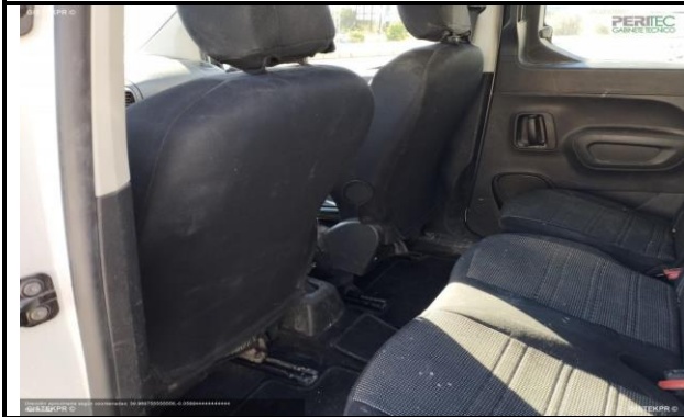
FESD IMG 20251127_111618