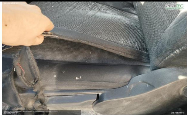
FASDEL IMG 20251127_111648