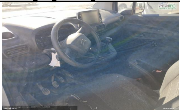
FESD IMG 20251127_111705