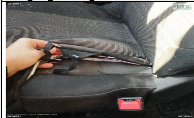
FESD IMG 20251127_111657