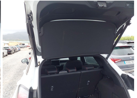
Elementos faltantes / Cubierta de carga