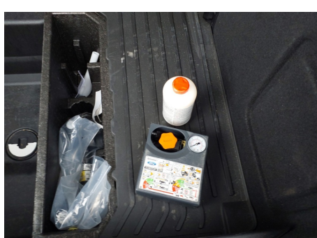
Elementos faltantes / Kit de reparación de neumáticos de recarga