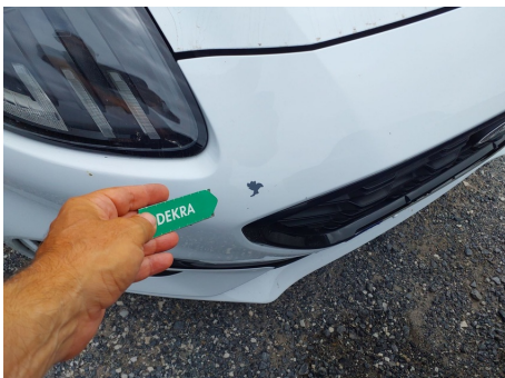
Paragolpes / Delantero / Rayado