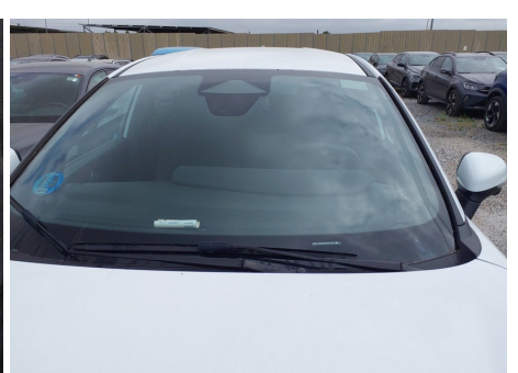
Parabrisas / - / Rayado