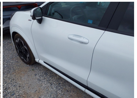
Puerta / Delantero izquierdo / Rayado