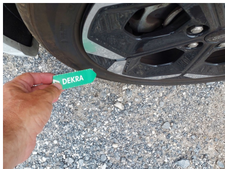
Llanta / Delantero izquierdo / Rayado