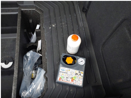
Elementos faltantes / Kit de reparación de neumáticos compresor