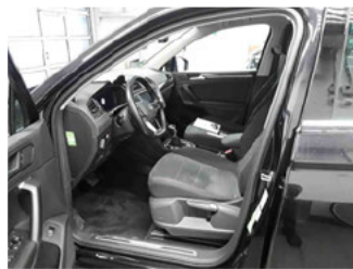
Innenraum - vorne