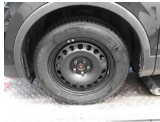
Räder - Rad montiert vorne links