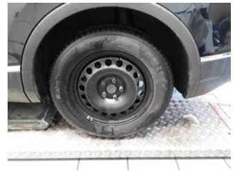
Räder - Rad montiert hinten links