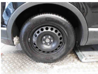
Räder - Rad montiert hinten rechts