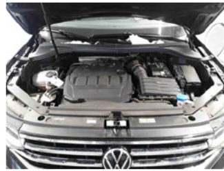
Fahrzeug - Motorraum offen