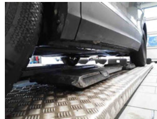
Seitenansicht - Schweller links