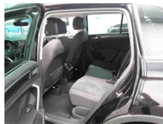
Innenraum - hinten