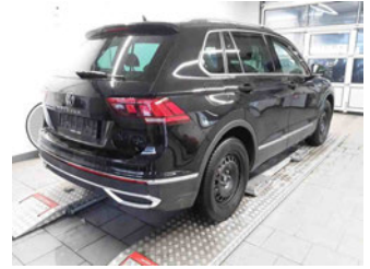
Fahrzeugansicht - diagonal hinten rechts