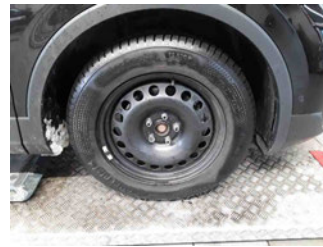
Räder - Rad montiert vorne rechts