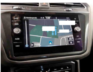
Innenraum - Navigationsgerät/Radio