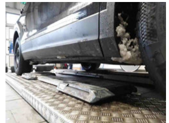
Seitenansicht - Schweller rechts