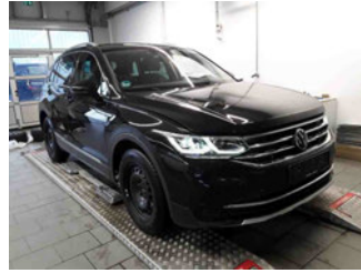
Fahrzeugansicht - diagonal vorne rechts