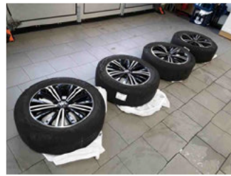
Räder - eingelegt im Fahrzeug