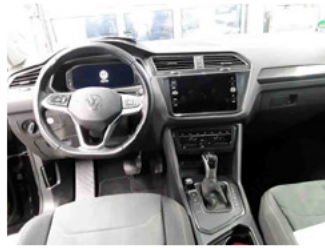
Innenraum - Mittelkonsole