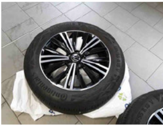
Räder - Rad beiliegend #4