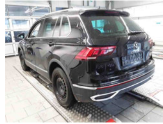
Fahrzeugansicht - diagonal hinten links