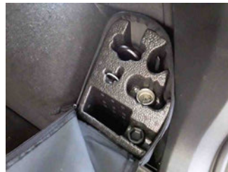
Equipment - Bordwerkzeug