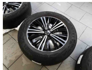
Räder - Rad beiliegend #2