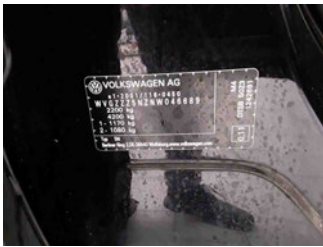
Fahrzeug - Typenschild/Fahrgestellnummer