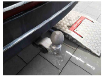
Equipment - Anhängerkupplung