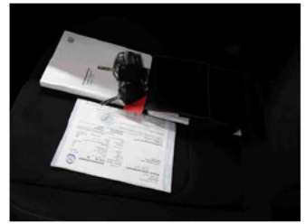
Equipment - Boardmappe/ Securitybag