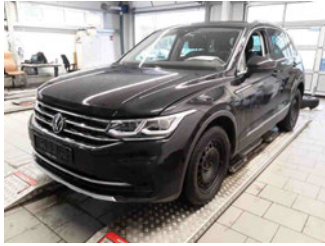
Fahrzeugansicht - diagonal vorne links

Auftrags-Nr: 1002292495 Besichtigt am: 27.01.2026 15:50 Berichts-Nr: 9925492 FIN: WVGZZZ5NZNW046689