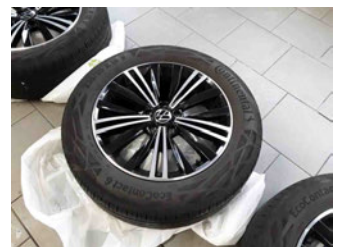
Räder - Rad beiliegend #3