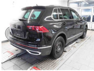
Fahrzeugansicht - diagonal hinten rechts