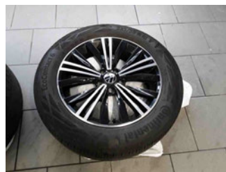
Räder - Rad beiliegend #1