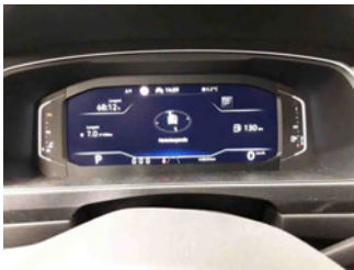
Innenraum - Cockpit mit Laufleistung