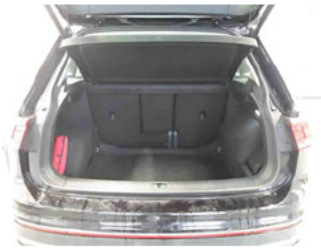
Innenraum - Kofferraum