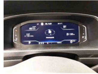
Innenraum - Cockpit mit Laufleistung