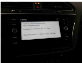
Fahrzeug - Serviceunterlagen / Wartungsnachweis