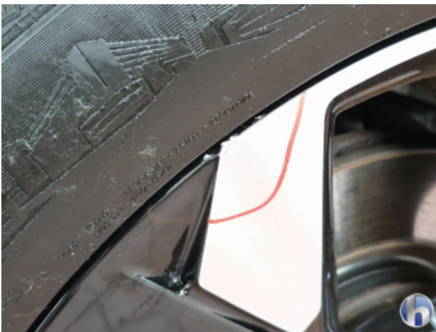
1. Felge Vorne - Links Beschädigt - Smart Repair