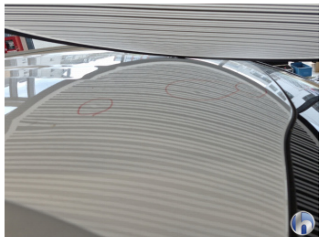
4. Dach 3 Dellen - Sanft Instandsetzen