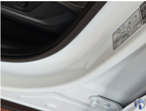
2. Türeinstieg Vorne - Links Beschädigt - Smart Repair