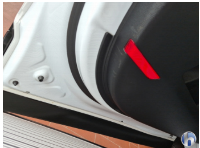
3. Tür Vorne - Links Dellen / Beulen - Sanft Instandsetzen