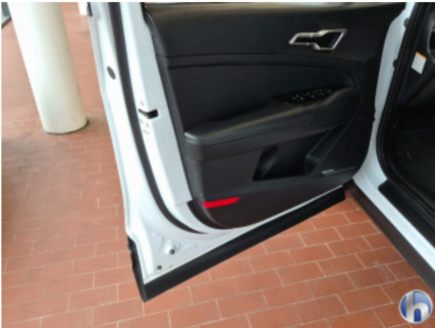
3. Tür Vorne - Links Dellen / Beulen - Sanft Instandsetzen