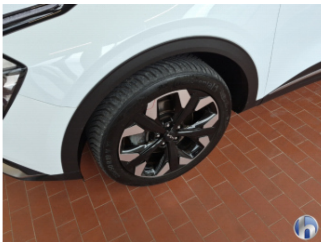
6. Reifen Vorne - Links Funktional / Zulässigkeit - Erneuern