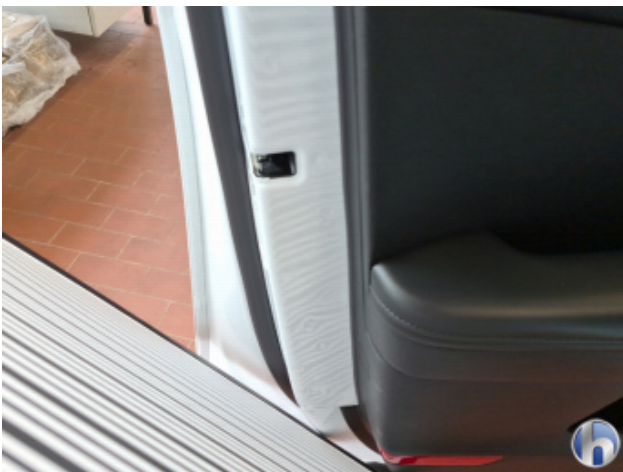
3. Tür Vorne - Links Dellen / Beulen - Sanft Instandsetzen