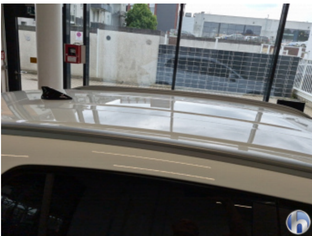
4. Dach 3 Dellen - Sanft Instandsetzen