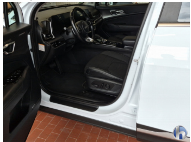
2. Türeinstieg Vorne - Links Beschädigt - Smart Repair