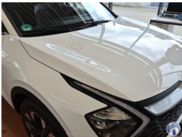
5. Motorhaube 1 Delle - Sanft Instandsetzen