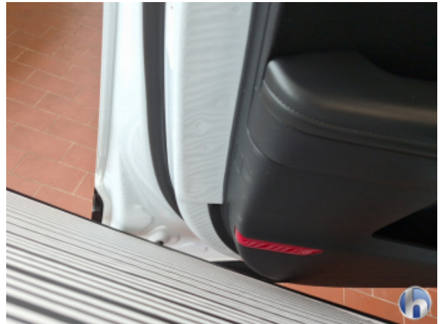
3. Tür Vorne - Links Dellen / Beulen - Sanft Instandsetzen