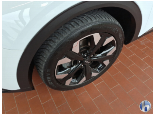
1. Felge Vorne - Links Beschädigt - Smart Repair