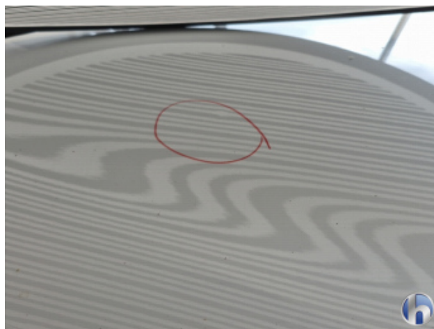
5. Motorhaube 1 Delle - Sanft Instandsetzen