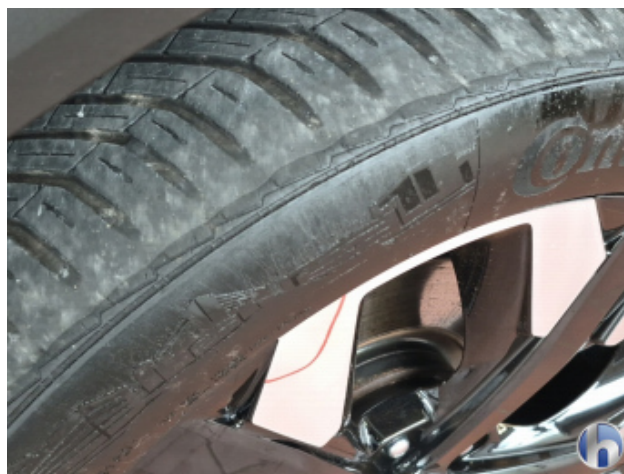
6. Reifen Vorne - Links Funktional / Zulässigkeit - Erneuern