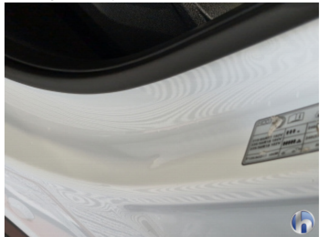
2. Türeinstieg Vorne - Links Beschädigt - Smart Repair