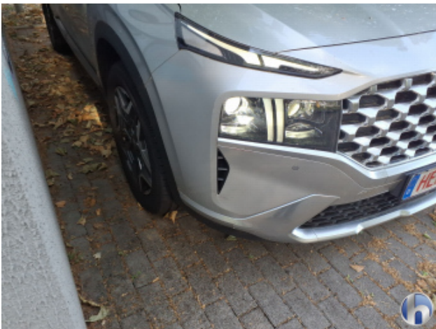
1. Stoßfänger Vorne Riss - Erneuern