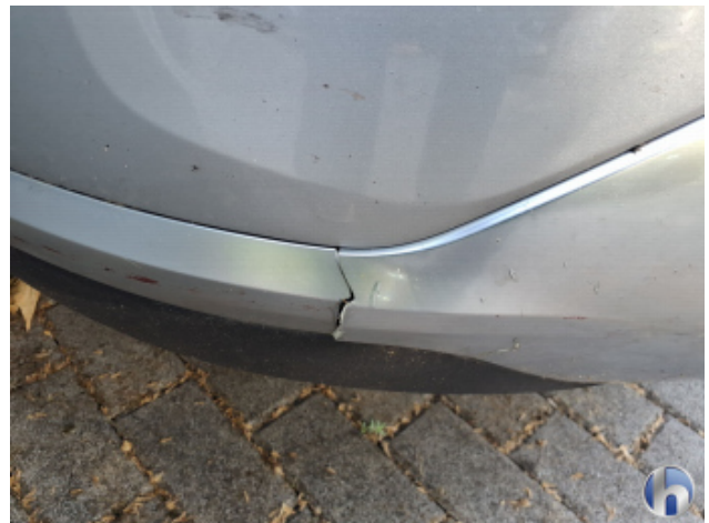
1. Stoßfänger Vorne Riss - Erneuern