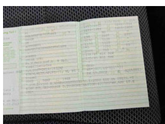
Fahrzeug - abgegebene ZB1