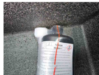
Räder - Haltbarkeitsdatum Tirefit