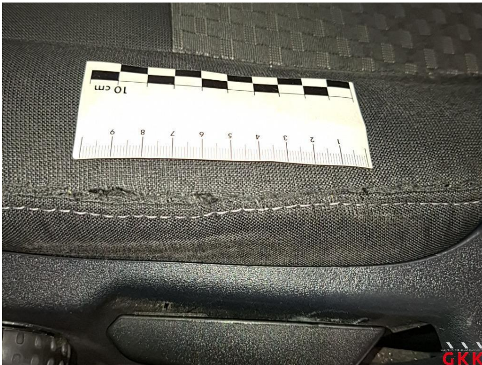
Bild 24 Sitz vorne links, Bezug Sitzkissen -Stoff-, beschädigt, ersetzen