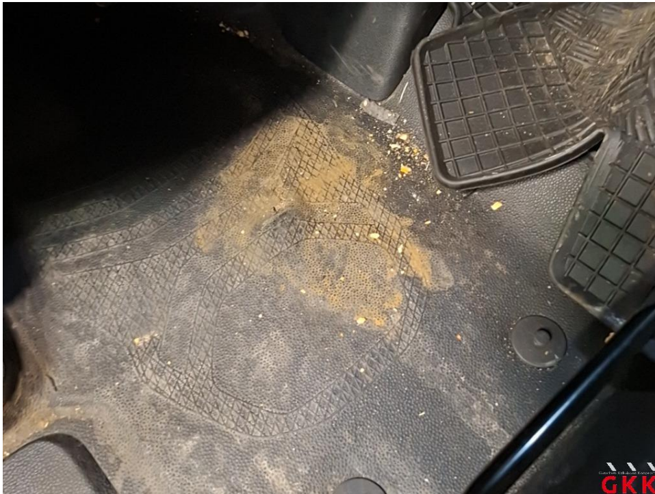
Bild 27 Fahrzeug, innen, verkratzt und verschmutzt, aufbereiten