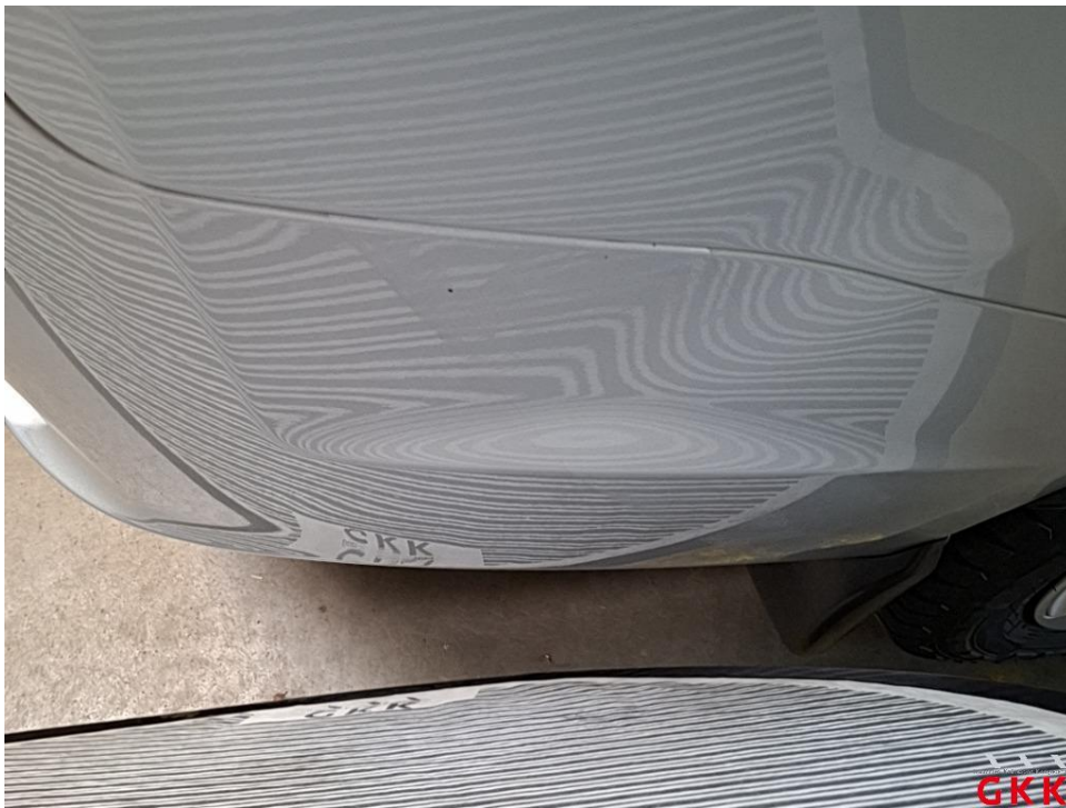
Bild 16 Fahrzeug, außen, Lackierung verwittert / matt, aufbereiten