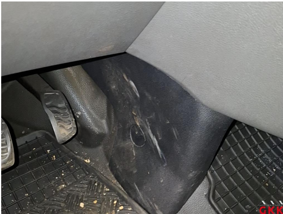
Bild 26 Fahrzeug, innen, verkratzt und verschmutzt, aufbereiten