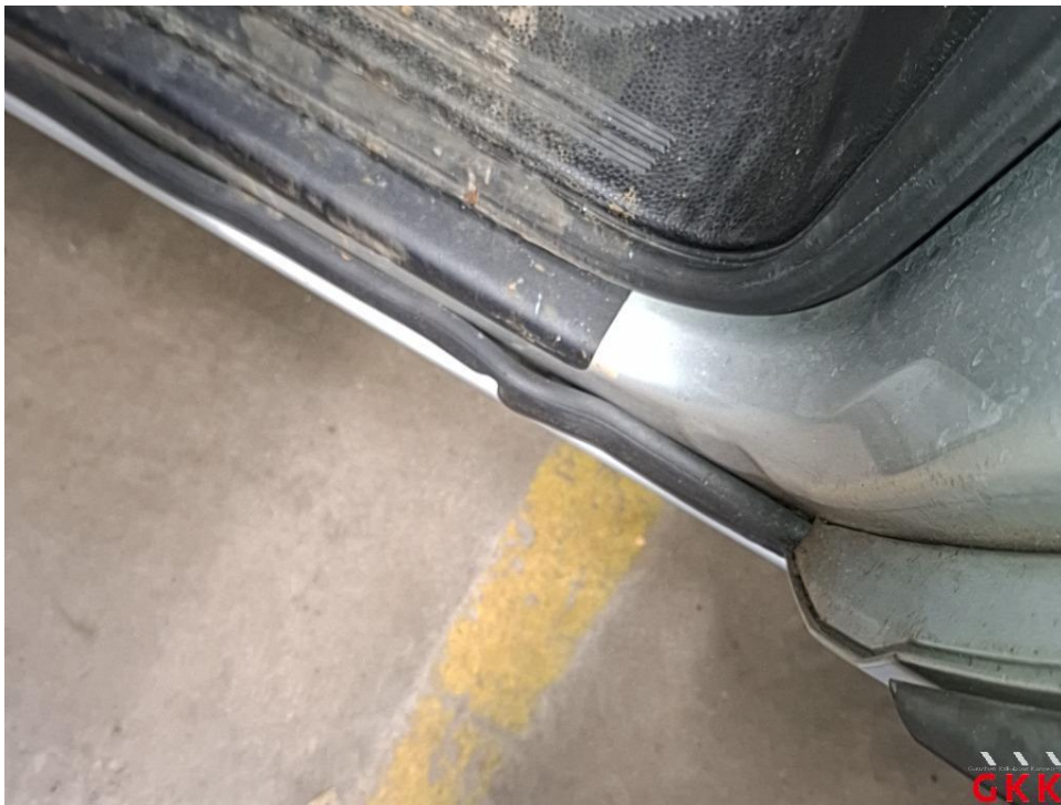
Bild 22 Tür vorne links, Dichtung -Einstieg-, beschädigt, ersetzen