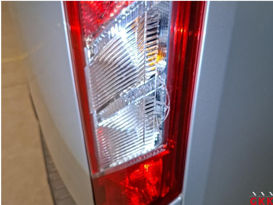
Bild 17 Rückleuchte rechts, außen, zerbrochen, ersetzen