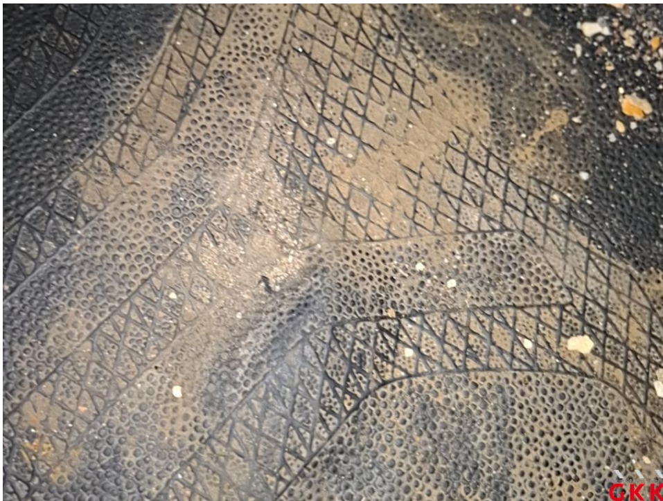
Bild 30 Fahrerhaus, Bodenbelag, beschädigt, Smartrepair