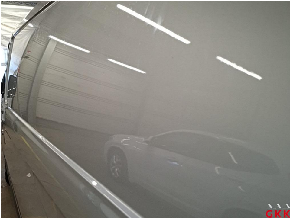
Bild 15 Fahrzeug, außen, Lackierung verwittert / matt, aufbereiten