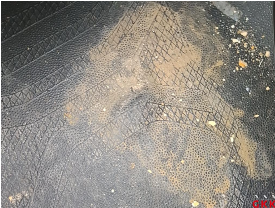
Bild 29 Fahrerhaus, Bodenbelag, beschädigt, Smartrepair