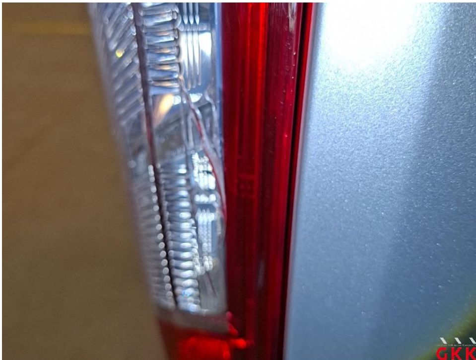
Bild 18 Rückleuchte rechts, außen, zerbrochen, ersetzen