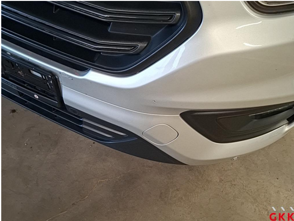
Bild 19 Stoßfänger vorne, Verkleidung oberhalb -lackiert-, verkratzt, lackieren