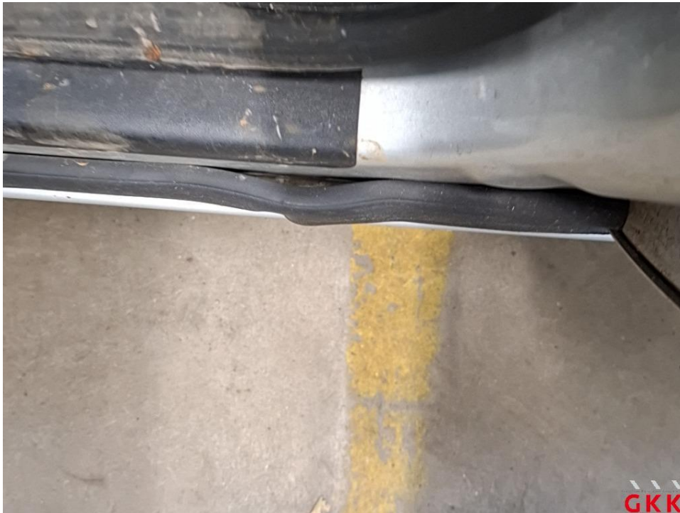
Bild 23 Tür vorne links, Dichtung -Einstieg-, beschädigt, ersetzen