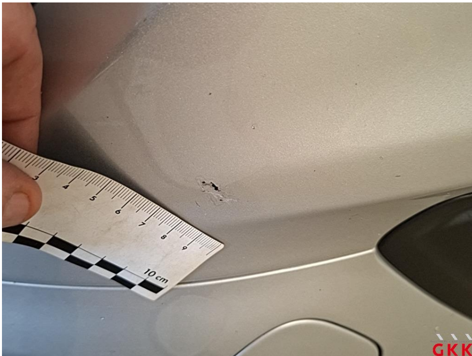
Bild 20 Stoßfänger vorne, Verkleidung oberhalb -lackiert-, verkratzt, lackieren