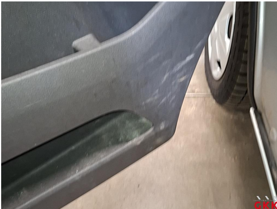
Bild 28 Fahrzeug, innen, verkratzt und verschmutzt, aufbereiten