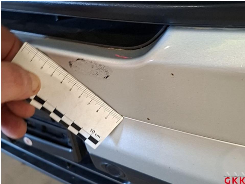
Bild 21 Stoßfänger vorne, Verkleidung oberhalb -lackiert-, verkratzt, lackieren