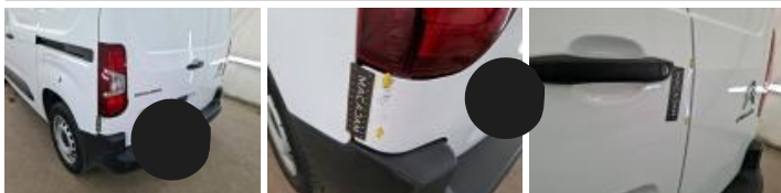
Pare-chocs AR, Griffe(s), Acceptable