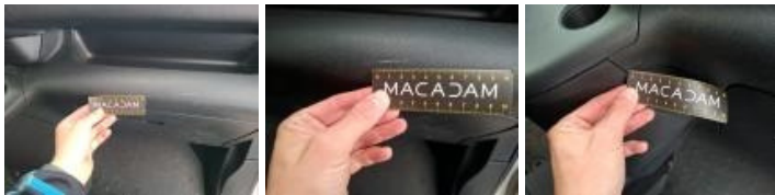
Intérieur, Tache, Nettoyer