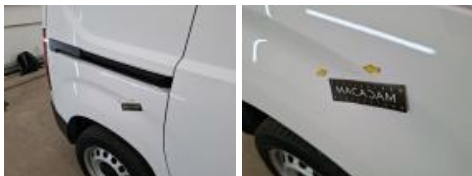
Porte AVD, Griffe(s), Acceptable