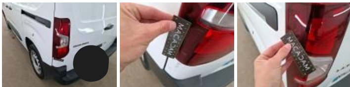
Coin pare-choc ARG, Griffe(s), Acceptable