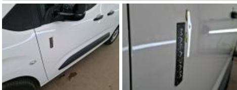
Boitier rétroviseur ext G, Griffe(s), 67 - Lustrage