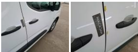
Moulure d'aile ARD, Griffe(s), Acceptable