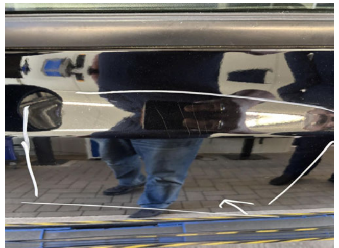
Tür vorne links - zerkratzt - Lackieren