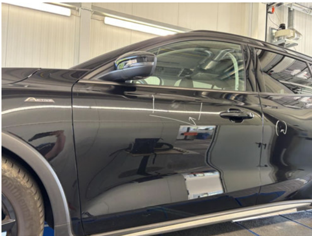
Tür vorne links - zerkratzt - Lackieren