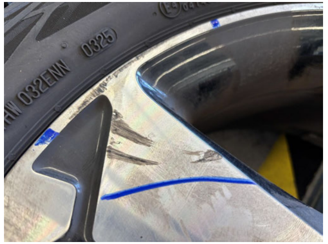
Felge (Sommer-Radsatz) - Vorderachse links - Minderwert (optischer Schaden)