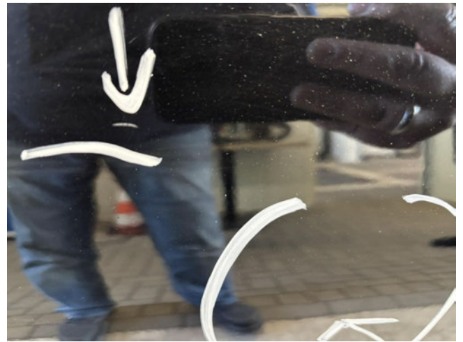
Tür hinten links - verdellt / verkratzt - instandsetzen und lackieren