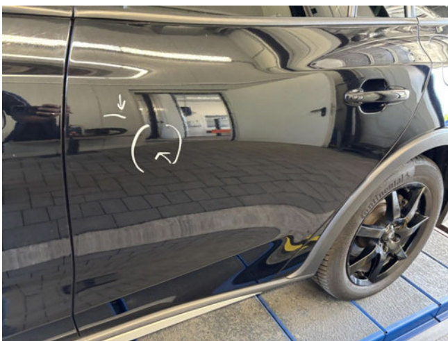
Tür hinten links - verdellt / verkratzt - instandsetzen und lackieren