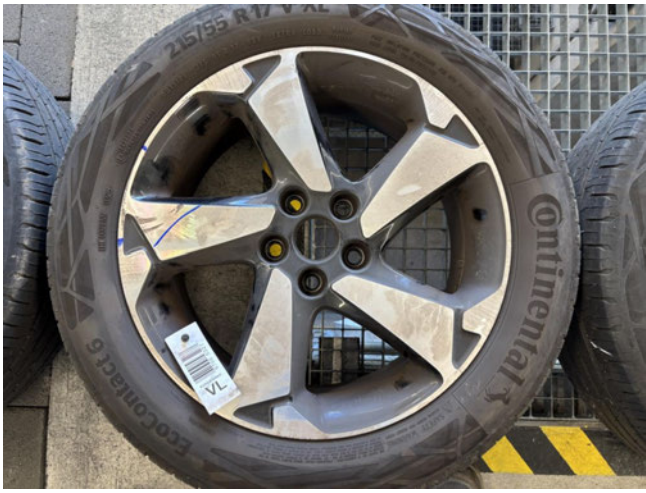
Felge (Sommer-Radsatz) - Vorderachse links - Minderwert (optischer Schaden)