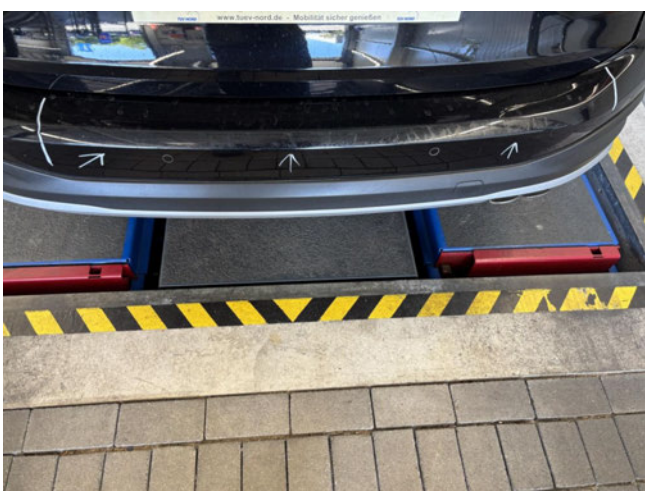
Stoßfänger hinten - Kratzer - auslegen