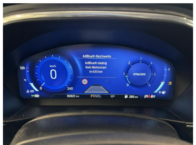
AdBlue Füllstand zu niedrig - auffüllen