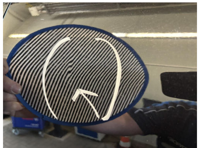
Tür hinten links - verdellt / verkratzt - instandsetzen und lackieren