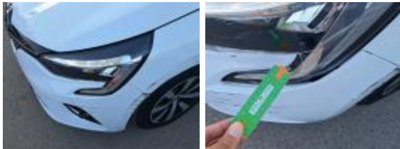
Aleta Del Iz Golpe(s) y arañazo(s) Reparar + Pintar