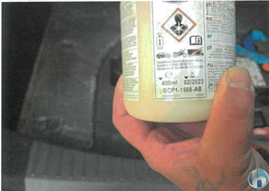
1. Tirfit Füllmittel