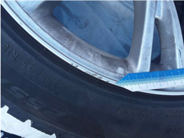
Beschädigung #4: 2.Radsatz: 2 Leichtmetallfelgen - Kratzer - erneuern