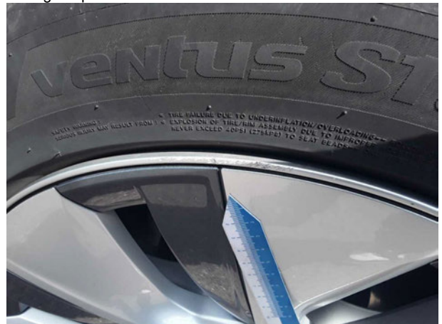
Beschädigung #2: Rad/Reifen: Leichtmetallfelge vorn rechts - Kratzer - Wertminderung