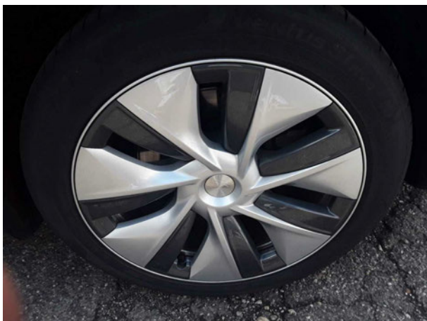
Abbildung 17: Montierte Bereifung