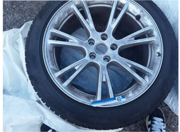
Beschädigung #4: 2.Radsatz: 2 Leichtmetallfelgen - Kratzer - erneuern