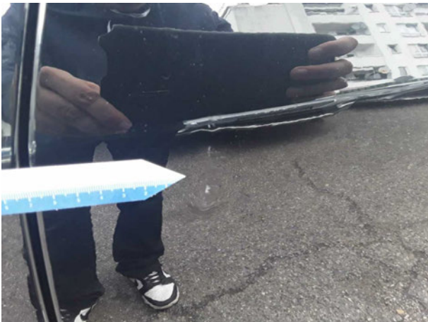
Beschädigung #5: Tür hinten links: Tür - Kratzer - instandsetzen und lackieren