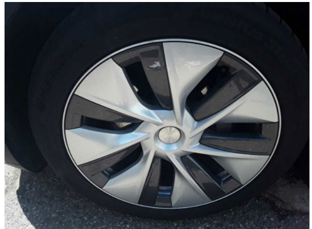
Abbildung 16: Montierte Bereifung