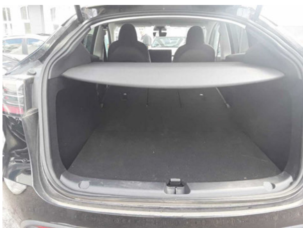
Abbildung 5: Laderaum