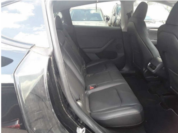
Abbildung 13: Innenraum hinten