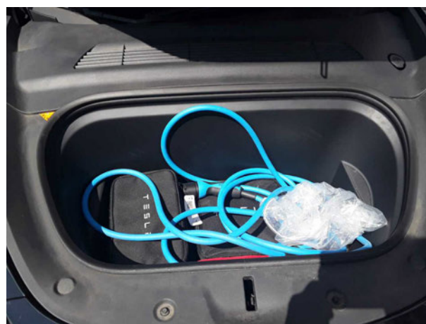
Abbildung 6: Motorraum