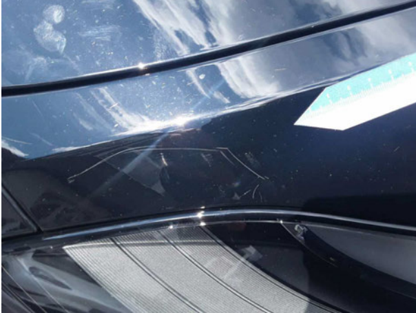
Beschädigung #1: Kotflügel links: Kotflügel links - Kratzer - auslegen / polieren