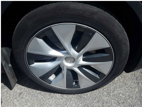
Abbildung 15: Montierte Bereifung