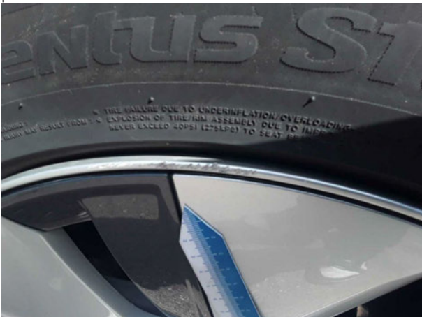
Beschädigung #2: Rad/Reifen: Leichtmetallfelge vorn rechts - Kratz... Wertminderung