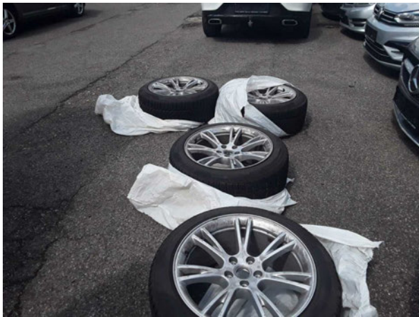
Abbildung 21: Sonstiges