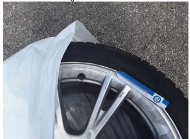
Beschädigung #3: 2.Radsatz: 1 Leichtmetallfelge - Kratzer - erneuern