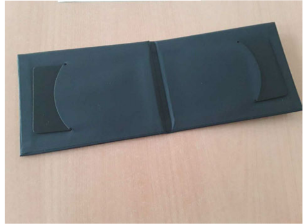
Abbildung 20: Sonstiges