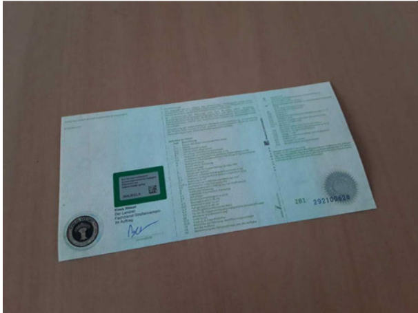
Abbildung 19: Sonstiges