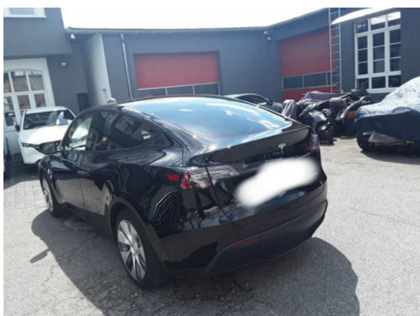
Abbildung 3: Schräg hinten