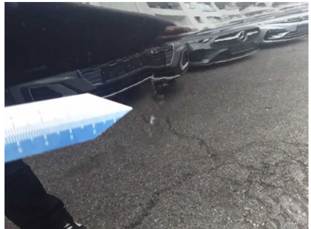
Beschädigung #5: Tür hinten links: Tür - Kratzer - instandsetzen und lackieren