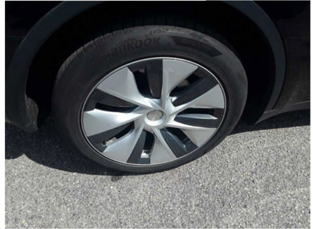
Abbildung 14: Montierte Bereifung