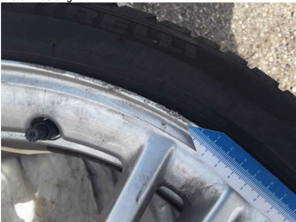
Beschädigung #3: 2.Radsatz: 1 Leichtmetallfelge - Kratzer - erneuern