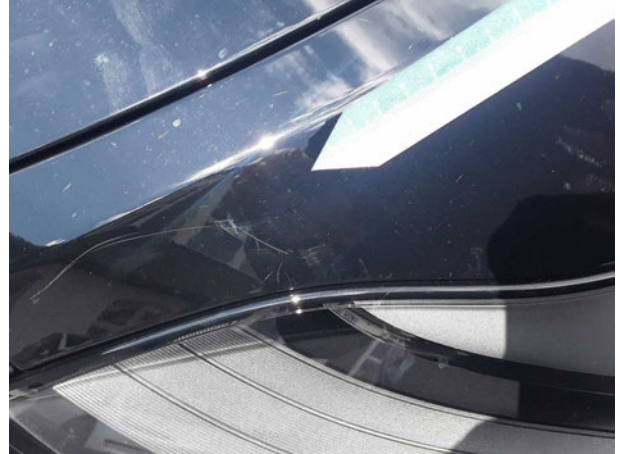
Beschädigung #1: Kotflügel links: Kotflügel links - Kratzer - auslegen / polieren