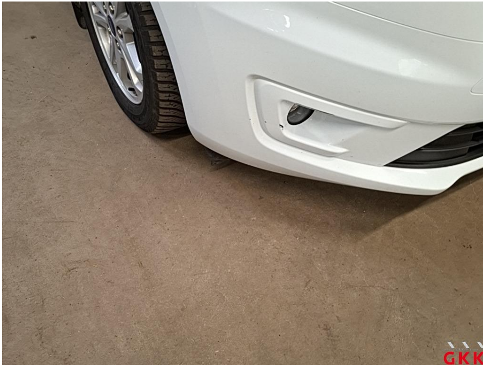
Bild 17 Stoßfänger vorne, Verkleidung unterhalb -lackiert-, verkratzt, lackieren