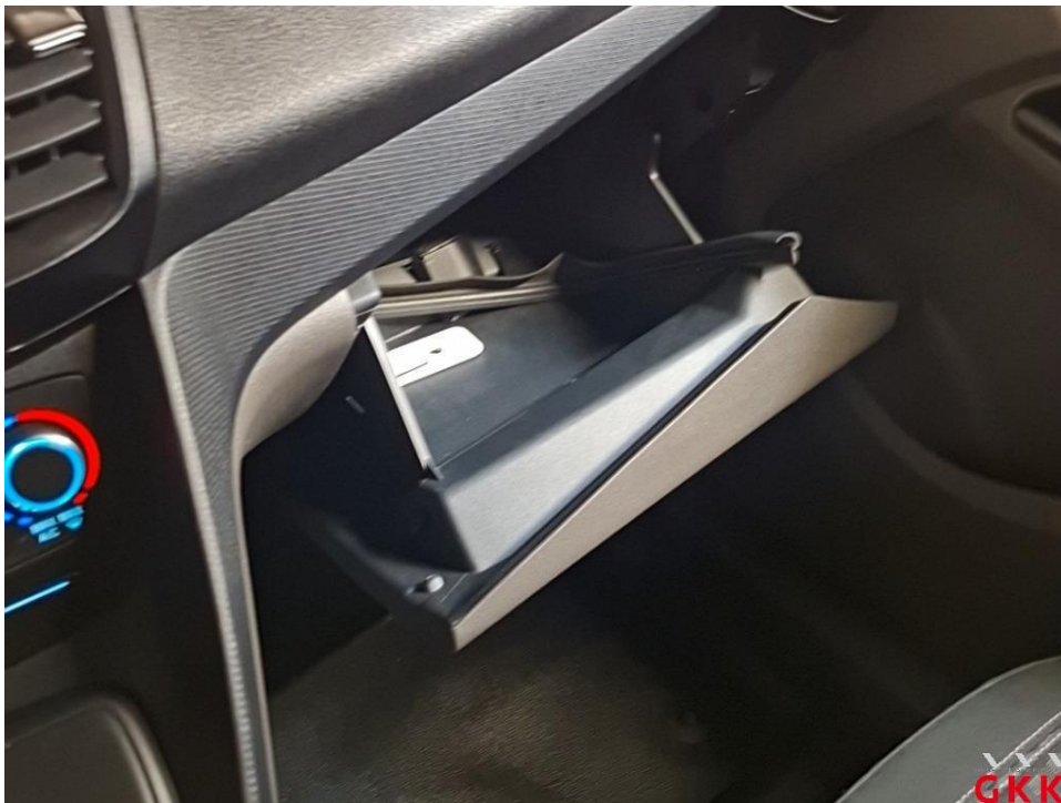
Bild 16 HU (Hauptunters.), PKW / Transporter, kein gültiger Nachweis vorhanden, durchführen