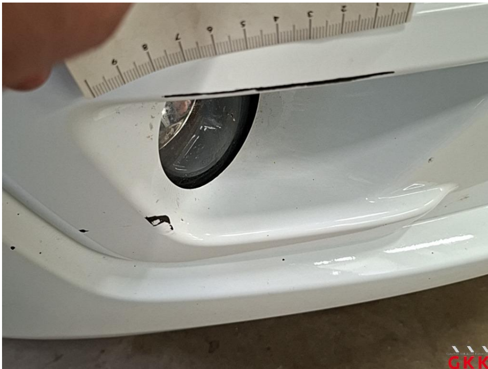
Bild 18 Stoßfänger vorne, Verkleidung unterhalb -lackiert-, verkratzt, lackieren