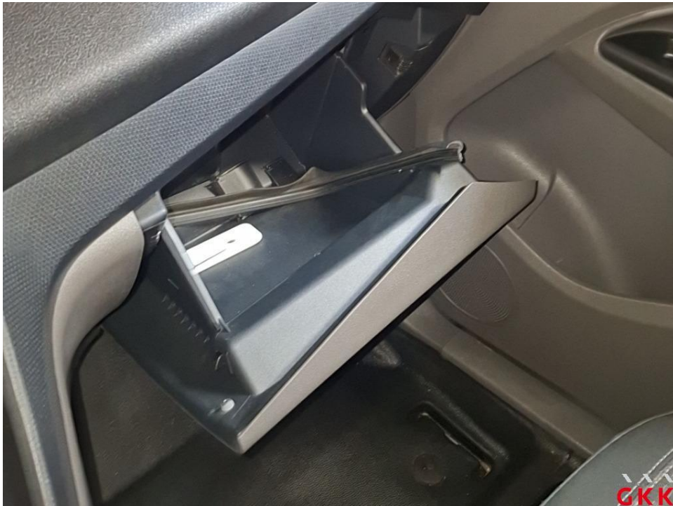
Bild 13 Bordmappe, komplett, fehlt, ersetzen