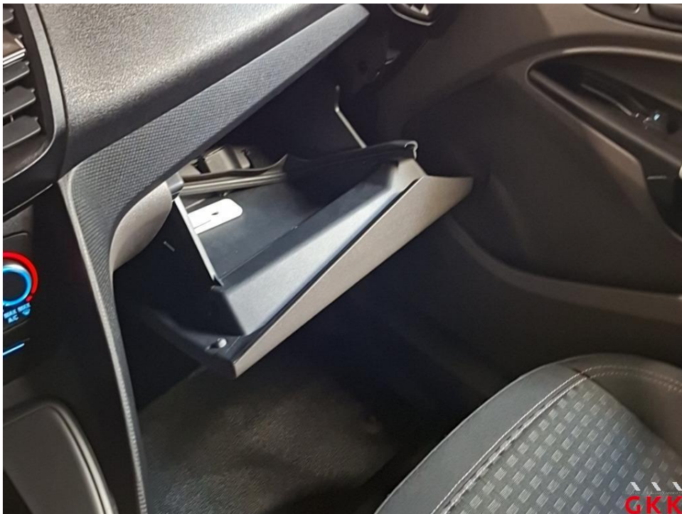
Bild 14 Inspektion groß, Kleintransporter, kein gültiger Nachweis vorhanden, durchführen