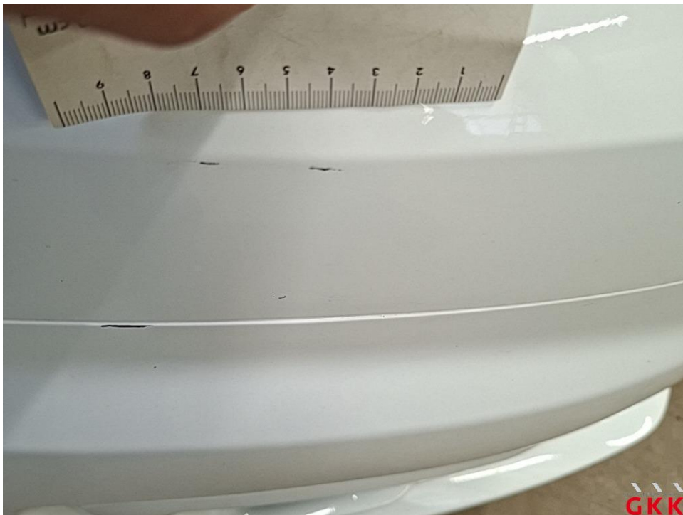
Bild 20 Stoßfänger vorne, Verkleidung oberhalb -lackiert-, verkratzt, lackieren