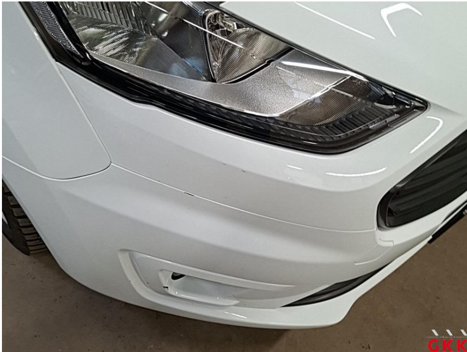
Bild 19 Stoßfänger vorne, Verkleidung oberhalb -lackiert-, verkratzt, lackieren