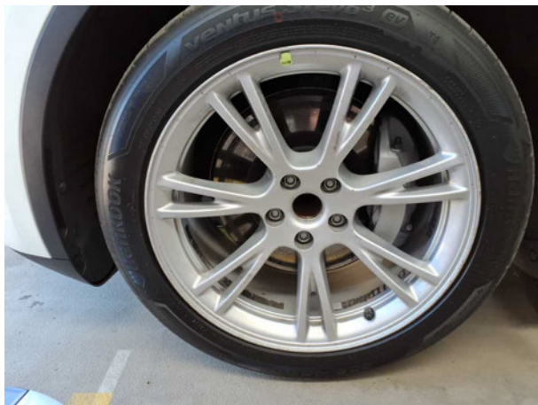
Beschädigung #1: Rad/Reifen: Leichtmetallfelge vorn links - verkratzt... verschürft - erneuern