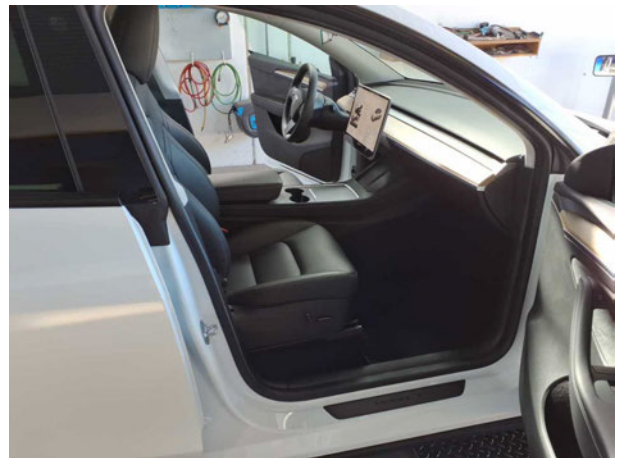
Abbildung 8: Innenraum vorne