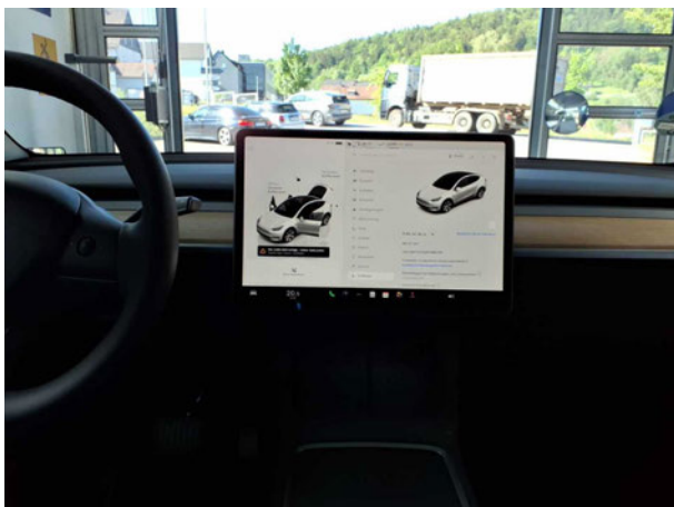
Abbildung 11: Instrumententafel