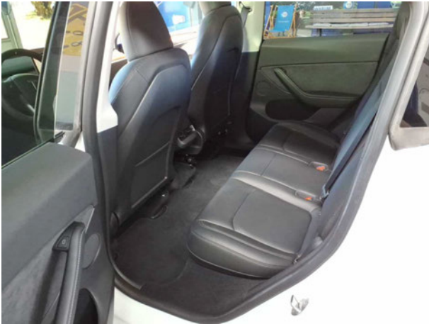
Abbildung 13: Innenraum hinten