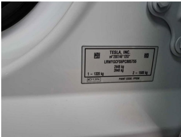
Abbildung 7: FIN