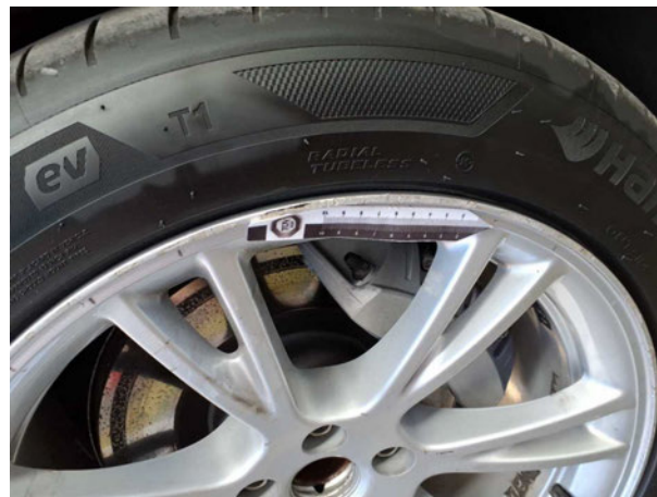
Beschädigung #1: Rad/Reifen: Leichtmetallfelge vorn links - verkratzt / verschürft - erneuern