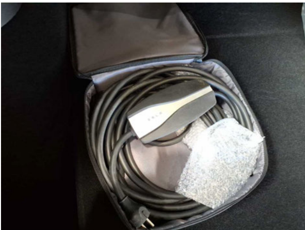
Abbildung 17: Sonstiges