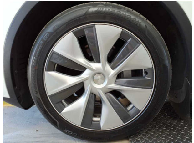
Abbildung 14: Montierte Bereifung