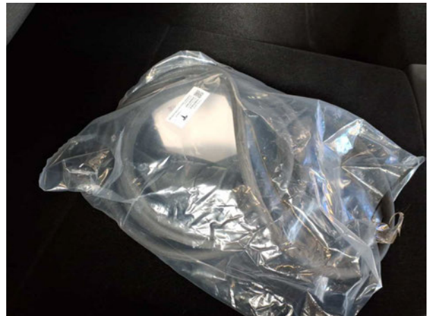
Abbildung 16: Sonstiges