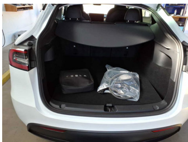
Abbildung 5: Laderraum