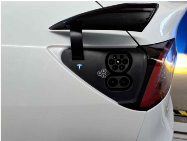
Abbildung 15: Ladebuchse/Tankstutzen