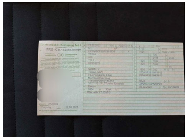
Abbildung 12: Zulassungsdocument(e)