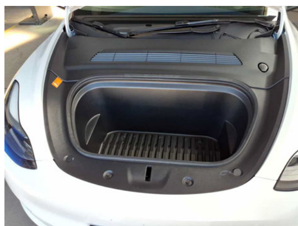
Abbildung 6: Motorraum