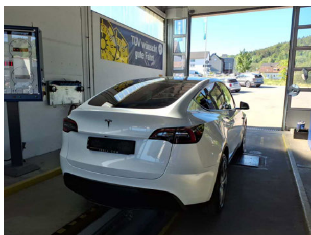
Abbildung 3: Schräg hinten