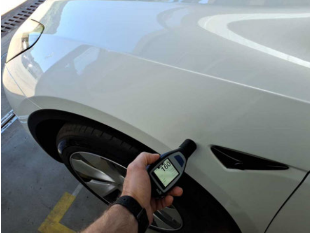
Nacklackierung 1: Kotflügel links