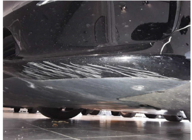
Beschädigung #8: Stossfänger vorn: Stossfänger vorn - verkratzt / verschürft - instandsetzen und lackieren