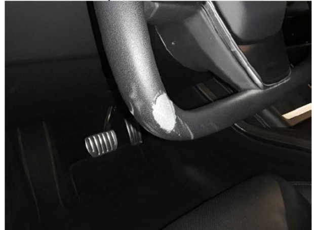
Beschädigung #7: Lenkanlage: Lenkradummantelung - gebrochen / gerissen - erneuern