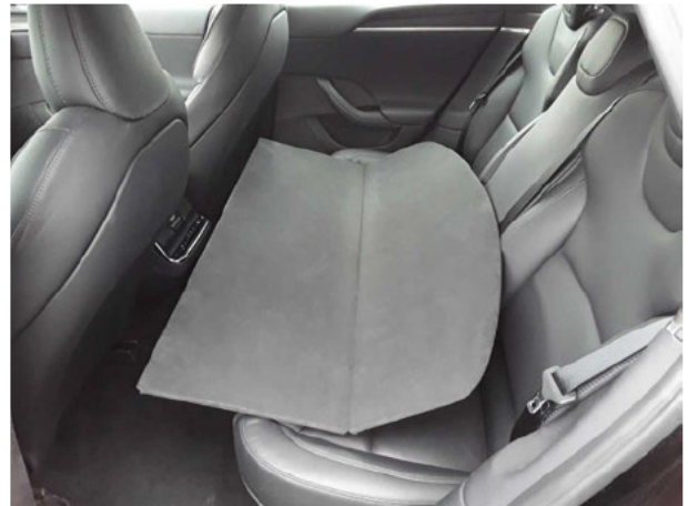
Abbildung 16: Sonstiges