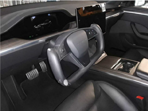
Beschädigung #7: Lenkanlage: Lenkradummantelung - gebrochen / gerissen - erneuern