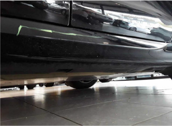
Beschädigung #6: Schweller links: Verkleidung - verkratzt / verschürft... Smart Repair