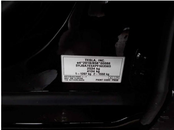
Abbildung 7: FIN