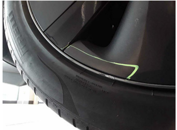
Beschädigung #4: Rad/Reifen: Leichtmetallfelge hinten rechts - verkratzt / verschürft - Wertminderung