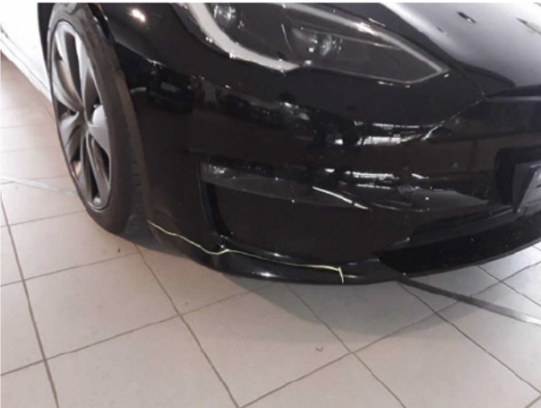
Beschädigung #8: Stossfänger vorn: Stossfänger vorn - verkratzt / verschürft - instandsetzen und lackieren