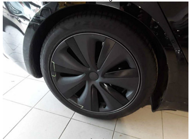
Beschädigung #4: Rad/Reifen: Leichtmetallfelge hinten rechts - verkratzt / verschürft - Wertminderung