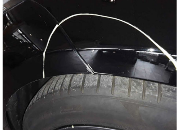
Beschädigung #2: Kotflügel links: Kotflügel links - verkratzt / verschürft - Smart Repair