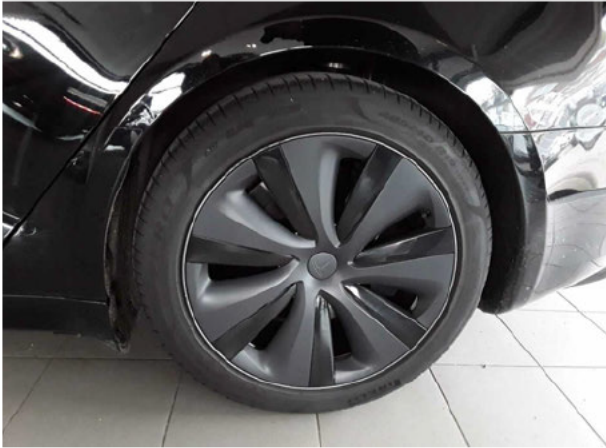
Abbildung 13: Montierte Bereifung