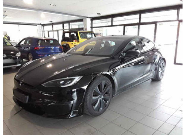
Abbildung 2: Schräg vorne