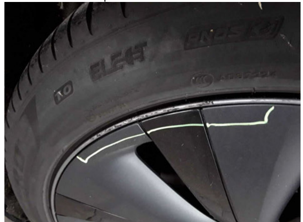
Beschädigung #3: Rad/Reifen: Leichtmetallfelge hinten links - verkratzt / verschürft - Wertminderung