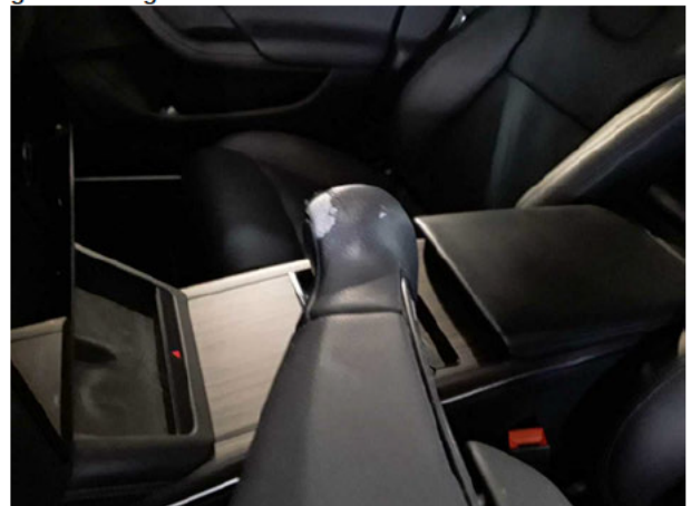
Beschädigung #7: Lenkanlage: Lenkradummantelung - gebrochen / gerissen - erneuern