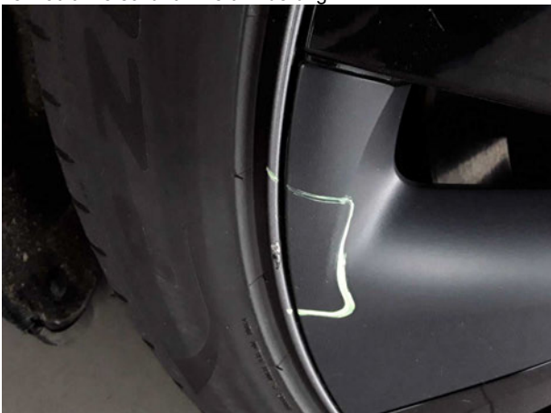
Beschädigung #3: Rad/Reifen: Leichtmetallfelge hinten links - verkratzt / verschürft - Wertminderung