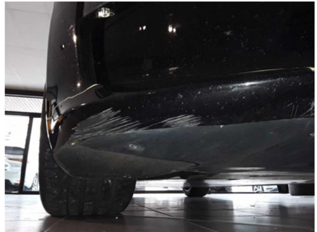
Beschädigung #8: Stossfänger vorn: Stossfänger vorn - verkratzt / verschürft - instandsetzen und lackieren