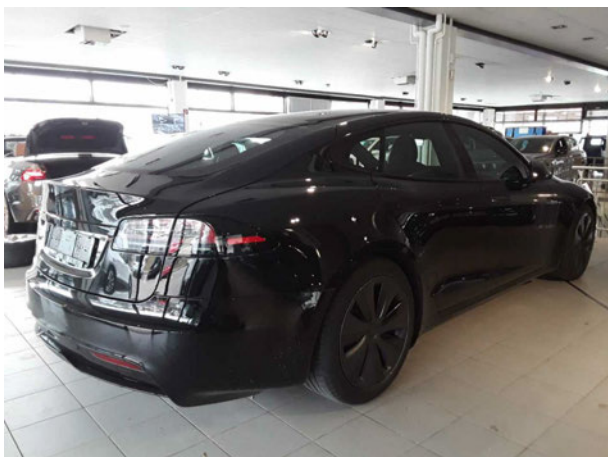
Abbildung 3: Schräg hinten