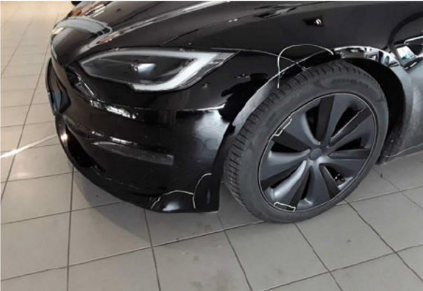
Beschädigung #8: Stossfänger vorn: Stossfänger vorn - verkratzt / verschürft - instandsetzen und lackieren