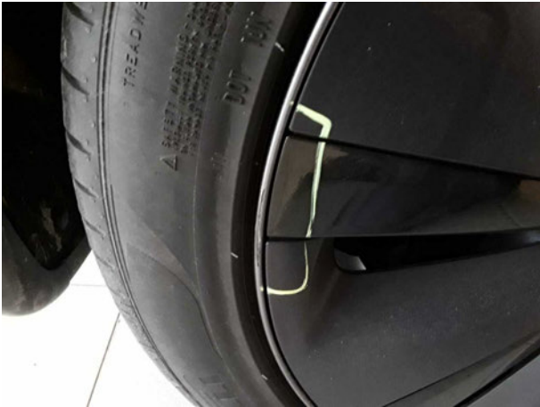
Beschädigung #4: Rad/Reifen: Leichtmetallfelge hinten rechts - verkratzt / verschürft - Wertminderung