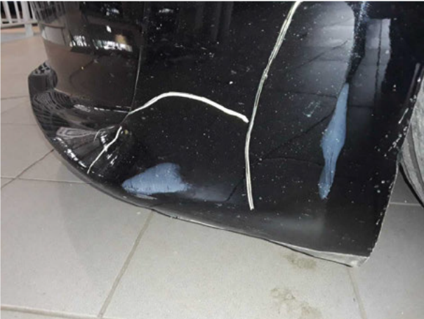
Beschädigung #8: Stossfänger vorn: Stossfänger vorn - verkratzt / verschürft - instandsetzen und lackieren