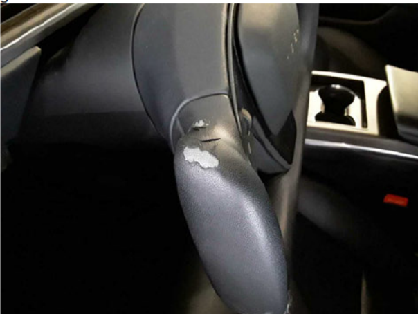
Beschädigung #7: Lenkanlage: Lenkradummantelung - gebrochen / gerissen - erneuern