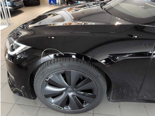
Beschädigung #2: Kotflügel links: Kotflügel links - verkratzt / verschü... - Smart Repair