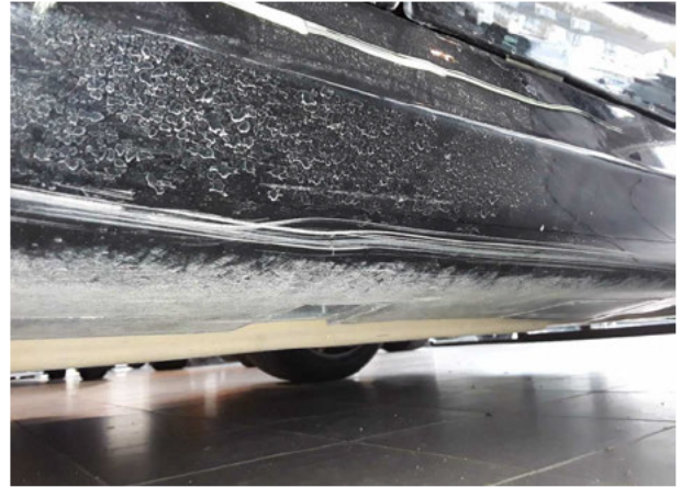
Beschädigung #6: Schweller links: Verkleidung - verkratzt / verschürft - Smart Repair