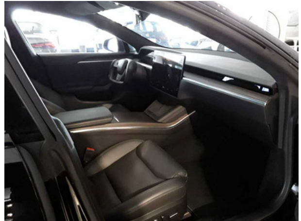
Abbildung 8: Innenraum vorne