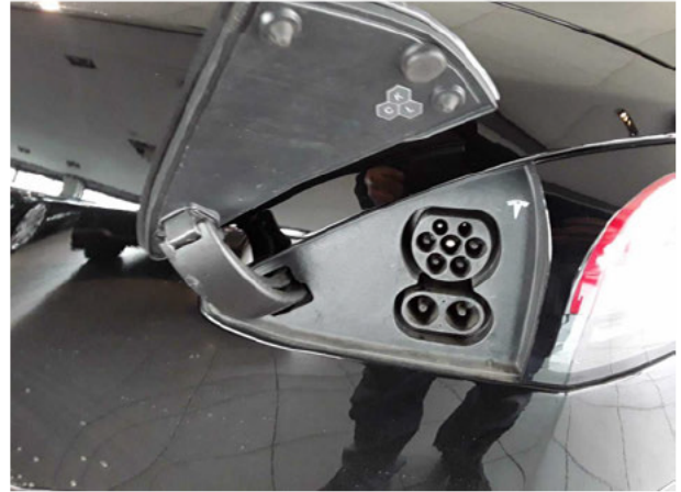
Abbildung 14: Ladebuchse/Tankstutzen