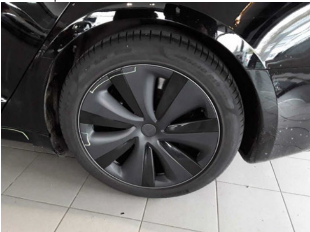
Beschädigung #3: Rad/Reifen: Leichtmetallfelge hinten links - verkratzt / verschürft - Wertminderung