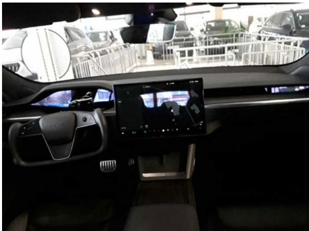
Abbildung 11: Instrumententafel