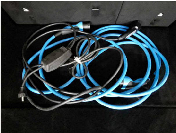
Abbildung 15: Sonstiges