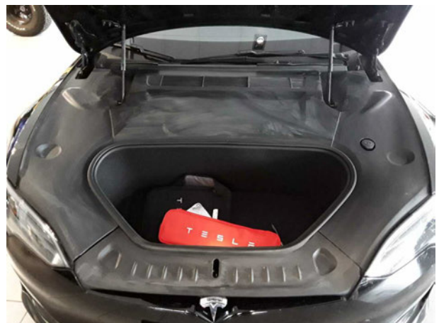
Abbildung 6: Motorraum