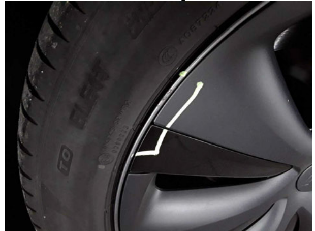
Beschädigung #5: Rad/Reifen: Leichtmetallfelge vorn links - verkratzt / verschürft - Wertminderung