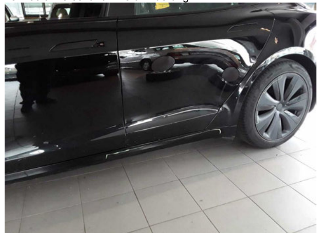
Beschädigung #6: Schweller links: Verkleidung - verkratzt / verschürft - Smart Repair