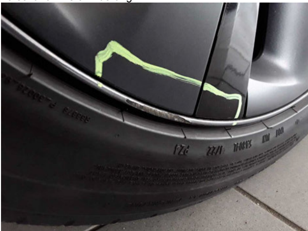
Beschädigung #5: Rad/Reifen: Leichtmetallfelge vorn links - verkratzt... verschürft - Wertminderung