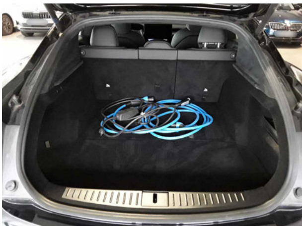
Abbildung 5: Laderaum