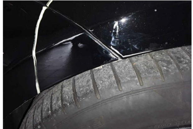
Beschädigung #8: Stossfänger vorn: Stossfänger vorn - verkratzt / verschürft - instandsetzen und lackieren