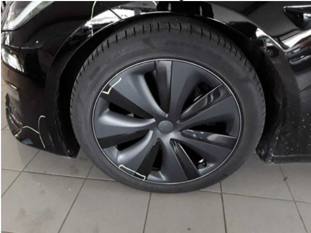
Beschädigung #5: Rad/Reifen: Leichtmetallfelge vorn links - verkratzt... verschürft - Wertminderung