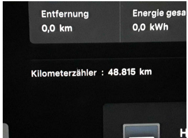
Abbildung 10: Laufleistung