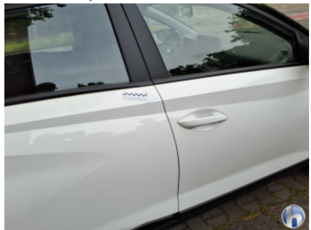
3. Tür Hinten - Rechts Kratzer - Smart Repair