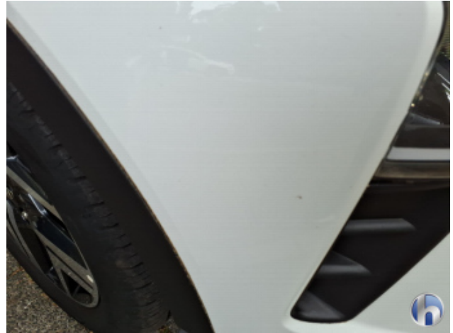
1. Kotflügel Vorne - Rechts Kratzer - Smart Repair