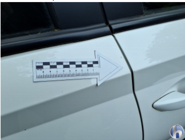
3. Tür Hinten - Rechts Kratzer - Smart Repair