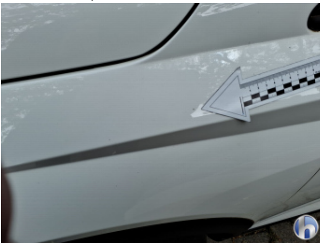
2. Kotflügel Vorne - Links Kratzer - Smart Repair