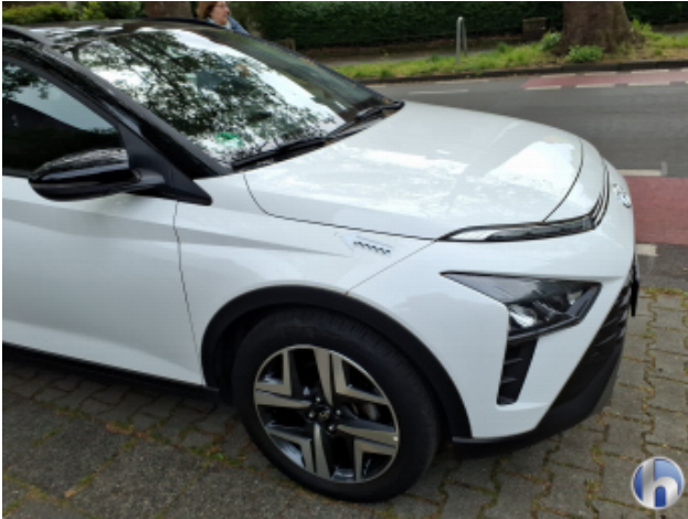
1. Kotflügel Vorne - Rechts Kratzer - Smart Repair