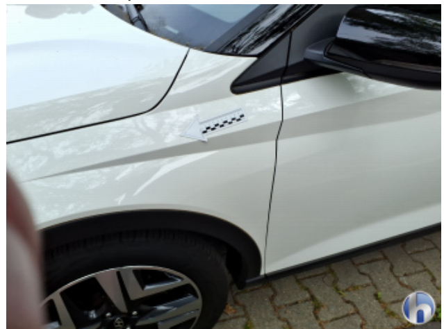
2. Kotflügel Vorne - Links Kratzer - Smart Repair