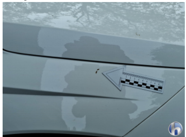
1. Kotflügel Vorne - Rechts Kratzer - Smart Repair