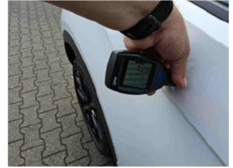
Lackstärke Seitenwand hinten rechts