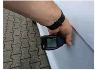
Lackstärke Tür vorne links