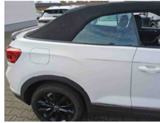
Lackstärke Tür hinten rechts