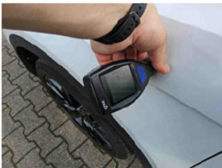
Lackstärke Kotflügel vorne links