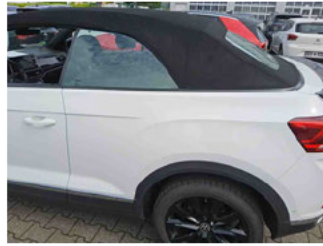
Lackstärke Tür hinten links