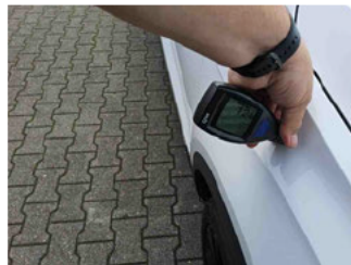
Lackstärke Kotflügel vorne rechts