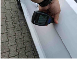
Lackstärke Tür vorne rechts