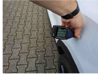
Lackstärke Seitenwand hinten links