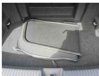
Zubehör - Sonderausstattung