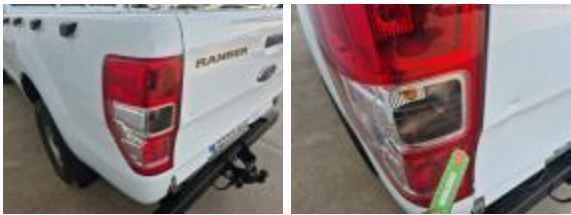
Aleta Tras Iz Rayado Reparar + Pintar