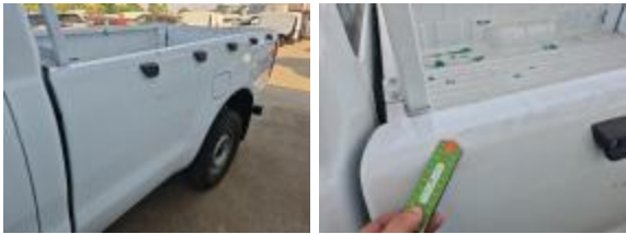
Puerta Delant Iz Golpe(s) y arañazo(s) Reparar + Pintar