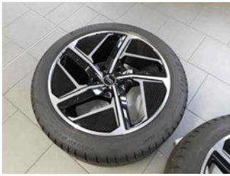
Räder - Rad beiliegend #4