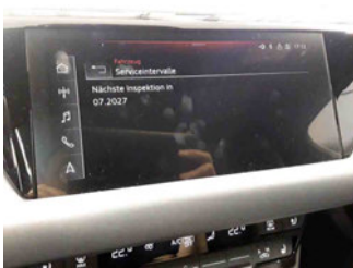
Fahrzeug - Serviceunterlagen / Wartungsnachweis