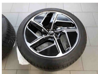
Räder - Rad beiliegend #1