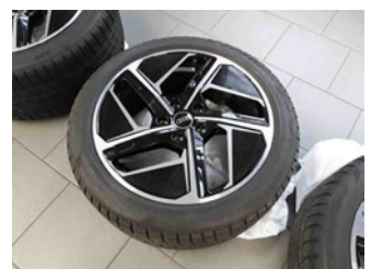
Räder - Rad beiliegend #3