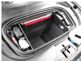
Equipment - Bordwerkzeug