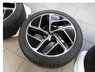
Räder - Rad beiliegend #2