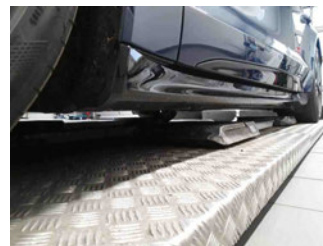
Seitenansicht - Schweller links