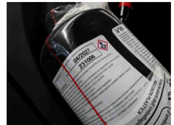
Räder - Haltbarkeitsdatum Tirefit