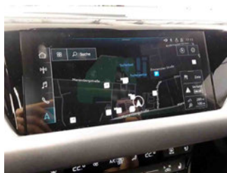
Innenraum - Navigationsgerät/Radio