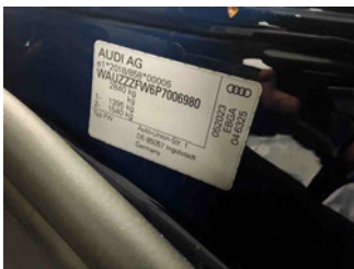
Fahrzeug - Typenschild/Fahrgestellnummer