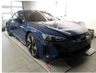
Fahrzeugansicht - diagonal vorne rechts