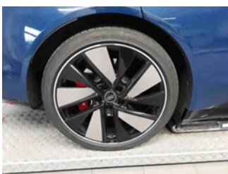
Räder - Rad montiert hinten rechts