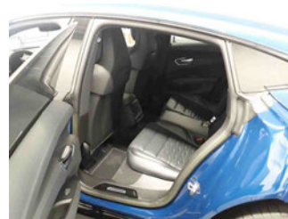
Innenraum - hinten