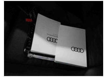
Equipment - Boardmappe/ Securitybag