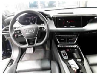
Innenraum - Mittelkonsole