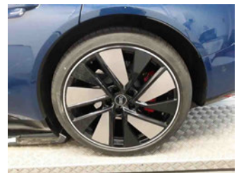
Räder - Rad montiert hinten links