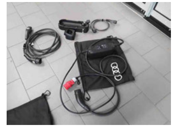
Equipment - Ladeequipment