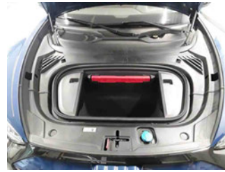
Fahrzeug - Motorraum offen