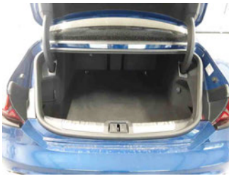
Innenraum - Kofferraum