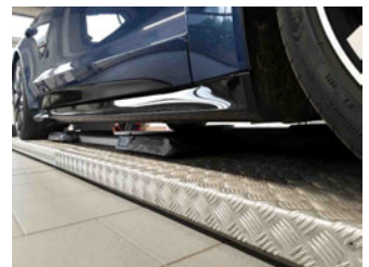
Seitenansicht - Schweller rechts