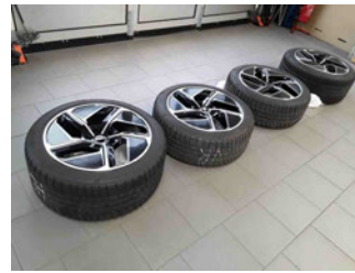
Räder - eingelegt im Fahrzeug