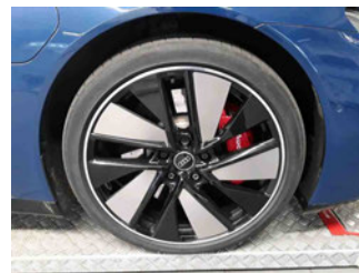
Räder - Rad montiert vorne rechts