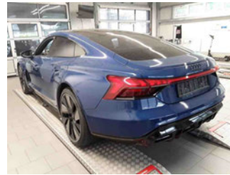
Fahrzeugansicht - diagonal hinten links