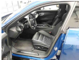
Innenraum - vorne