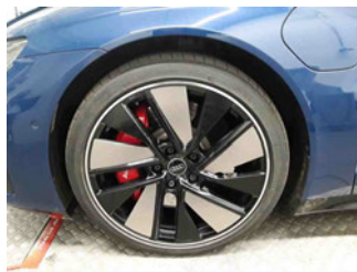
Räder - Rad montiert vorne links