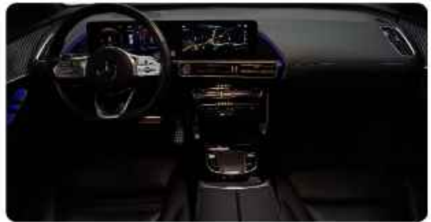
✓ Voor Interieur