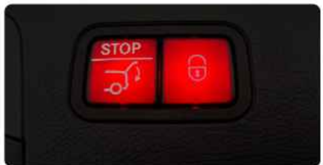
✓ Elektrisch Bedienbare Achterklep