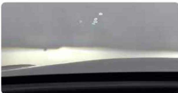
✓ Head-Up Display