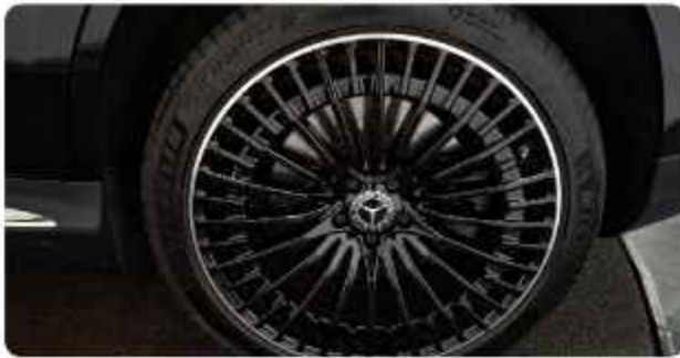
✓ Lichtmetalen Velgen