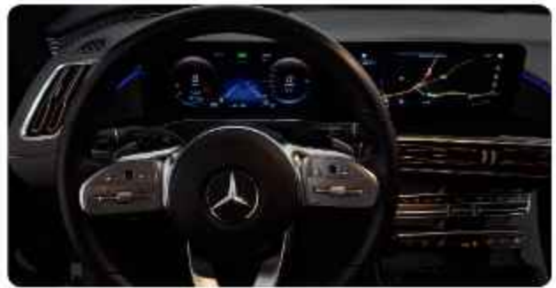
✓ Lederen Stuur