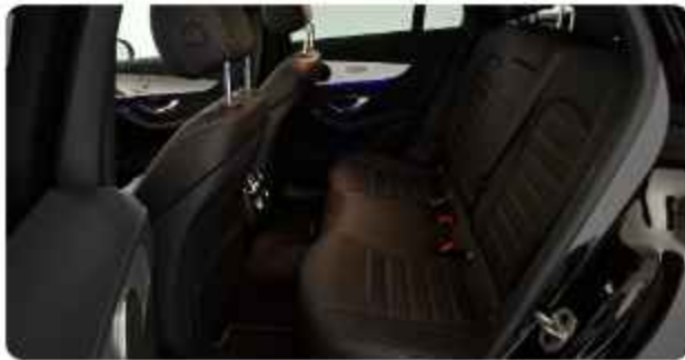
✓ Achter Interieur