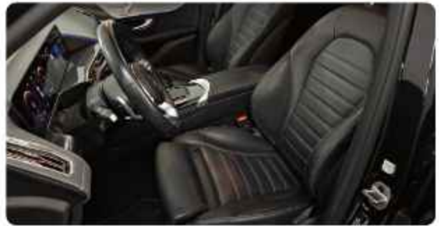
✓ Lederen Bekleding